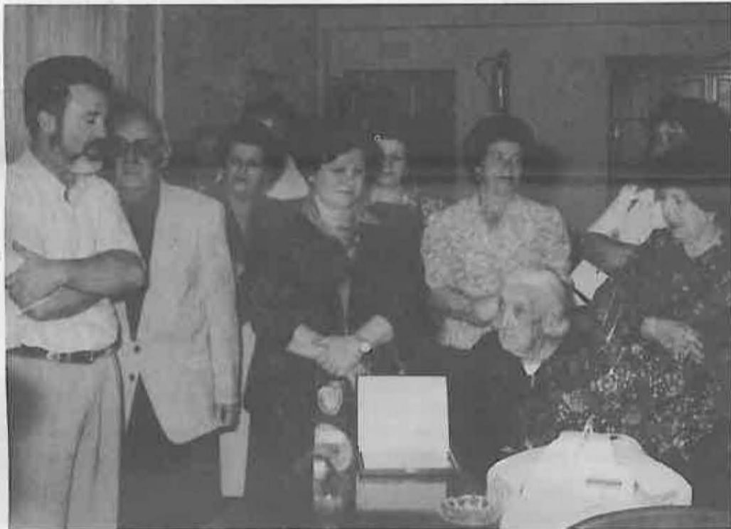
La Asociación de Amas de Casa en una de sus actividades

(a lo que hay que añadir otras 150.000 ptas., proveniente de la publicidad de Caja Madrid en Campo de Fútbol para el fomento de la cantera de juveniles; además se le concede la utilización gratuita del terreno de juego).