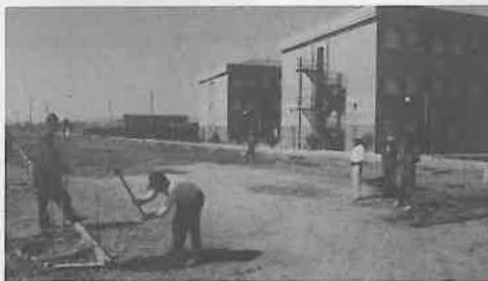
Las instalaciones serán de las mejores de España

La instalación también contará con una zona edifica-