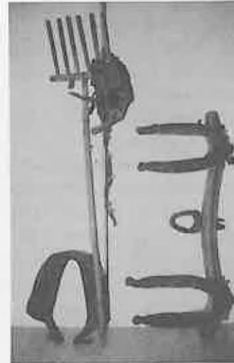
El Aula de Estudios recopiló los objetos

Del 30 de marzo al 6 de abril, se puede visitar en el Salón de Usos Múltiples del Ayuntamiento, una exposición sobre Útiles de Trabajo de Labranza, que ha sido organizada por los componentes del Aula de Estudios de Miguelturra, de la U. Popular.