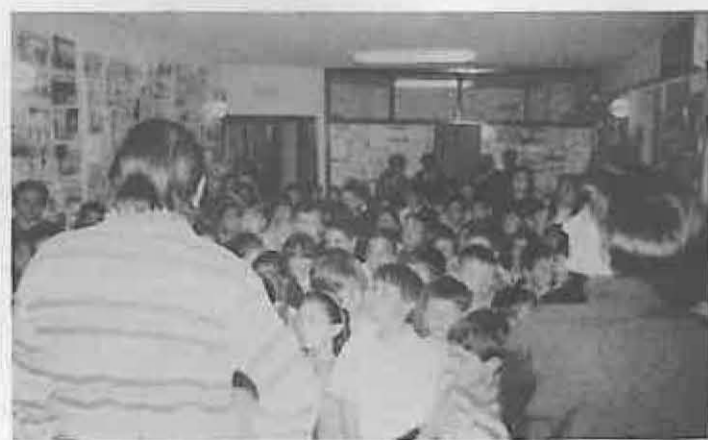
Participaron colegios de la Mancomunidad

Tanto nuestra Constitución en su artículo 51, como la Ley para la Defensa de los Consumidores y Usuarios establecen una serie de principios fundamentales para salvaguardar los derechos de los Consumidores y Usuarios.