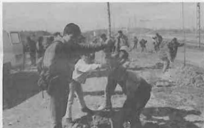
Todos pusieron su respectivo árbol

Los lugares elegidos este año han sido el anejo de Peralbillo y el Barrio Oriente, en terrenos públicos. Los niños, ayudados por sus profesores, plantaron álamos y pinos. Posteriormente se invitó a