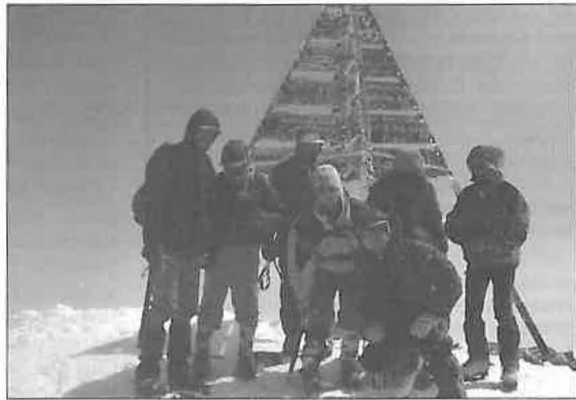
Montañeros churriegos en el TOUBKAL

El pasado 7 de abril, un total de 47 personas pertenecientes en su mayoría al Club de Actividades Deportivas en la Naturaleza de Miguelturra, partieron hacia el Alto Atlas marroquí dentro del proyecto MARoc'98 , donde tenían previsto realizar diferentes actividades de escalada y senderismo. Los parajes naturales visitados fueron, en primer lugar las impresionantes Gargantas del Todra situadas en el sudeste del país, donde se imponen de forma impresionante paredes de más de 400 m. de altura, allí se organizaron varios grupos, realizándose actividades de escalada y senderismo durante dos días. Tras estas variadas y fascinantes jornadas se desplazaron hasta la localidad de Asni, situada a 70 km. al Sur de Marrakech, y que constituye la puerta de