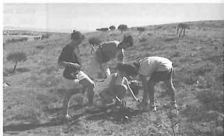
Campo de trabajo de 1994

Se da la circunstancia que esta será la segunda experiencia de este tipo que se desarrollará en nuestro municipio, ya que en 1994 el propio Taller de Ecología, entonces dependiente de la Universidad Popular, llevó otro programa similar.