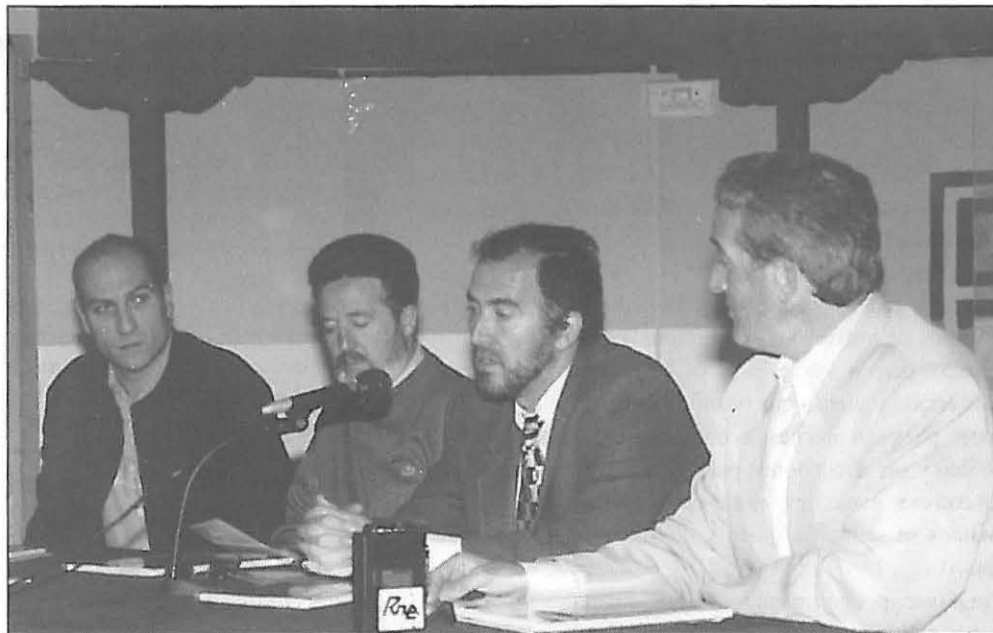
Momento de la presentación del cartel de las jornadas