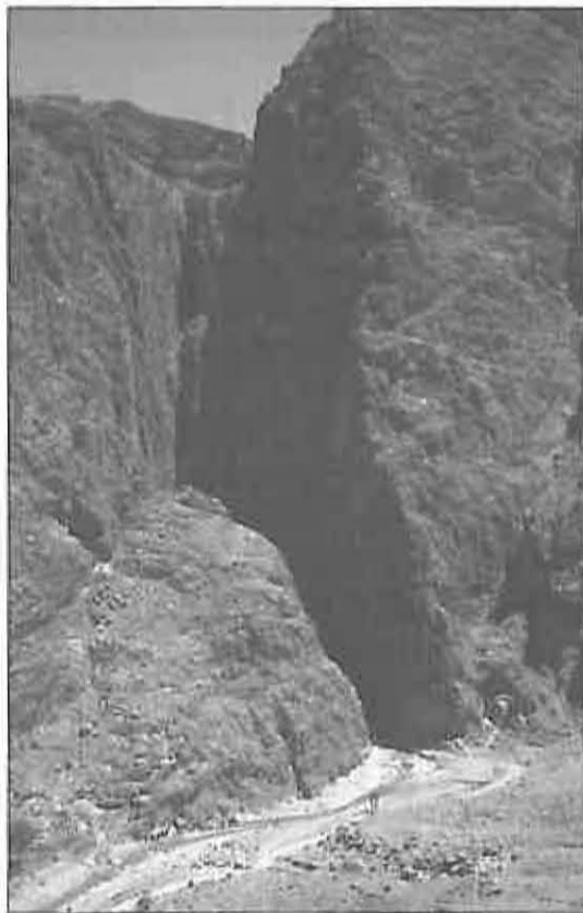
Gargantas de Todra.

MARoc'98 es la denominación de un proyecto organizado y dirigido por el Aula de Medio Ambiente del Dpto. de la Juventud del Ayto. de Miguelturra y el Club de Actividades Deportivas en la Naturaleza de Miguelturra (SADEN), con el objetivo de enriquecer cultural y deportivamente a jóvenes amantes del deporte-aventura y la Naturaleza en la provincia de Ciudad Real. El proyecto ha contado con la colaboración de la Diputación Provincial de Ciudad Real que ha subvencionado fuertemente esta actividad.