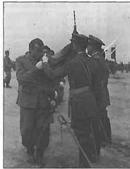
Una imagen invariable a lo largo de los años: el momento del beso a la bandera durante el acto de «la Jura».