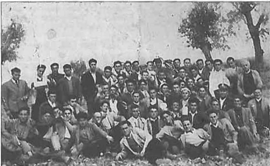
Aquí tenemos a la Quinta al completo. La Guardia Civil (en el centro) también acompañaba al grupo.