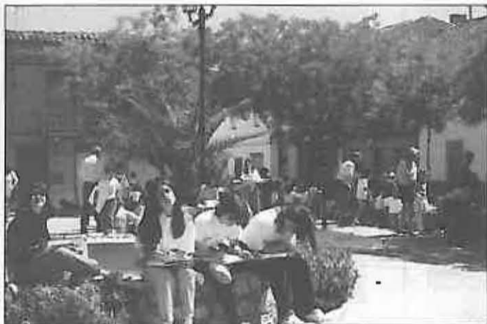
Concurso de pintura al aire libre

El programa se completa con las actividades deportivas (relacionadas en este propio BIM) y las religiosas.