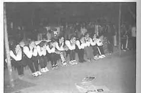
Momento de la actuación

El lugar, la plaza de la Constitución, y el momento elegidos, consiguieron la llamada de atención del público, que, en poco tiempo, rodearon el espacio escénico para contemplar esta innovadora actividad; pocos fueron los que quedaron indiferentes: unos valorando positivamente la representación y otros algo más críticos. Pero todos reconociendo el mérito de los 10 jóvenes actores que cambiaron por unos momentos la dinámica cotidiana de nuestra Plaza.