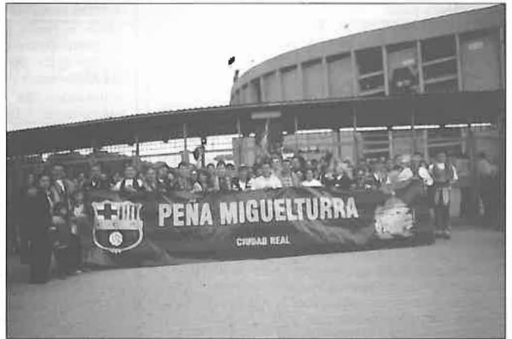
Miembros de la peña frente al Nou Camp

Para finalizar, desde la Junta Directiva queremos facilitar a todos los aficionados del Barcelona por el título de Liga 97/98 obtenido recientemente.