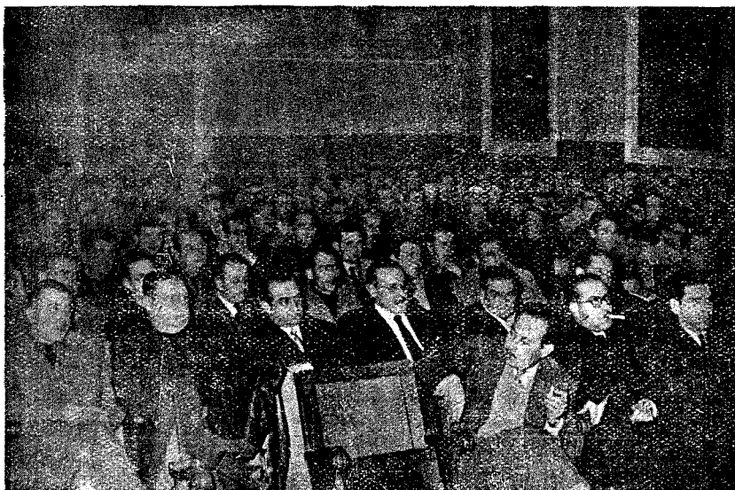
ASPECTO DEL SALÓN DURANTE EL ACTO

loquio donde algunos componentes de la Guardia de Franco intervinieron, pidiendo aclaraciones.