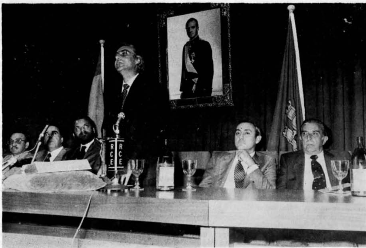
Habla el Presidente de la Junta de Comunidades

recientemente, el método experimental moderno se ha sofisticado en grado sumo, aparte de haberse vuelto enormemente costoso en dinero, requiere una organización jerárquica del trabajo y un trabajo por equipo, perfectamente planificado. De aquí que el trabajo del profesor universitario resulte hoy prácticamente imposible en la grandísima mayoría de los campos del saber y requiere el entorno a que antes me he referido..., en torno en cuya creación también contribuyen con su trabajo, tan silencioso como valioso, el personal no docente, cuyo esfuerzo hace posible una eficaz organización de medios materiales, tradicionalmente descuidado en muchos centros».