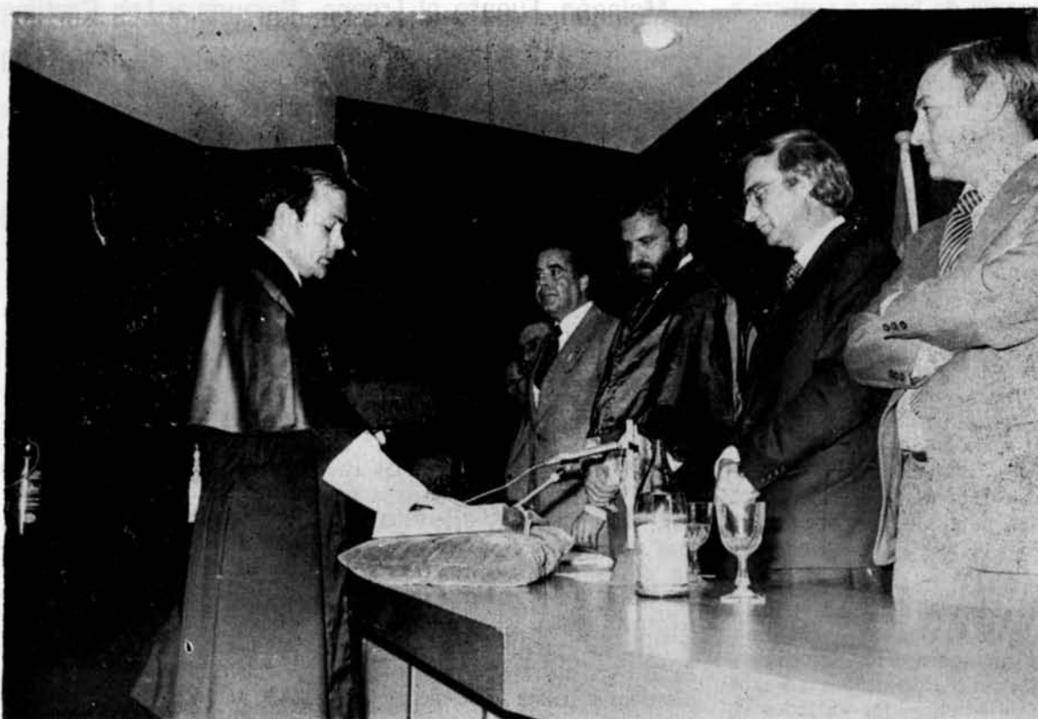
El nuevo rector juró su cargo

En el Colegio Universitario de Ciudad Real