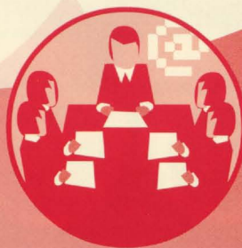
FIRMA DE ACTAS