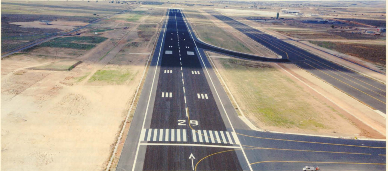
Pista del Aeropuerto Don Quijote, lista ya para recibir las aeronaves.