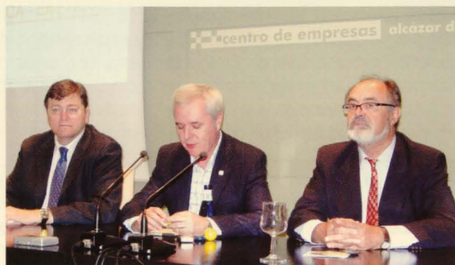
Inauguración de un nuevo curso sobre Relaciones con Entidades Financieras.

El CEEI de Ciudad Real, el Ayuntamiento de Alcázar de San Juan, y la Escuela de Organización Industrial (EOI) llevan ya