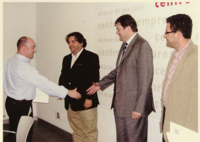
Imagen de la clausura del curso.

tualizado los conocimientos para mejorar las habilidades de dirección por parte del empresario y de sus colaboradores más directos.