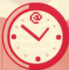
SELLADO DE TIEMPO