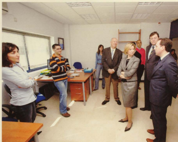
La Vicepresidenta y el Delegado de la Junta en Ciudad Real recorrieron las instalaciones del Parque Empresarial