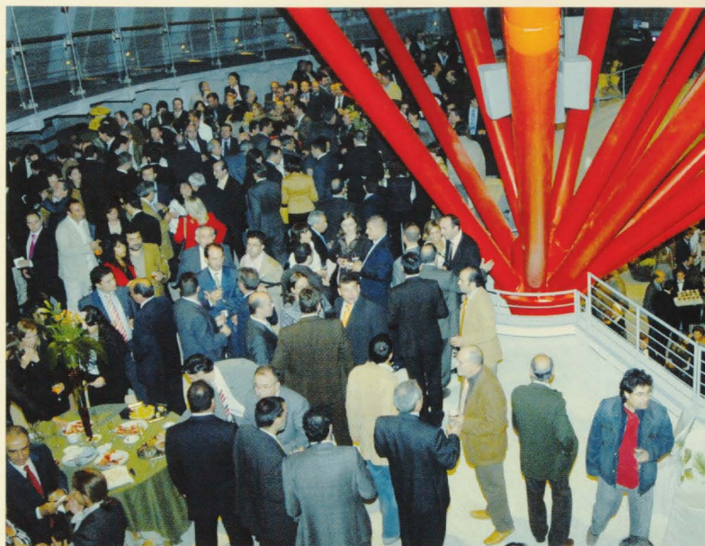
Vista general del acto en el Centro de Visitantes del Aeropuerto Don Quijote.

futuro depende de sí misma, "dejando atrás todo tipo de complejos, hemos sabido conquistar y construir nuestro futuro". Añadió que Castilla-La Mancha ha comprendido la coyuntura económica favorable actual y que "estamos sabiendo aprovechar y debemos aprovechar".