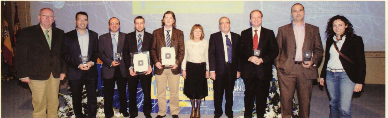
En el acto de clausura se entregaron los premios al mejor proyecto de creación de empresa innovadora de base tecnológica (EIBT) y a la mejor trayectoria de una EIBT