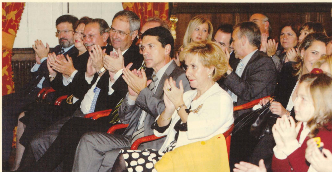
Todos los representantes políticos, económicos, culturales y sociales de Ciudad Real estuvieron presentes en este emotivo acto.

Arroyo, ex - rector de la UCLM, también valoró el compromiso de León con el desarrollo ubicándole en un grupo de "autodidactas" que impulsaron el avance de la ciudad y expresó su deseo de sacar el máximo partido al aeropuerto.