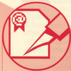
FIRMA DE ESCRITORIO

Acceda a la certificación digital para empresas y benefíciense de las ventajas de cinco herramientas exclusivas, disponibles gratuitamente