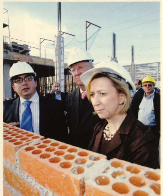
La vicepresidenta aprovechó la visita a las obras del CEEI para hacer un recorrido por el polígono industrial de La Nava, una zona de importante desarrollo industrial

ger este importante proyecto, mostrando la visión de futuro que tiene sobre su ciudad; y el excelente trabajo de los CEEIs, que se han convertido en una compañía imprescindible para los emprendedores.