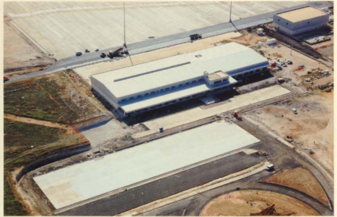
Vista aérea de la torre de control, central eléctrica y terminal de carga, entre otros.

correspondientes a la Categoría del ILS en condiciones de seguridad adecuadas.