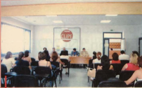
Momento de la presentación

Un curso para mujeres emprendedoras y empresarias se inauguró el día 7 de julio, en el Centro Local de Innovación y Promoción Empresarial de Tomelloso, se han inscrito 29 mujeres, la mayoría emprendedoras y será impartido por el Incyde.