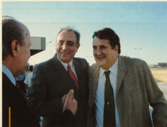
El presidente de Mostinsa con el vicepresidente de la Cámara de Comercio

en la feria internacional de alimentación de París, SIAL, en el año 2001, y tras su buena acogida, Mostinsa se decidió a comercializar el producto, cuya exclusiva de distribución actualmente la ostenta una de las firmas más reconocidas del sector, como es Zumos Pascual. ■