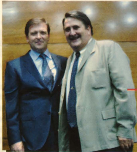
El Consejero de Industria y el vicepresidente de la Cámara, tras la toma de posesión