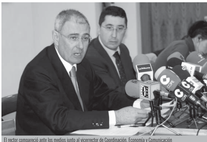
El rector compareció ante los medios junto al vicerrector de Coordinación, Economía y Comunicación

La UCLM es la sexta universidad española con menor tasa de abandono