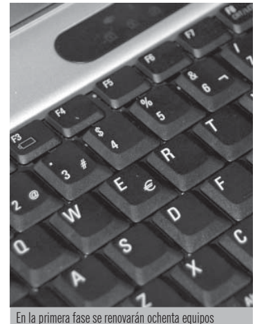
En la primera fase se renovarán ochenta equipos

Estos dos últimos elementos -el teclado con lector de tarjeta y la pantalla- se repiten en los puestos de trabajo fijos, que se completan con un equipo informático de sobremesa.