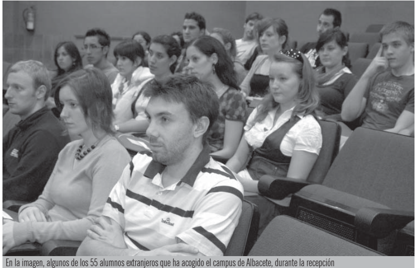
En la imagen, algunos de los 55 alumnos extranjeros que ha acogido el campus de Albacete, durante la recepción