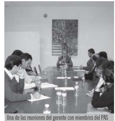
Una de las reuniones del gerente con miembros del PAS

Antes de que acabe el año, el gerente se habrá reunido con todo el PAS