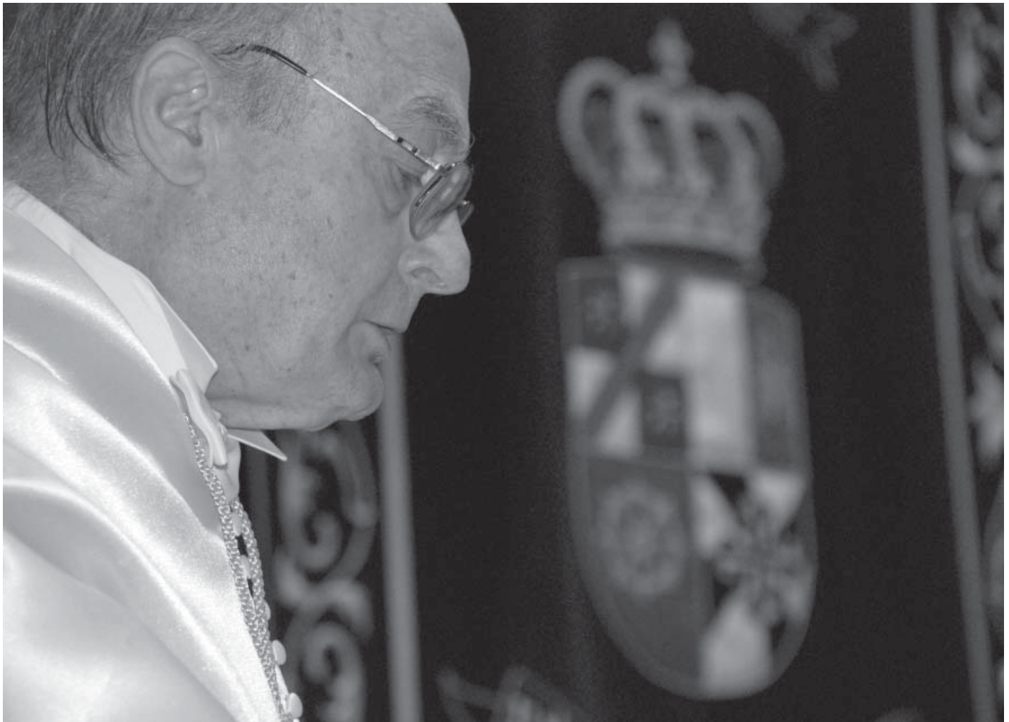
El pintor Luis Gordillo lee el discurso de aceptación del doctorado "honoris causa" por la Universidad de Castilla-La Mancha en la Facultad de Bellas Artes del Campus de Cuenca

investidura como doctor "honoris causa" de Luis Gordillo