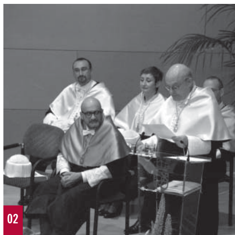
1. El rector impone al pintor Luis Gordillo uno de los atributos que le convierten en doctor "honoris causa" por la Universidad de Castilla-La Mancha 2. El artista sevillano da lectura a su discurso. Detrás de él, sus padrinos, en la Facultad de Bellas Artes de Cuenca 3. El artista sevillano recordó cómo se inició en la pintura y qué caminos ha seguido en su trayectoria artística 4. La tradicional procesión de doctores que abre la ceremonia de investidura como doctor "honoris causa" 5. Una panorámica de la mesa presidencial del acto