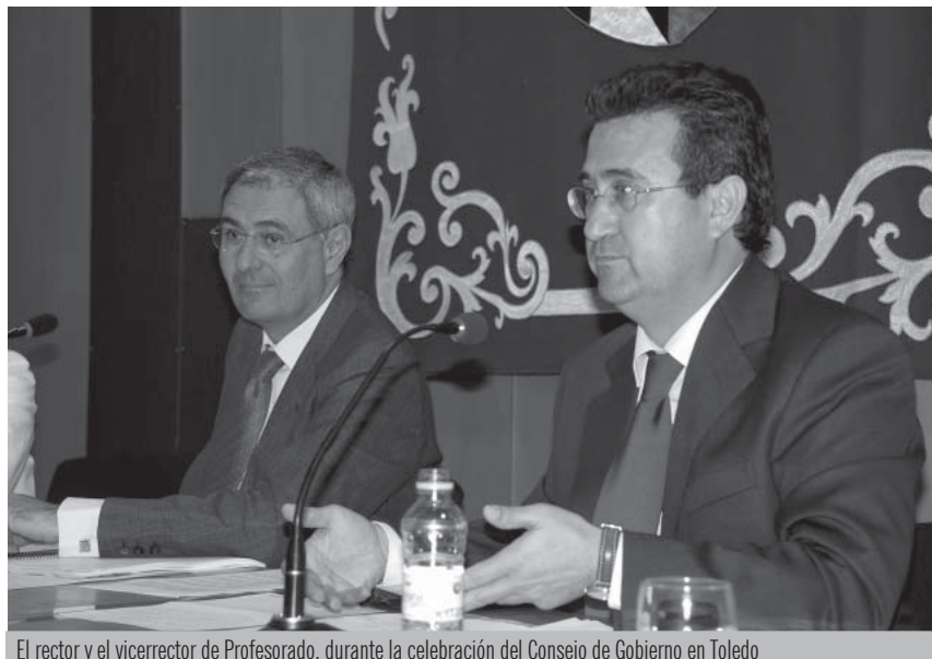
El rector y el vicerrector de Profesorado, durante la celebración del Consejo de Gobierno en Toledo

El Consejo de Gobierno aprobó la creación de la Comisión de Reforma de Títulos y Planes de Estudio