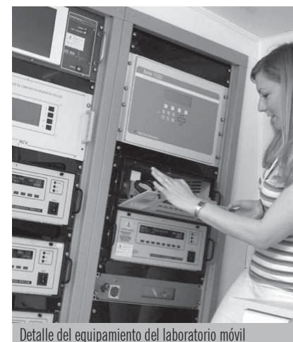
Detalle del equipamiento del laboratorio móvil