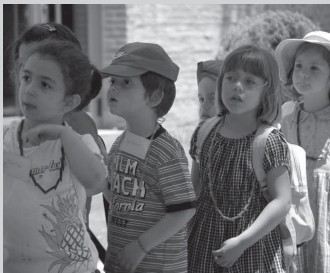
Un grupo de jóvenes alumnos en la Escuela de Verano del Campus de Toledo

La iniciativa constituye una apuesta del Equipo de Gobierno desarrollada por la Fundación General y la Gerencia, con la colaboración de las escuelas de Magisterio y de Enfermería de la Universidad de Castilla-La Mancha, que aportan becarios para la materialización del proyecto.