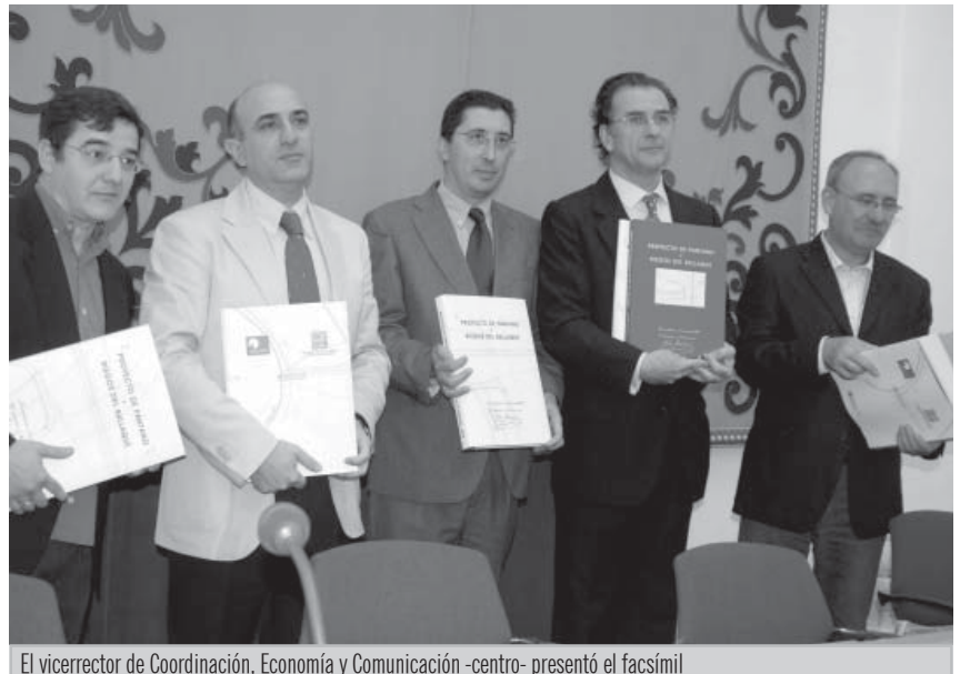
El vicerrector de Coordinación, Economía y Comunicación -centro- presentó el facsímil