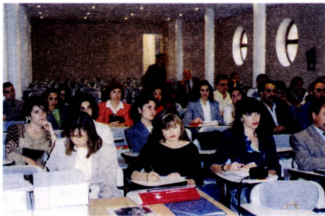
Algunos alumnos siguiendo una de las clases

El director general de Producción Agraria hizo alusión a los distintos productos que se cultivan en estas tierras (vid, cereales, champiñón, ajos, berenjenas, pimientos...), destacó