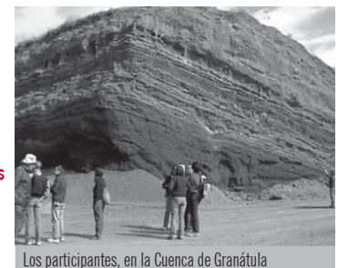
Los participantes, en la Cuenca de Granátula

Ciudad Real acogerá un encuentro mundial sobre riesgos volcánicos