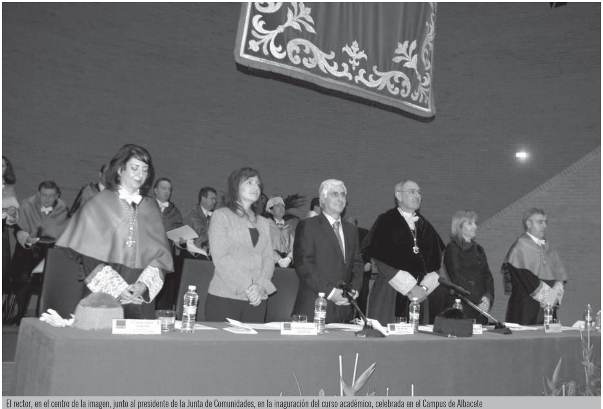
El rector, en el centro de la imagen, junto al presidente de la Junta de Comunidades, en la inauguración del curso académico, celebrada en el Campus de Albacete

La ceremonia de inauguración del año académico se celebró en el Campus de Albacete