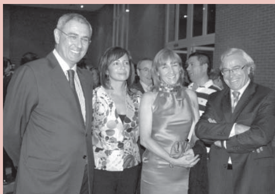
El rector, la alcaldesa de Albacete, la consejera de Educación y el presidente del Consejo