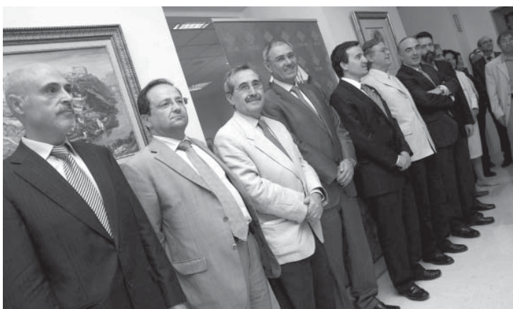
En la imagen, parte de los representantes de OCU, en el encuentro celebrado en el Rectorado de la UCLM

El 97% de las universidades españolas utilizan productos de OCU