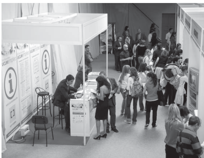
La tercera edición de UCLMempleo se celebró en el Campus de Toledo

La feria se celebrará en Cuenca el próximo mes de octubre