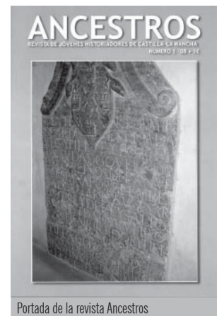
Portada de la revista Ancestros

Los responsables del curso justifican su celebración aludiendo a la obligación intrínseca a la Universidad de formar personas capacitadas para investigar.