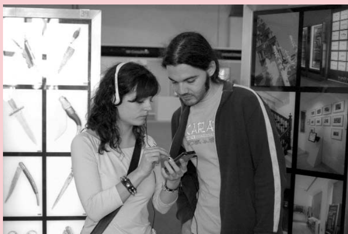
Dos personas prueban el dispositivo diseñado por los investigadores de la Universidad de Castilla-La Mancha

Para mejorar la aplicación existente, el grupo LoUISE ha realizado más de 200 encuestas siguiendo la norma ISO 9241. Los encuestados, de forma mayoritaria, han mostrado su agrado tras interactuar con el sistema.