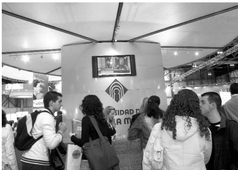
En la imagen, el stand de la UCLM en AULA, rodeado de alumnos

Por su parte, la escuela de Enfermería y Fisioterapia de Toledo acogió la cuarta edición del Curso de orientación laboral para alumnos de Enfermería y Fisioterapia, promovido por la Oficina de Búsqueda de Empleo y Motivación Empresarial (OBEM).