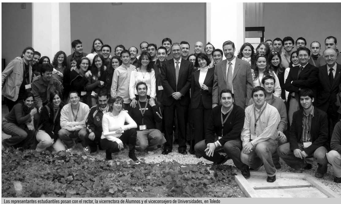
Los representantes estudiantiles posan con el rector, la vicerrectora de Alumnos y el viceconsejero de Universidades, en Toledo