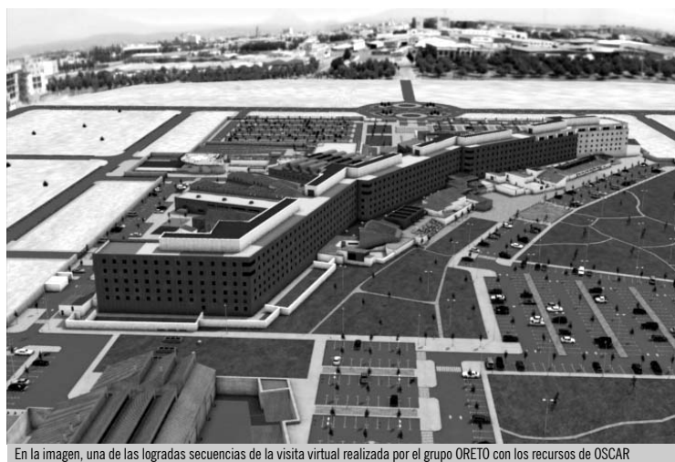
En la imagen, una de las logradas secuencias de la visita virtual realizada por el grupo ORETO con los recursos de OSCAR

El proyecto OSCAR, desarrollado por el Servicio de Supercomputación, aprovecha la capacidad de cálculo de 150 PC inactivos durante la madrugada para procesar trabajos como la visita virtual al Hospital General de Ciudad Real