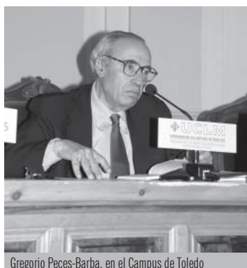
Gregorio Peces-Barba, en el Campus de Toledo

el ciudadrealeño Manuel Marín, participó en el ciclo con una conferencia sobre la influencia de la Unión Europea en el Derecho Constitucional español. Entre otras cuestiones, defendió la creación de una Europa fuerte para combatir la crisis económica e implementar políticas comunes en materia de relaciones exteriores y defensa.