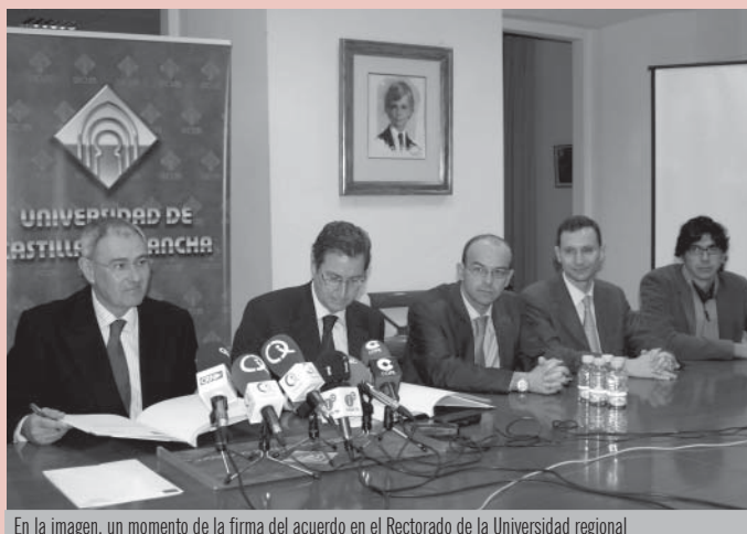
En la imagen, un momento de la firma del acuerdo en el Rectorado de la Universidad regional