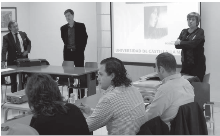
La vicerrectora de Estudiantes -a la derecha de la imagen- se reunió con los profesores en Ciudad Real y Albacete

En una iniciativa del Vicerrectorado de Estudiantes