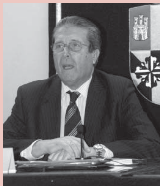
Mayor Zaragoza, en el Campus de Cuenca

Federico Mayor Zaragoza, ex director general de la UNESCO, reclamó en el Campus de Cuenca la relevancia de los Derechos Humanos especialmente en una sociedad como la actual, en la que se están acentuando las diferencias personales en función de factores culturales, religiosos o económicos. El actual presidente de la Fundación para una Cultura de Paz realizó estas manifestaciones durante su intervención en la Semana de los Derechos Humanos que ha celebrado la Escuela Universitaria de Trabajo Social con un congreso.