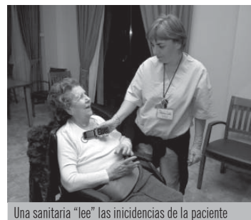
Una sanitaria "lee" las incidencias de la paciente

El grupo MAMl tiene su sede en la Escuela Superior de Informática de Ciudad Real