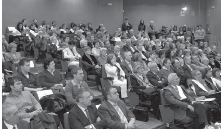
Imagen del acto celebrado en Albacete, en el que se congregó un numeroso grupo de personas

Distintos actos para reconocer el trabajo docente