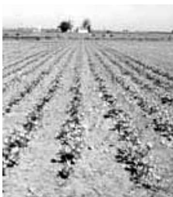
Parcela sembrada de azafrán

En concreto, a la primera reunión científica asistieron científicos del Centro de Investigación Agraria de Albadalejito, en Cuenca, donde se ubicará el banco; la Universidad Politécnica de Valencia, el Instituto Politécnico Nacional de Toulouse,