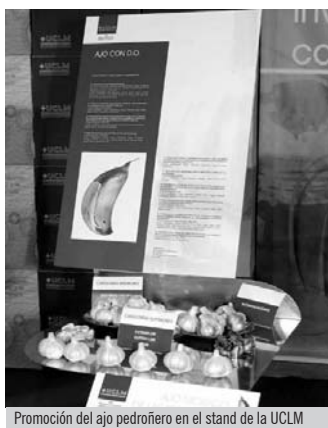
Promoción del ajo pedroñero en el stand de la UCLM

Quiles puso de manifiesto que la investigación aplicada es uno de los