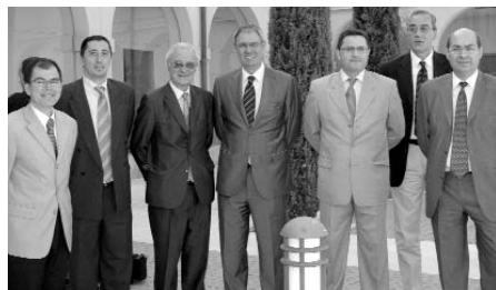
El rector, junto al director y participantes del curso sobre RSC

El curso analizó el efecto de la actividad del hombre sobre la atmósfera. Inaugurado por el rector de la UCLM, los objetivos de la convocatoria eran debatir los principales aspectos de la contaminación atmosférica, tanto la producida por contaminantes químicos la acústica y radiológica. Asimismo, en su desarrollo se revisaron los problemas de contaminación de la baja atmósfera (Troposfera y Estratosfera), sobre todo la contaminación de origen industrial y la producida por las tecnologías para la reducción de emisiones.