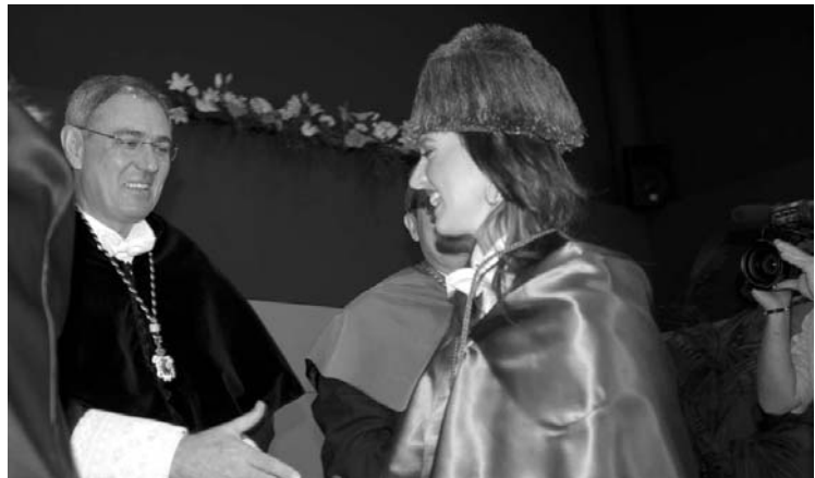
El rector saluda a una de las nuevas doctoras de la institución regional