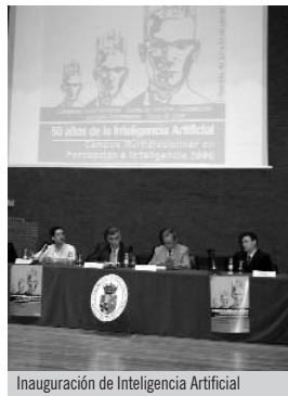
Inauguración de Inteligencia Artificial