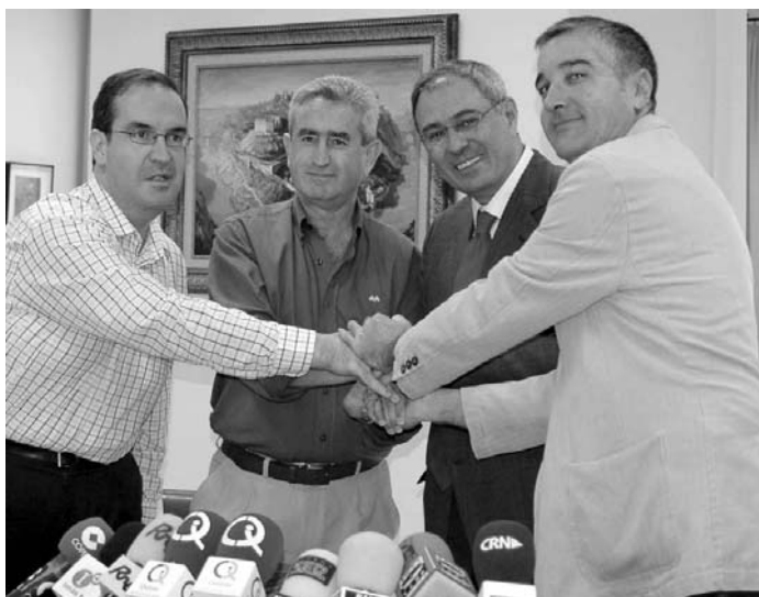
El rector y los representantes sindicales estrechan sus manos de forma simbólica