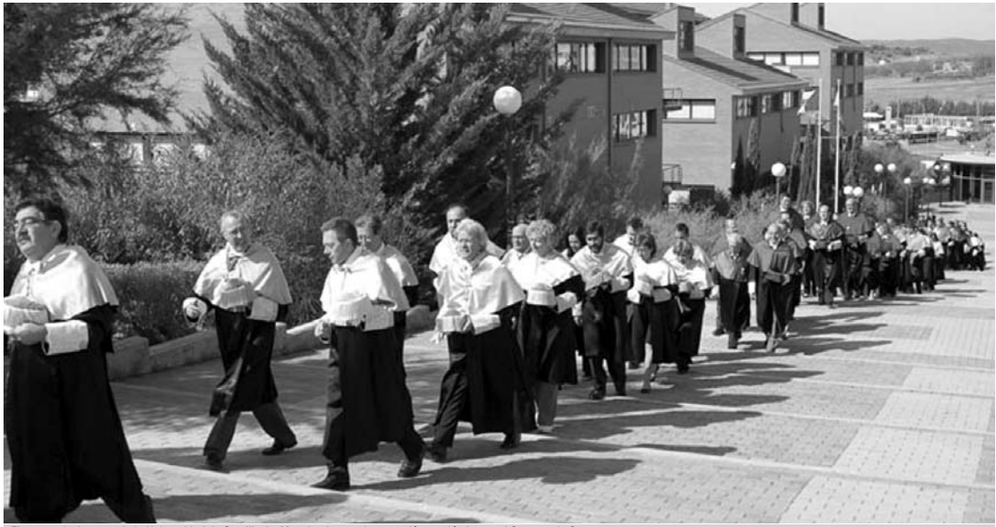
El cuerpo de doctores de la Universidad de Castilla-La Mancha durante la procesión académica en el Campus de Cuenca