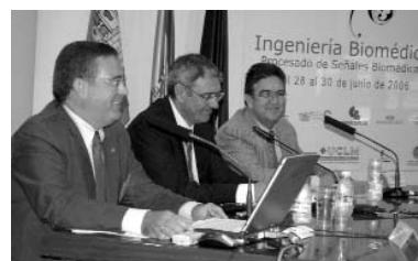
El rector de la UCLM clausuró el curso de señales biomédicas