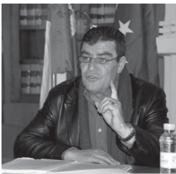
El juez de Menores de Granada Emilio Calatayud

El juez indicó que tanto los padres como la escuela y la justicia tienen “complejo de joven democracia” en relación con el ejercicio de la autoridad. “Los padres tenemos la obligación de devolver el prestigio a los maestros”, señaló. Asimismo, afirmó que cuando un padre o un alumno intimidan o agreden a un profesor están cometiendo un atentado, tal y como establece el Código Penal.