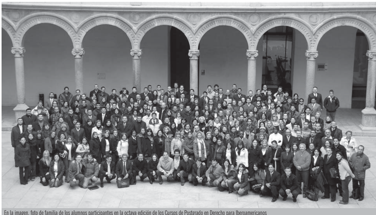
En la imagen, foto de familia de los alumnos participantes en la octava edición de los Cursos de Postgrado en Derecho para Iberoamericanos