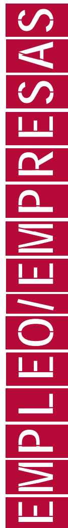
aula permanente de empleo - calendario de cursos

Días antes de la celebración de cada curso, los alumnos admitidos serán emplazados para la formalización de la matrícula en el CIPE, a un precio de doce euros cada uno de los talleres.