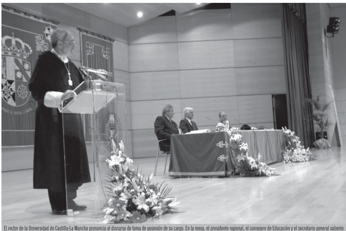
El rector de la Universidad de Castilla-La Mancha pronuncia el discurso de toma de posesión de su cargo. En la mesa, el presidente regional, el consejero de Educación y el secretario general saliente