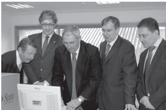
El rector, el vicerrector del Campus y el director de la Escuela de Informática, junto a los representantes de Sun

La cooperación entre la UCLM y Sun Microsystems se remonta a 2004, fecha en la que se suscribió un convenio de colaboración a través del cual la Universidad castellano-manchega entró a formar parte de la Red Universitaria de Socios Tecnológicos de Sun, formada en la actualidad por un total de 19 universidades de España y Portugal. Ello ha permitido la colaboración mutua en diversos ámbitos, pudiendo los alumnos de la UCLM acceder al software de Sun y los profesores a material docente y formación.