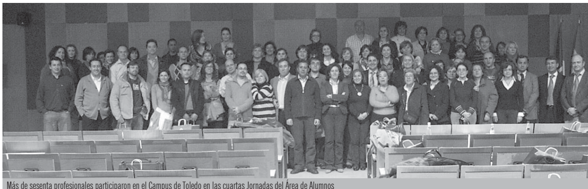
Más de sesenta profesionales participaron en el Campus de Toledo en las cuartas Jornadas del Área de Alumnos