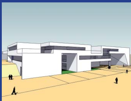
Recreación de la fachada de la Facultad de Farmacia