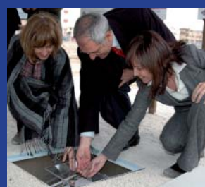
El rector -centro-, la consejera de Educación y la alcaldesa de Albacete introducen la urna en la primera piedra de la Facultad de Farmacia