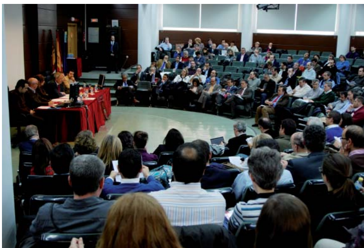
El Claustro de la UCLM se reunió en el edificio de Servicios Generales, en Ciudad Real