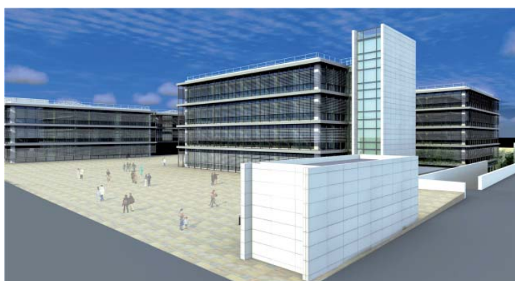
Arriba, las autoridades ponen la primera piedra de Medicina, que se recrea virtualmente abajo