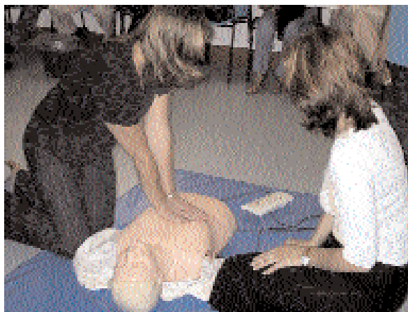
Imagen de una práctica de reanimación cardio-pulmonar

Respecto a la segunda actividad de formación, la de seguridad en trabajos de oficina, ha incluido un repaso de los riesgos generales de la actividad, incluidas las caídas de altura y al mismo nivel, escaleras fijas y manuales, golpes, caídas de objetos, cortes y sobreesfuerzos, uso seguro de equipos de trabajo y medidas preventivas. Además, se incidió en los trabajos con pantallas de visualización de datos en todos sus aspectos normativos de seguridad y ergonómicos, carga física y manipulación de cargas, las condiciones y requisitos ligados al lugar de trabajo, etc. ○