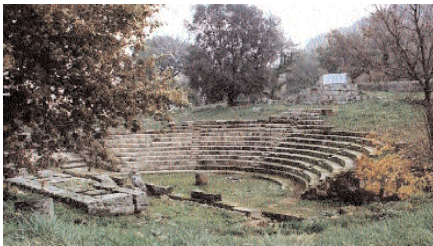
En la imagen, el teatro de Tusculum, uno de los importantes elementos del yacimiento

En la presentación de las becas, que financia Caja Castilla-La Mancha, el vicerrector de Cooperación Cultural, Miguel Cortés Arrese, subrayó que ésta constituye “una excelente oportunidad” para los jóvenes castellano-manchegos interesados en la arqueología, que pueden trabajar con los mayores expertos en la materia y en uno de los yacimientos más importantes de Europa. El yacimiento, con una extensión aproximada de 10 hectáreas, se halla en terrenos propiedad de la XI Comunità Montana del Lazio. Tusculum presenta los restos de una antigua