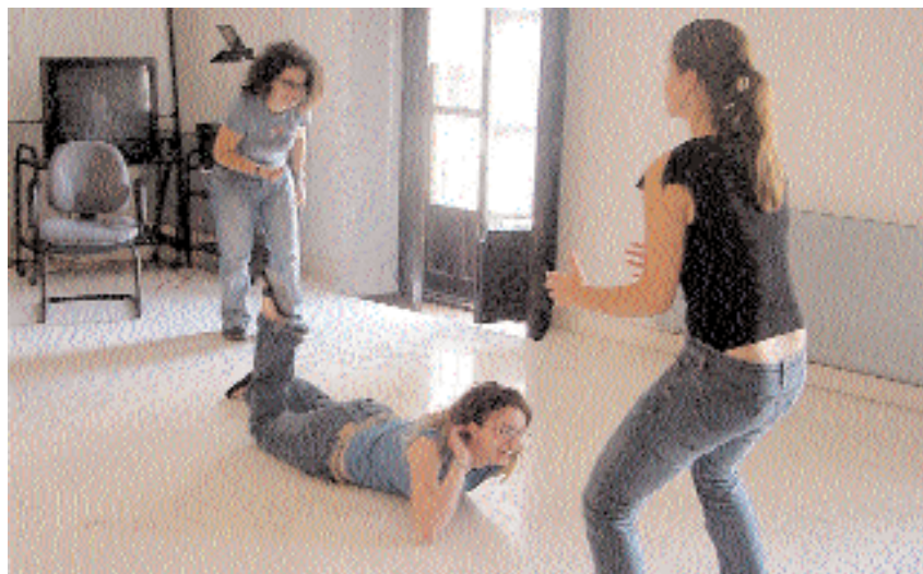
Tres alumnas del curso preparan la obra de teatro que representaron el 20 de junio