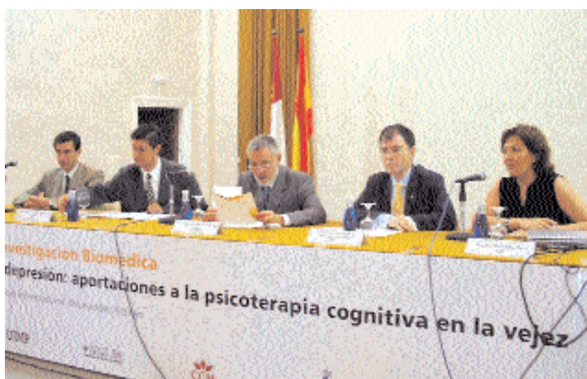
En la imagen, un momento de la inauguración de la escuela de verano en Cuenca

En esta ocasión la II Escuela de Verano sobre Investigación Biomédica se ha centrado sobre uno de los problemas de salud que más afecta a los mayores como es la depresión y las intervenciones que se pueden realizar para mejorar su sintomatología y retrasar el declive cognitivo que se supone afecta principalmente en estas edades. Revisar conocimientos y actualizar formas de intervención que contribuyan a mejorar la calidad de vida de las personas que padecen este tipo de patologías, que se estima afectan a más del 30 por ciento de los mayores de 65 años, han sido algunos de los objetivos de esta II Escuela de Verano, en la que participaron ponentes de reconocido prestigio en el campo de la salud mental. ○