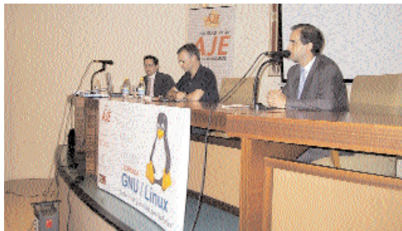
La jornada se celebró en la Escuela Superior de Informática de Ciudad Real