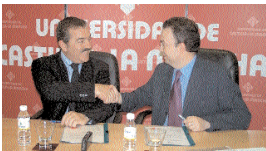
El vicerrector de Investigación y el director de FEDETICAM, tras firmar el acuerdo

La Federación de Empresas de Tecnologías de la Información suscribe un acuerdo con la Universidad para impulsar el contacto entre ambos sectores en Castilla-La Mancha