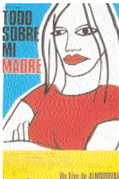
El cartel de Todo sobre mi madre

de estilos tan dispares como la música culta o la celta, el ballet clásico, o los cuentacuentos.