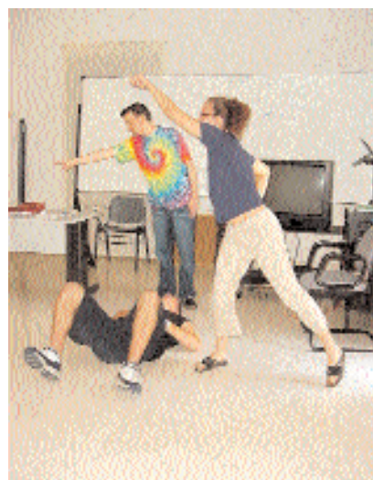
Tres de los alumnos en clase de teatro