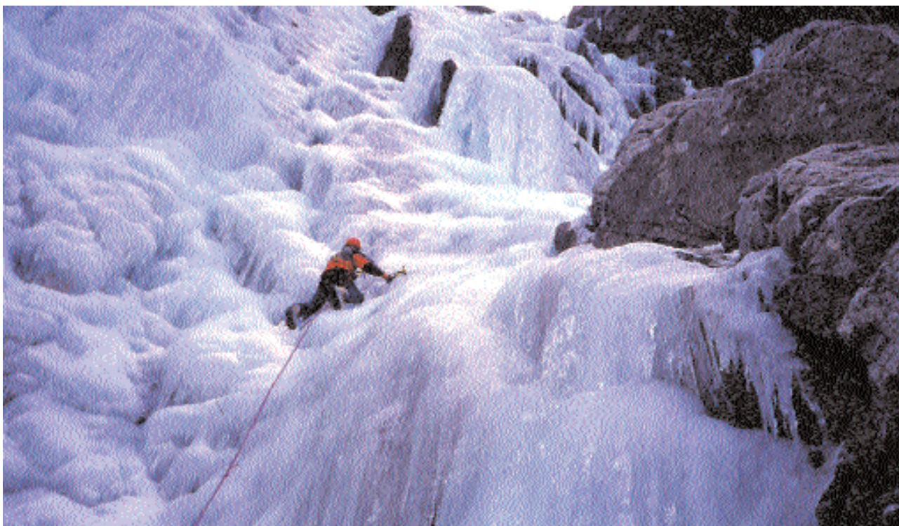
En la imagen de archivo, el alumno Óscar Cardo Briones escala una cordillera helada