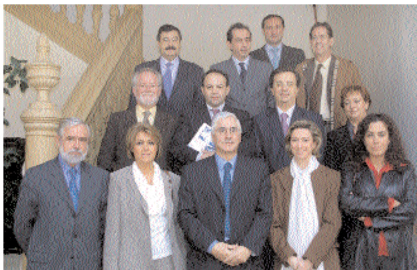
En la foto, el consejo de administración de la empresa pública Don Quijote 2005

Aunque la cooperación entre la Universidad y la empresa pública Don Quijote de La Mancha 2005 se plas-