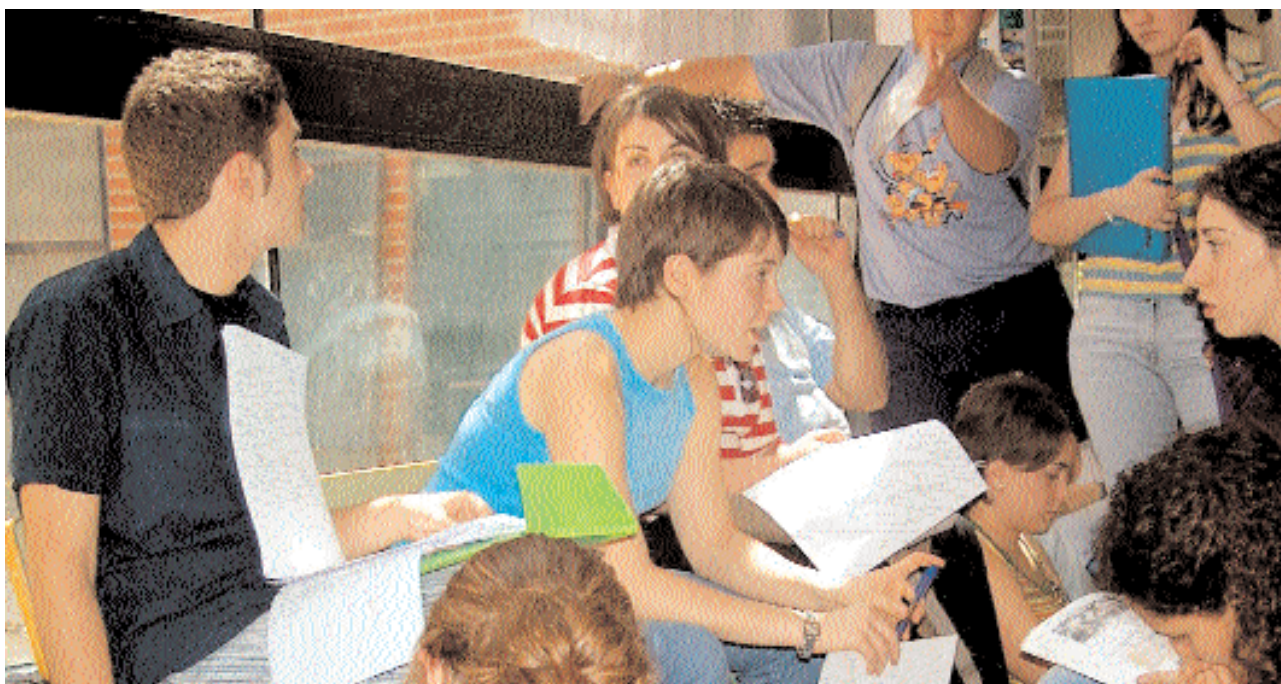
Un grupo de alumnos espera en Albacete el llamamiento para las pruebas de selectividad