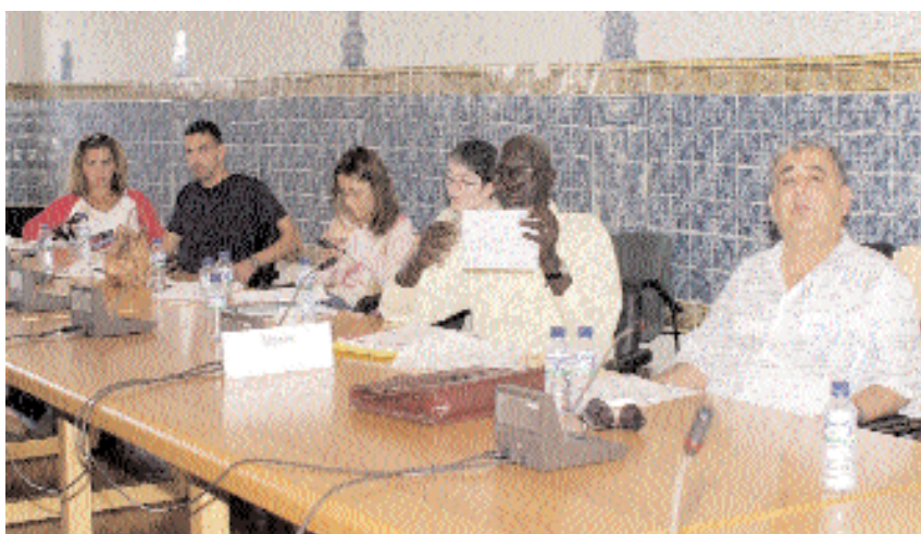
En la imagen, un momento del Instituto sobre Gobernabilidad celebrado en 2002

Esta iniciativa, que promueve la paz a través del debate y la formación desarrolla dos cursos en la UCLM sobre gobernabilidad y desarrollo sostenible