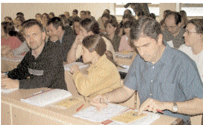
Un grupo de alumnos, en el curso sobre experimentación animal

El comité creado a tal efecto imparte un curso a investigadores con el objetivo de evitar el sufrimiento a los animales que se emplean en los laboratorios