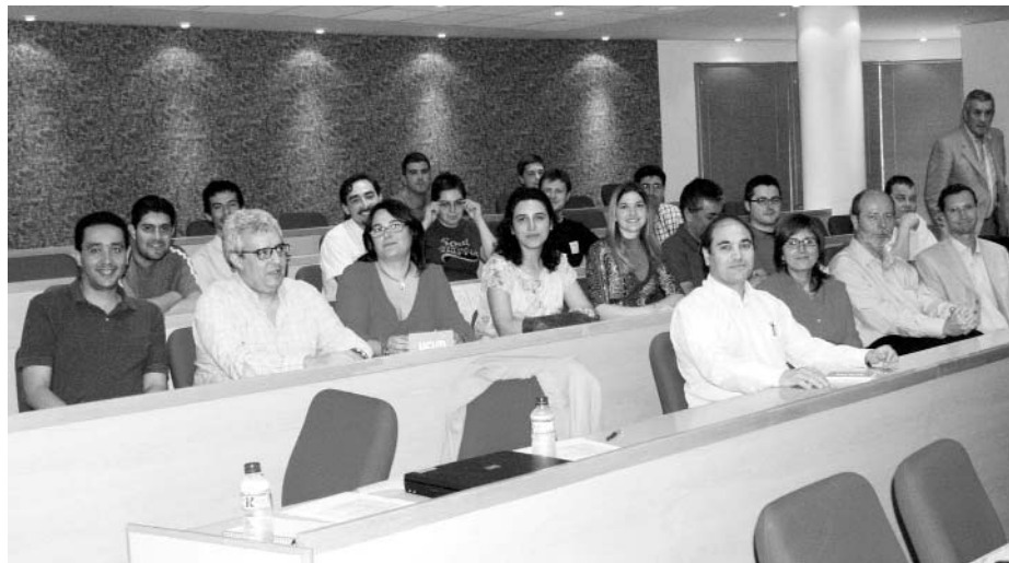
Algunos de los participantes en la reunión de investigadores del Calipso