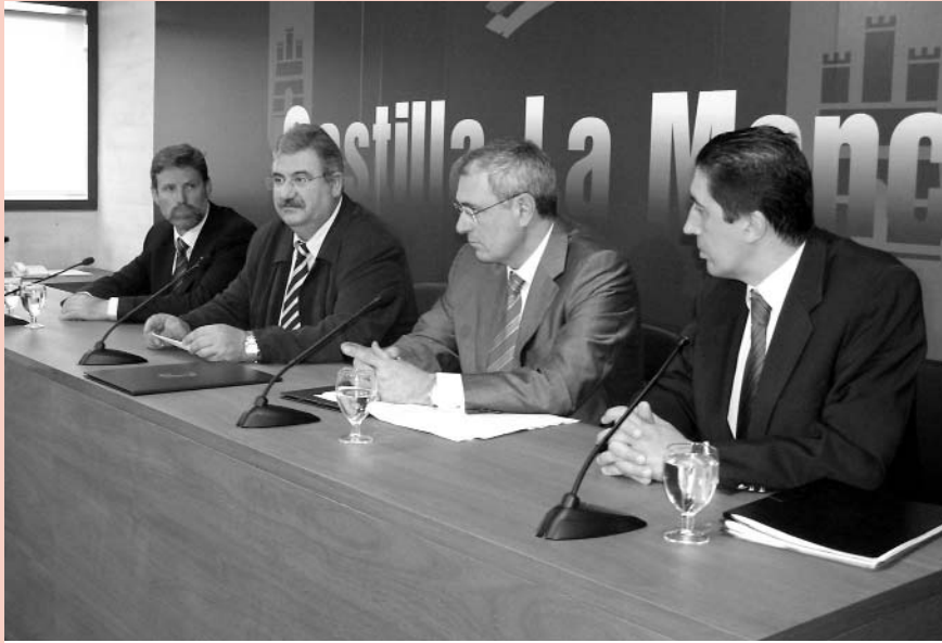
Foto de familia de los patronos del IREC en su última reunión