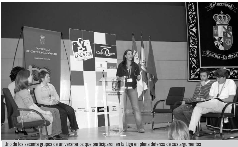
Uno de los sesenta grupos de universitarios que participaron en la Liga en plena defensa de sus argumentos