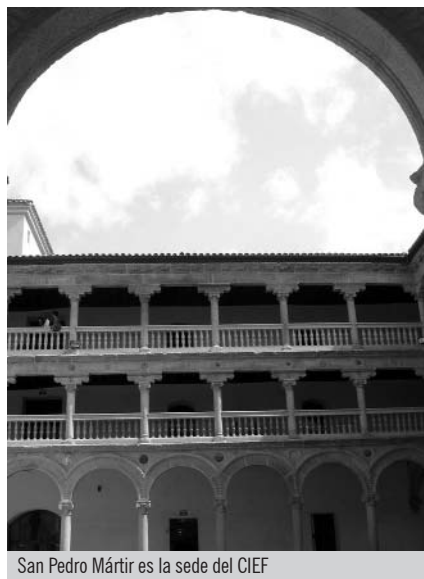
San Pedro Mártir es la sede del CIEF

Esta iniciativa se enmarca dentro de las actividades desarrolladas por el CIEF en América Latina, como la que se lleva a cabo en la Universidad Autónoma de Baja California (México) o en el Instituto de Finanzas Públicas de la Universidad de la República (Uruguay), así como con otras institu-