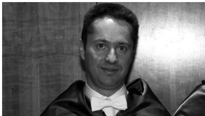
Juan Ignacio Cirac el día de su nombramiento como doctor honoris causa

La Universidad de Castilla-La Mancha facilitó que el científico pudiera completar su carrera investigadora siendo PDI en la misma, dado que ésta financió su estancia en otros centros de investigación mediante el programa propio de ayudas que a tal efecto tiene para complementar la formación de los profesores de la UCLM. Asimismo, esta universidad quiso ensalzar la acreditada trayectoria profesional y la relevancia internacional de Cirac con el nombramiento de doctor honoris causa que le otorgó el pasado 4 de noviembre, a propuesta del Departamento de Física Aplicada de la Facultad de Ciencias