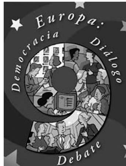
Cartel conmemorativo del 9 de mayo