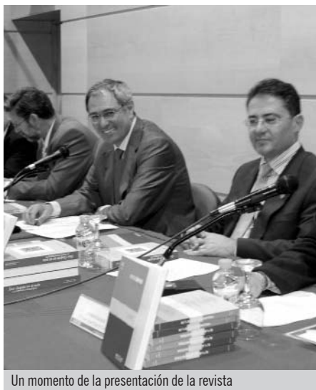
Un momento de la presentación de la revista