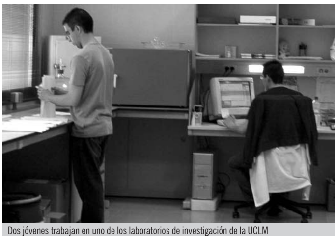
Dos jóvenes trabajan en uno de los laboratorios de investigación de la UCLM

Igualmente, según Martínez, es excelente la evolución del presupuesto que la propia UCLM