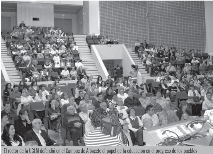
El rector de la UCLM defendió en el Campus de Albacete el papel de la educación en el progreso de los pueblos