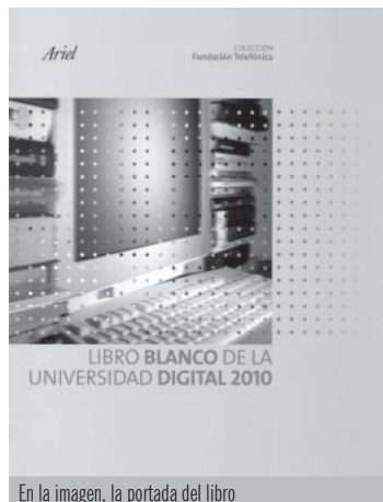
En la imagen, la portada del libro

Más de 30 personas participaron en la redacción de la obra