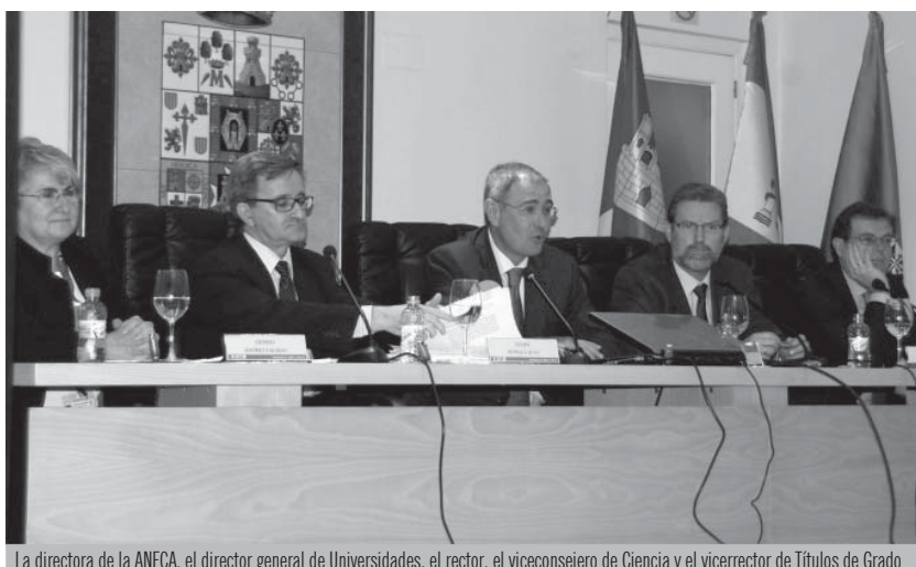
La directora de la ANECA, el director general de Universidades, el rector, el consejero de Ciencia y el vicerrector de Títulos de Grado

Los sistemas de información constituyen un elemento determinante para garantizar la calidad de la enseñanza universitaria. Así lo señalaron los expertos en calidad de 60 universidades y diez agencias autonómicas, representantes de la Agencia Nacional de Evaluación de la Calidad y Acreditación (ANECA) y de los ministerios de Ciencia e Innovación y Defensa que participaron en la décima edición del Foro de Almagro, la iniciativa que celebran la Universidad de Castilla-La Mancha (UCLM) y la ANECA en la localidad ciudadrealeña con el objetivo de promover de cultura de la calidad en las universidades.