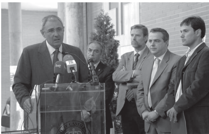
El rector se dirige a los presentes en la inauguración de la ampliación del CEU de Talavera de la Reina

Con la intervención realizada, el CEU cuenta con una superficie total de 7.782 metros cuadrados, a los que se añadirán en los próximos años los 2.136 metros de un nuevo módulo. Según explicó el rector, esta nueva ampliación resolverá los requerimientos de espacio para investigación y docencia derivados de la adaptación de las titulaciones al EEES, así como para la implantación de los nuevos títulos de grado.