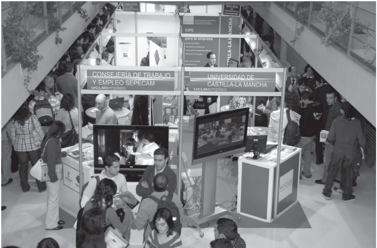
En la imagen, una panorámica de la cuarta edición de UCLMempleo, la feria celebrada en Albacete por el Vicerrectorado de Estudiantes -a través del CIPE- y la Fundación General de la UCLM