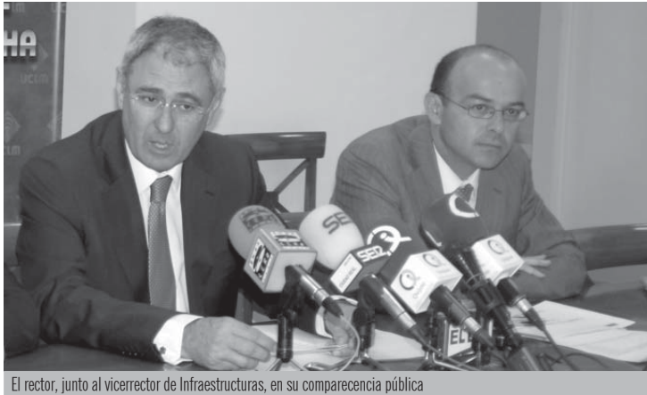
El rector, junto al vicerrector de Infraestructuras, en su comparecencia pública