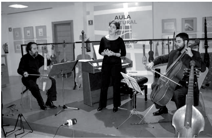
El grupo Neocantes fue uno de los "platos fuertes" de la Semana Cervantina, celebrada en el Campus de Ciudad Real

El Aula Cultural de Ciudad Real acoge la IV Semana Cervantina