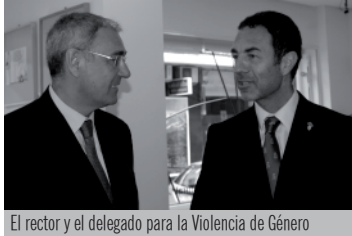
El rector y el delegado para la Violencia de Género

El rector y el delegado del Gobierno para la Violencia de Género inauguran en Ciudad Real una muestra de humor gráfico sobre el maltrato