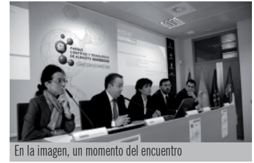
En la imagen, un momento del encuentro

Concebidas como una actividad de carácter científico y técnico, las jornadas materializan el interés del Hospital de Parapléjicos y del IDINE en colaborar en el desarrollo de las neurociencias en Castilla-La Mancha, un ámbito en el que ambos centros son referentes en el panorama internacional.