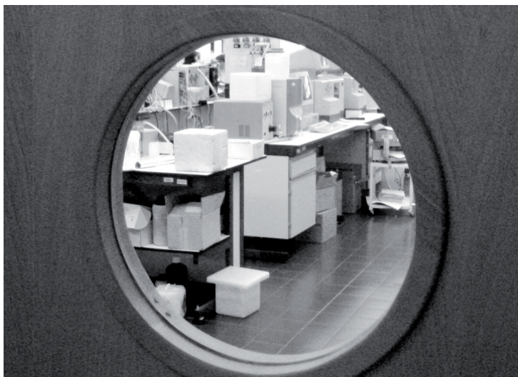
En la imagen, un laboratorio de la UCLM a través de una ventana ojo de buey

La tabla anexa incluye la relación y el presupuesto consignado para el ejercicio 2009 de los proyectos europeos, nacionales y regionales, así como los contratos y las ayudas a la investigación por centros y campus de la Universidad de Castilla-La Mancha.