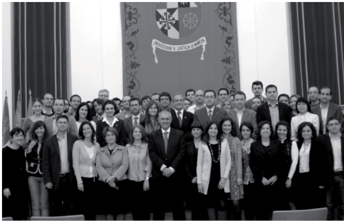
En el Campus de Ciudad Real tomaron posesión de sus plazas un total de 58 profesores