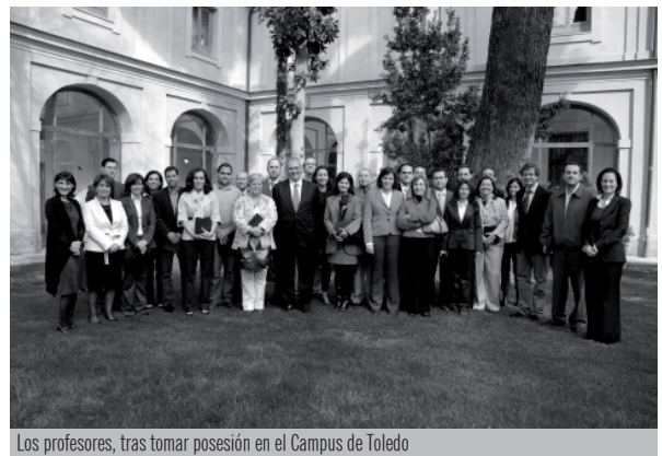
Los profesores, tras tomar posesión en el Campus de Toledo