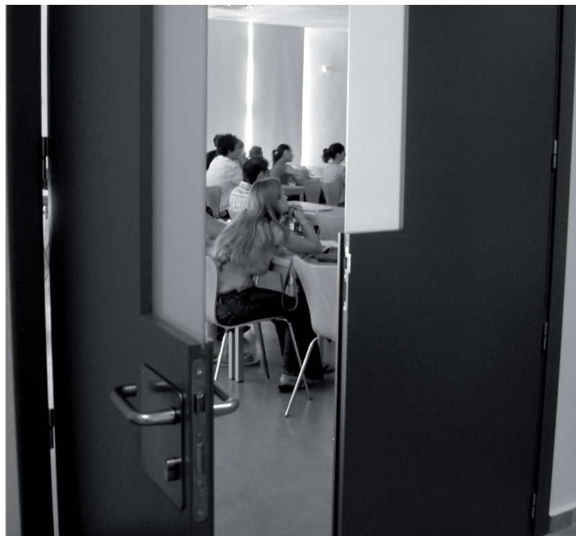
La formación constituye uno de los ejes estratégicos de la Relación de Puestos de Trabajo del PAS de la Universidad regional