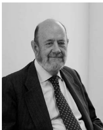
José María Gil-Robles

El presidente del Movimiento Europeo Internacional y ex presidente del Parlamento Europeo, José María Gil Robles habló sobre los retos de España en el marco europeo coincidiendo con el vigésimo aniversario de la entrada de España en el Mercado Común. Gil Robles desgarnó los desafíos que nuestro país debe afrontar en los próximos veinte años.