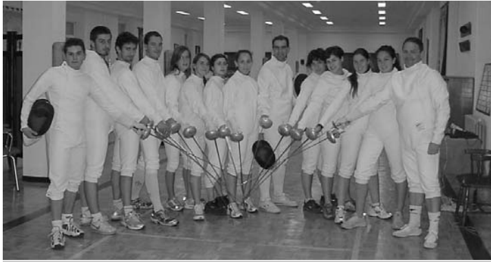
Los alumnos ataviados con los atributos de la esgrima, un deporte de origen medieval