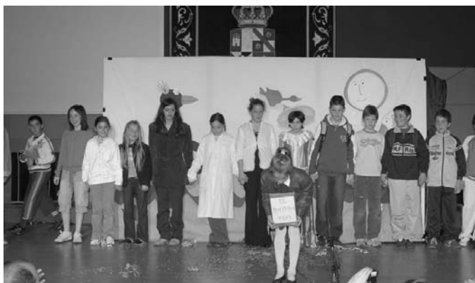
Los niños de la biblioteca de Villar de Olalla participaron en los actos de la efemérides sobre el libro infantil