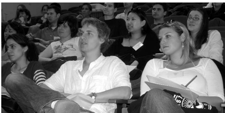
Becarios Fulbright en su reunión anual celebrada en el campus de Toledo