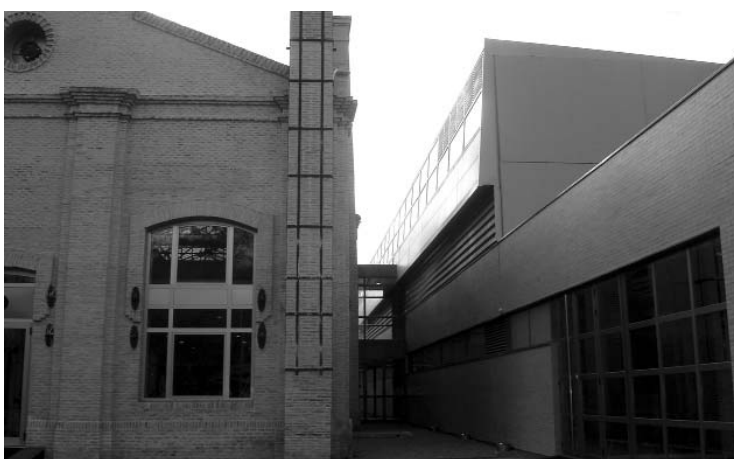
Panorámica exterior de las nuevas instalaciones deportivas que incluyen un laboratorio de investigación

Con cuarenta profesores, de los que 23 son doctores, y quince becarios de investigación, la Facultad ofrece dos cursos de doctorado interuniversitario y un