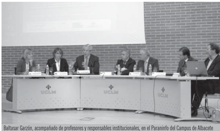
Baltasar Garzón, acompañado de profesores y responsables institucionales, en el Paraninfo del Campus de Albacete

En su intervención, señaló que la defensa de la justicia universal es una obligación de todos, “principalmente de aquellos que se están formando en esta universidad, que se caracteriza por ser pionera en ámbitos de cooperación, compromiso y de responsabilidad con los derechos humanos, por lo que es un lugar ideal para transmitir este mensaje, e incidir en la convicción y la esperanza de que merece la pena hacerlo”.