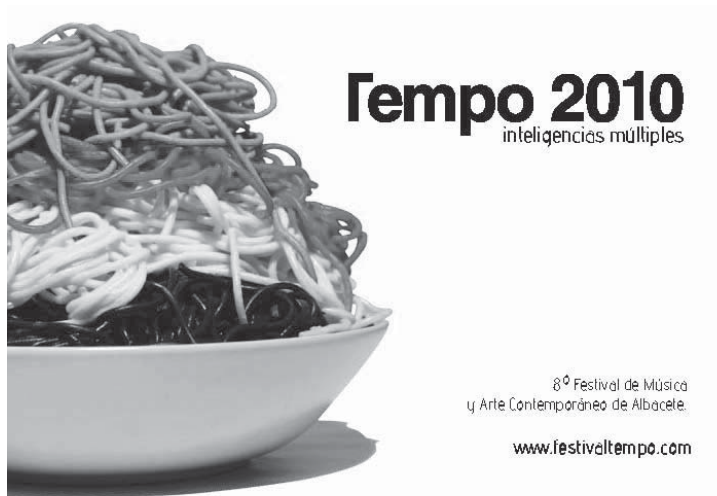
El cartel de Tempo, una sugerente presentación del Instituto Europeo di Design

Ubú Teatro llevó el festival a las calles de Albacete