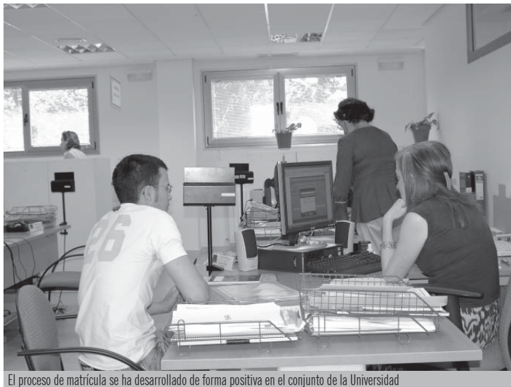
El proceso de matrícula se ha desarrollado de forma positiva en el conjunto de la Universidad

A 31 de julio, se habían matriculado un 230% más de alumnos que el curso anterior