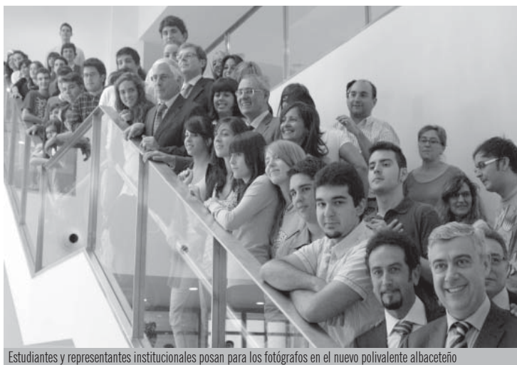
Estudiantes y representantes institucionales posan para los fotógrafos en el nuevo polivalente albaceteño