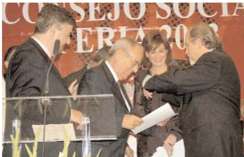
Los premiados reciben sus galardones

Los asistentes, tras finalizar el acto, tuvieron la oportunidad de visitar la exposición ubicada en el centro, “El diseño gráfico de la UCLM”, del Centro de Investigaciones de la Imagen (CIDI), con sede en el campus de Cuenca, que recopila su labor creadora en los últimos doce años.