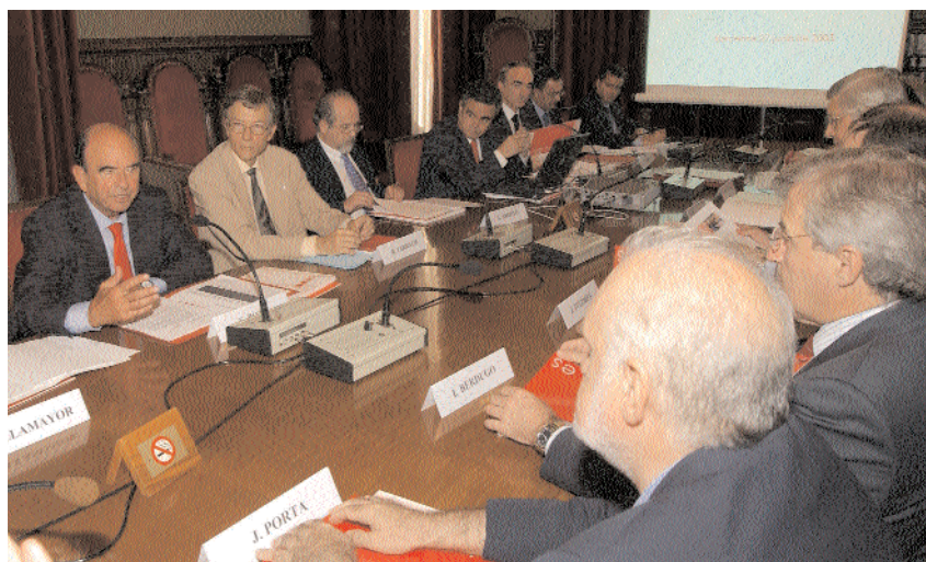
Junta general de accionistas

Según se puso de manifiesto en el encuentro, Universia ha concluido con éxito su fase de implantación en la comunidad iberoamericana. Con la