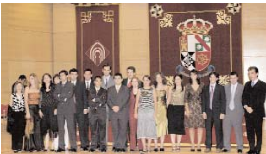
Primera Promoción de Ingenieros de Caminos