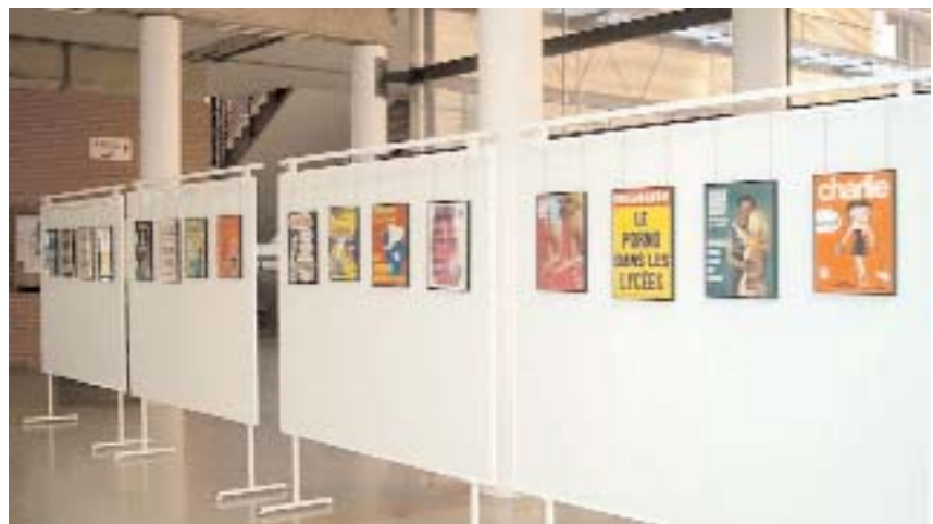
1968 fue un año esencial para la aparición de la moderna prensa crítica con el poder