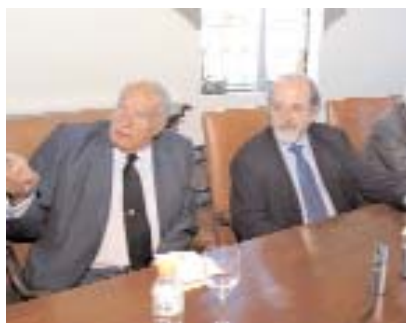
Imagen del acto en memoria de Marañón

da nombre a la Fundación, de tal manera que se pueda difundir el espíritu médico de este hombre clave en la historia de la investigación española.