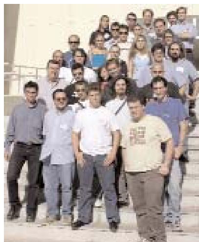
Representantes de IEEE

Barreda animó a los jóvenes a que estudiaran en la región con el ánimo de quedarse y desarrollar su actividad laboral en C-LM.