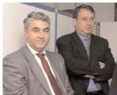
Infoglobal aporta medios y profesionales

enseñanza, se ha conseguido un sobresaliente avance en la interacción alumno-profesor, ya que la tradicional videoconferencia se convierte en una herramienta donde el tutor utiliza toda clase de recursos telemáticos, de esta manera puede manejar la pantalla del alumno desde su puesto