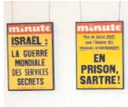
Reivindicaciones del momento

vateur", "Le Figaro Littéraire", "Paris Match", "Elle", "Hara Kiri", etc... Sus mensajes hacen sobrevivir al mayo francés como modelo y como mito.