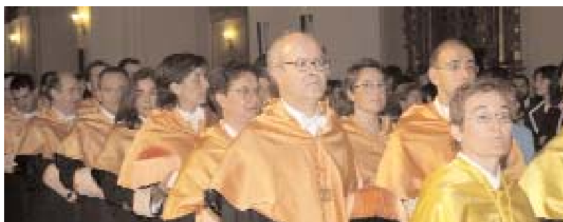
Momento de la procesión

Muchas fueron las personas que se acercaron al Paraninfo de San Pedro Mártir, en el Campus de Toledo, para asistir a la inauguración del Curso Académico.