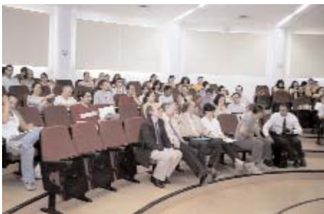
Más de 150 alumnos participaron en el curso "Escrituras y lenguas del Mediterráneo en la Antigüedad"