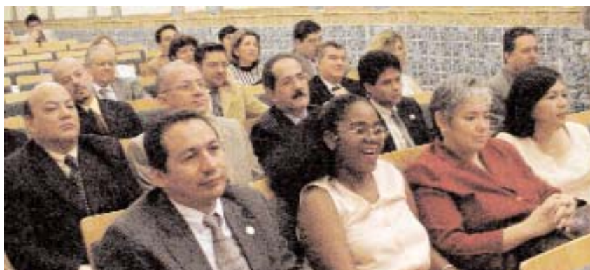
La UCLM realiza una fuerte incursión en el espacio educativo latinoamericano