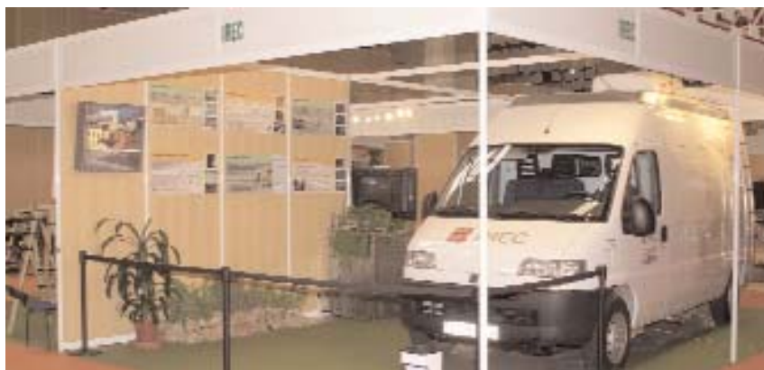
El IREC presentó su laboratorio móvil para seguimientos y toma de muestras