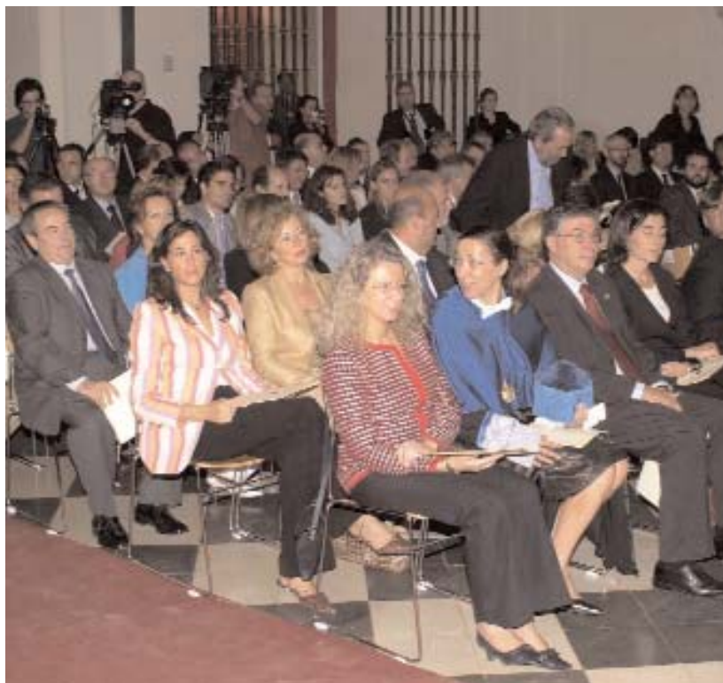
Autoridades políticas regionales