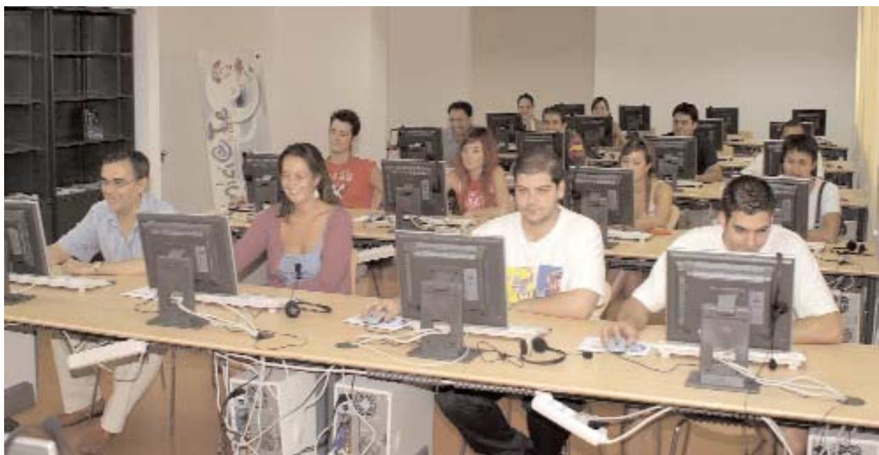
Sala de ordenadores con red de alta capacidad para conexión con Internet