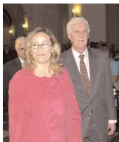
La Vicepresidenta de las Cortes de C-LM