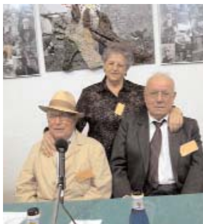
Guerrilleros en Santa Cruz de Moya