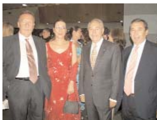
Amplia presencia de las Instituciones en la Recepción del Consejo Social