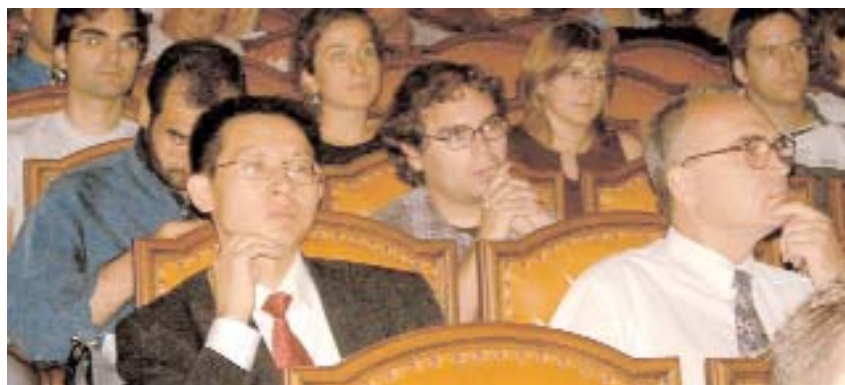
El Encuentro contó con participantes de todo el mundo

Castilla-La Mancha es una región tradicionalmente seca, por lo que cobran aún más importancia los esfuerzos destinados a aprovechar los recursos hídricos