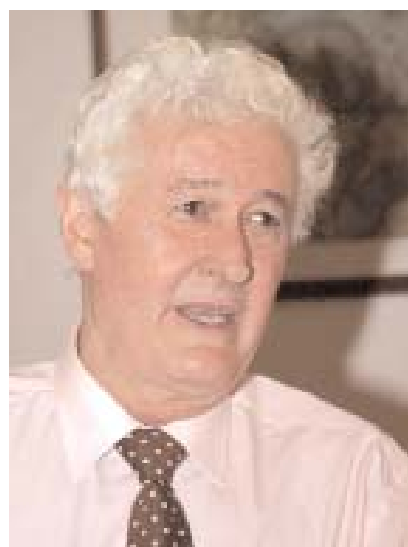
El poeta Félix Grande al que aludió el rector en su discurso