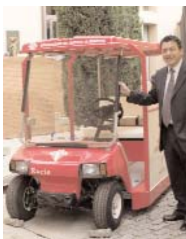
Tecnove presentó su vehículo eléctrico