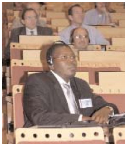
Asistentes al Encuentro Internacional

contenidos de la enseñanza. La primera se refiere a los contenidos de las materias que tradicionalmente componen la formación del ingeniero civil. La segunda tiene que ver con la creciente necesidad de incorporar una sensibilidad territorial y de interés por el medio natural en todas las materias de la ingeniería civil y la tercera es la necesidad de recuperar el énfasis en el proyecto.