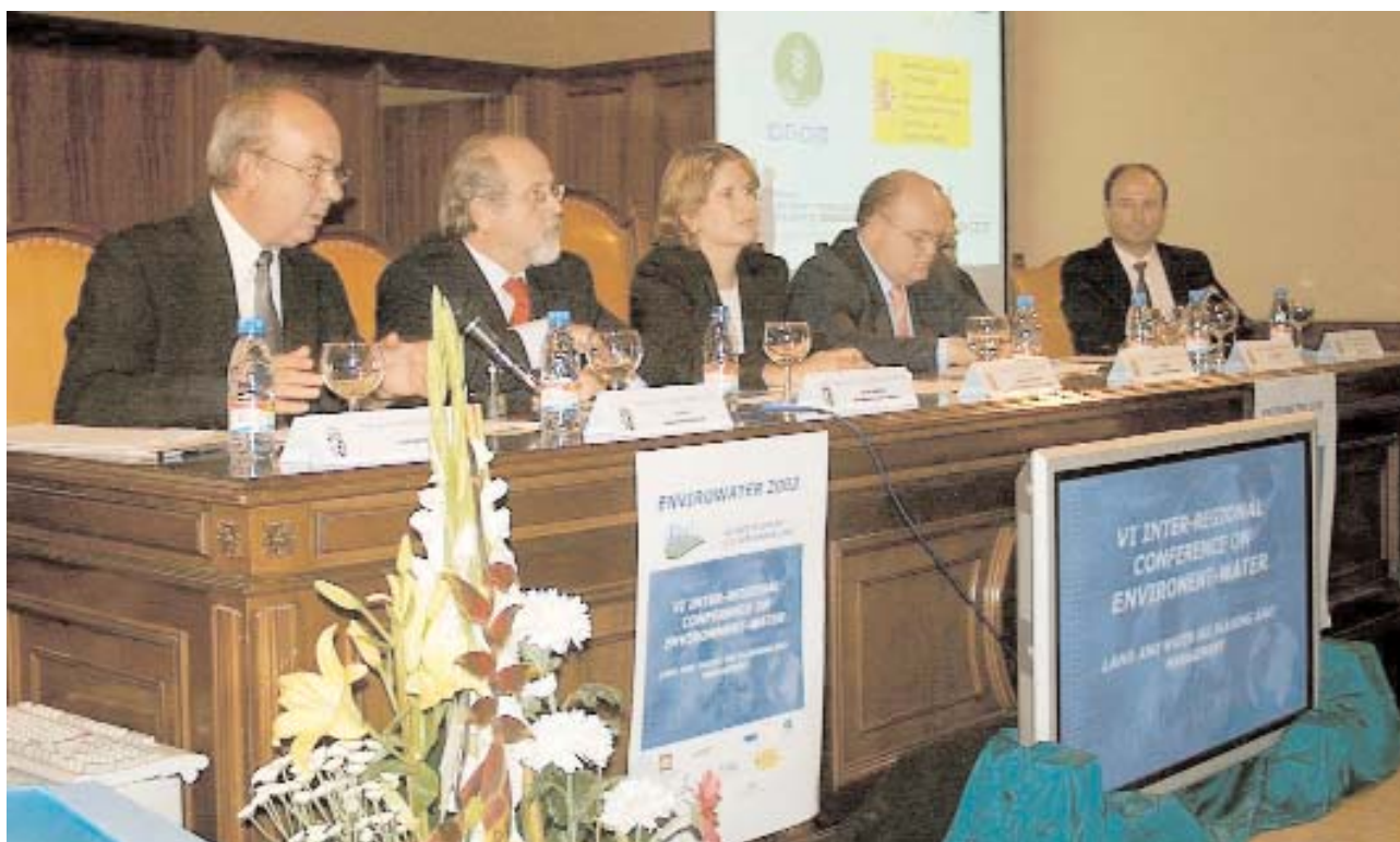
Momento de la inauguración del Foro Internacional