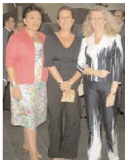
Importante presencia política en el acto

Uno de los atractivos del stand es la posibilidad que ofrece al público de conectarse a Internet y a las aplicaciones informáticas de la UCLM gracias al proyecto “Aula Magna”, en colaboración con el Portal Universia. Otro atractivo fue la realización páginas web diseñadas por los visitantes.