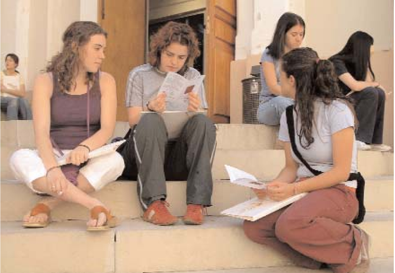
Un grupo de alumnas de Cursos de Verano repasan sus notas en la escalinata de acceso al Museo de las Ciencias