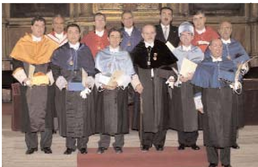
El acto reunió por última vez al equipo rectoral en traje de ceremonia

Muchas fueron las personas que se acercaron al Paraninfo de San Pedro Mártir, en el Campus de Toledo, para asistir a la inauguración del Curso Académico.