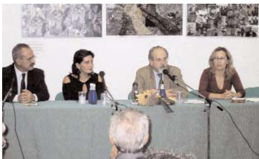
Las instituciones regionales llevan cuatro años apoyando el evento

En definitiva, se ha creado un punto de encuentro en el que cada uno ha expuesto sus investigaciones, opiniones, sus experiencias, circunstancias o