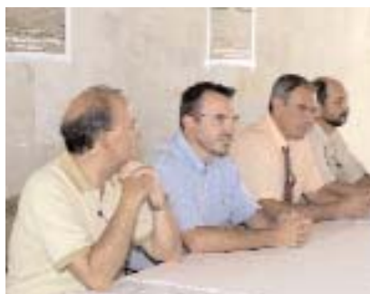
Galiana sirvió como campo de prácticas

El objetivo principal es que los participantes adquieran una base práctica para evaluar las posibilidades reales