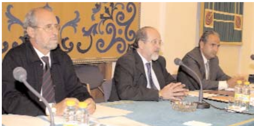
El rector informó a los asistentes sobre su decisión de no concurrir a las elecciones

En otro orden de cosas, el Consejo de Gobierno dió el visto bueno a la creación de cuatro Institutos de Investigación, en concreto el de Derecho y Justicia Penal Europea e Internacional, el Internacional de Estudios Fiscales-Sección de la Escuela de Altos Estudios Fiscales, el de Estudios y Documentación de las Brigadas Internacionales y por último el Europeo y el Instituto Latinoamericano para el