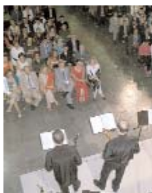
La orquesta Ibérica Dixie Jazz Band amenizó la velada