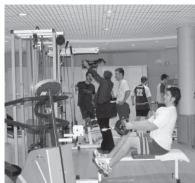
El rector conversa con el consejero de Educación y el director de la Escuela de Informática, entre otras personalidades, frente a la ampliación del centro (izquierda). En la imagen superior, el gimnasio universitario