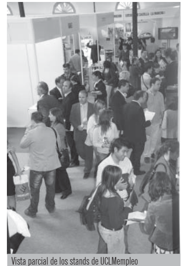
Vista parcial de los stands de UCLMempleo

Durante la celebración de UCLMempleo, los estudiantes contactaron con las empresas e instituciones participantes, pero además participaron en mesas redondas y charlas técnicas para conocer de primera mano las tendencias del mercado laboral