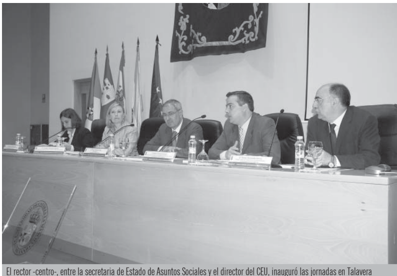
El rector -centro-, entre la secretaria de Estado de Asuntos Sociales y el director del CEU, inauguró las jornadas en Talavera

El rector presentó la Guía del Voluntariado en Talavera y Cuenca