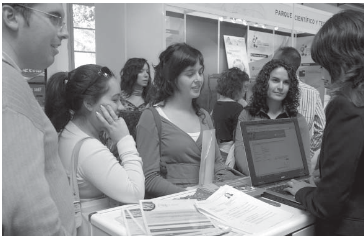
Los alumnos entregaron sus currícula en los stands de las empresas e instituciones participantes en la feria