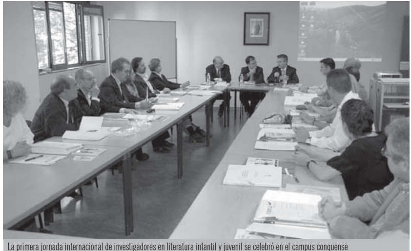
La primera jornada internacional de investigadores en literatura infantil y juvenil se celebró en el campus conquense

El foro, presentado con el título de La palabra y la memoria , se celebró