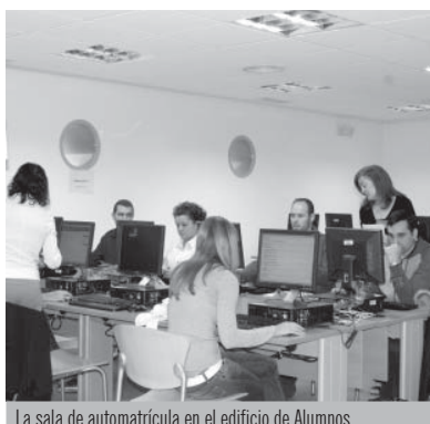
La sala de automatrícula en el edificio de Alumnos