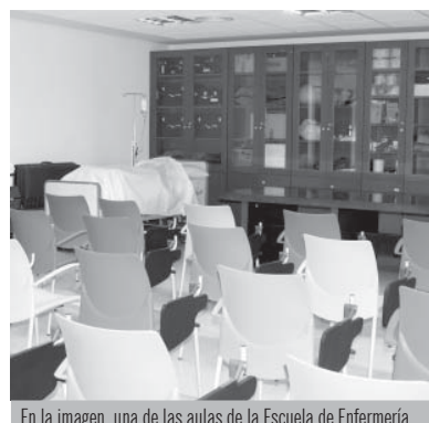
En la imagen, una de las aulas de la Escuela de Enfermería

rio está situado en el sótano del edificio Francisco Fernández Iparraguirre (antigua Escuela Técnica Superior de Ingenieros Industriales y actual sede de laboratorios de Químicas). Cuenta con 660 metros cuadrados en incluye una sala de musculación; otra, multiusos; y duchas y vestuarios, además de otros servicios complementarios.