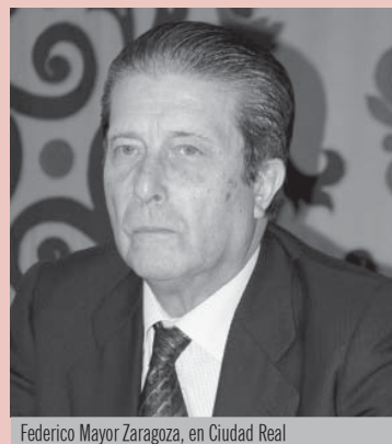
Federico Mayor Zaragoza, en Ciudad Real

El presidente de la Fundación Cultura de Paz y ex director general de la UNESCO, Federico Mayor Zaragoza, reivindicó un mayor protagonismo de la Organización de Naciones Unidas (ONU) en las crisis internacionales, que, a su juicio, responden a los intereses geoestratégicos y económicos de los estados fuertes. Mayor Zaragoza realizó estas declaraciones durante la inauguración en Ciudad Real de unas jornadas organizadas por el Instituto de Resolución de Conflictos de la Universidad de Castilla-La Mancha (UCLM) y en las que también criticó la complicidad de occidente en casos como las violaciones flagrantes de los derechos humanos que sufren los monjes budistas en Myanmar, la invasión de Irak por parte de Estados Unidos, o el boicoteo de las elecciones en Kosovo. El presidente de la Fundación Cultura de Paz considera que la mayor parte de estos conflictos podrían evitarse o, en su caso, resolverse con una ONU sólida, que recupere el papel de árbitro internacional que le corresponde desde su creación.