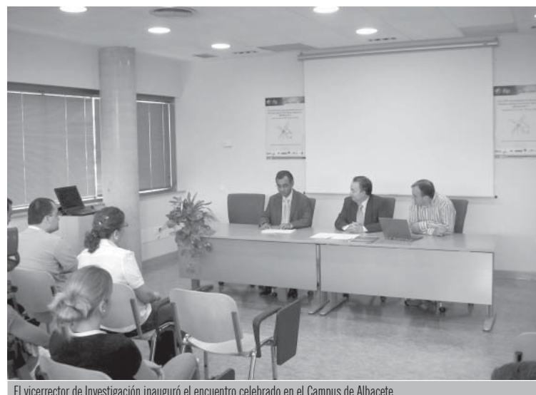
El vicerrector de Investigación inauguró el encuentro celebrado en el Campus de Albacete