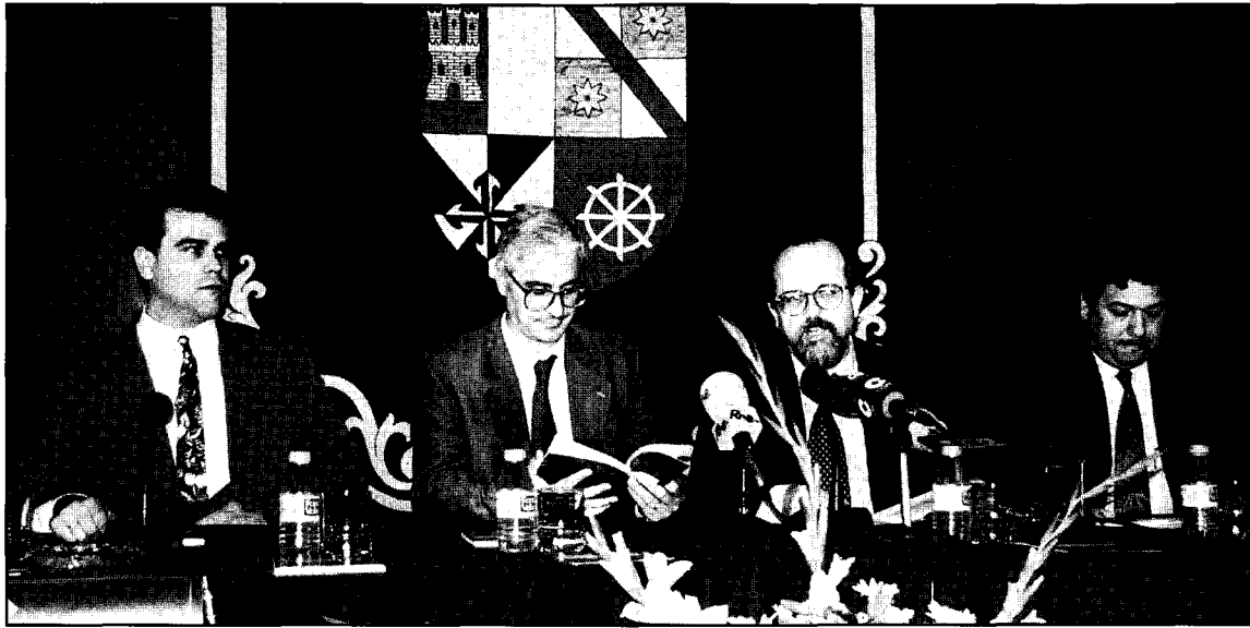
Un momento del acto de presentación del Programa de Doctorado y Máster

La Universidad de Castilla-La Mancha, en colaboración con la Universidad de la Habana, y bajo el patrocinio de las Cortes Regionales va a poner en marcha, el próximo curso académico, un Doctorado Interdisciplinar y un Máster titulado "Un Siglo de España: Centenario 1898-1998".