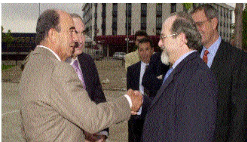
El rector y el presidente del Santander Central Hispano, en el campus Ciudad Real

Hispano vendrá a completarse con el de la entidad Caja Castilla-La Mancha, tal y como se presentará en breve.