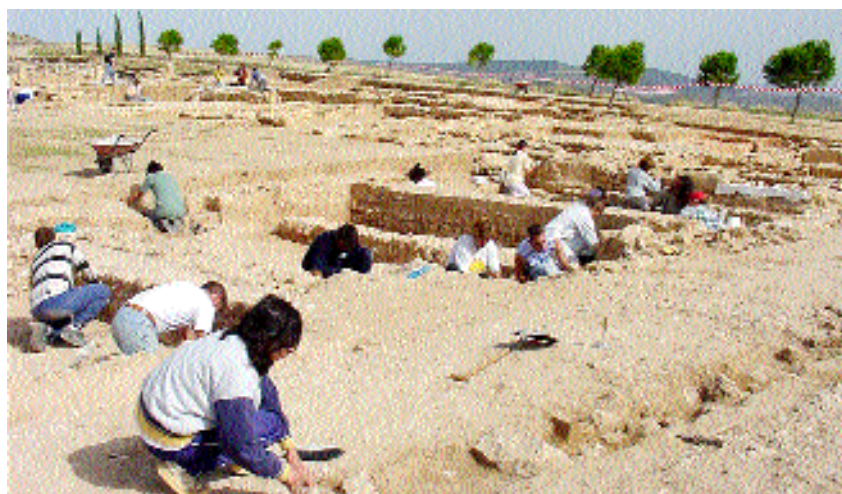
Los alumnos trabajan en el yacimiento romano, enclavado en Cañaveruelas