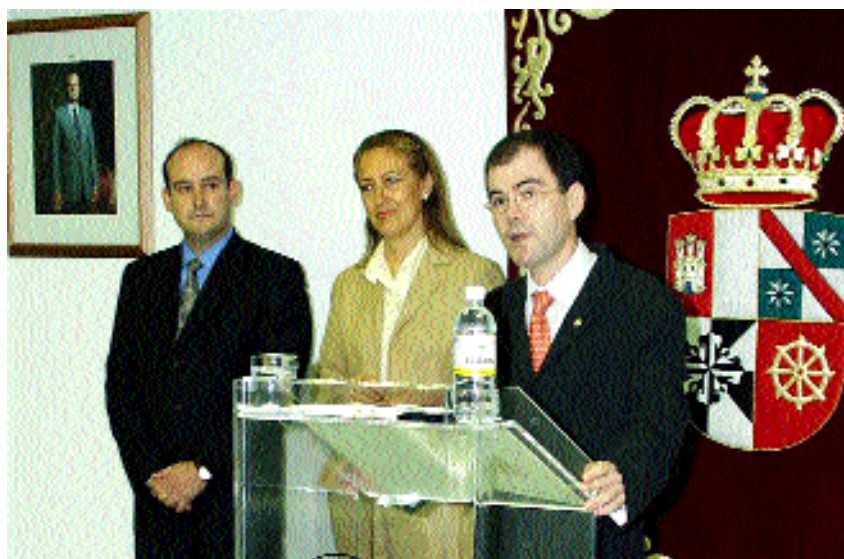
El nuevo vicerrector, durante la presentación de su equipo

Por otro lado, tenemos la intención de trasladar los cursos de verano a edificios emblemáticos, con el objetivo de lograr una mayor conexión con la sociedad con que se conense y, al mismo tiempo, ofrecer unos espacios diferentes a los de la docencia convencional. De esta forma también se favorece un ambiente distendido que propicia el diálogo y el intercambio de pareceres entre los participantes de los cursos de verano.