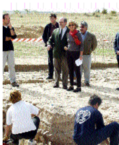
El rector y la viceconsejera, en Ercávica

sidera que Ercávica constituye un excepcional “laboratorio” para los alumnos de Arqueología de la Universidad regional. ○