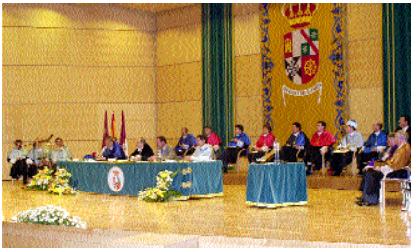
La Mesa Presidencial, junto al nuevo Doctor "Honoris Causa" y sus padrinos

La ceremonia de inauguración del curso académico se celebró en el Paraninfo de la nueva Facultad de Derecho y Ciencias Sociales