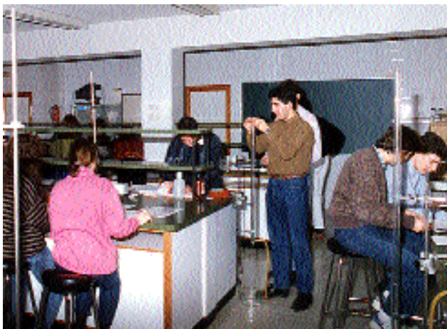
Químicas convoca el premio de fotografía San Alberto Magno