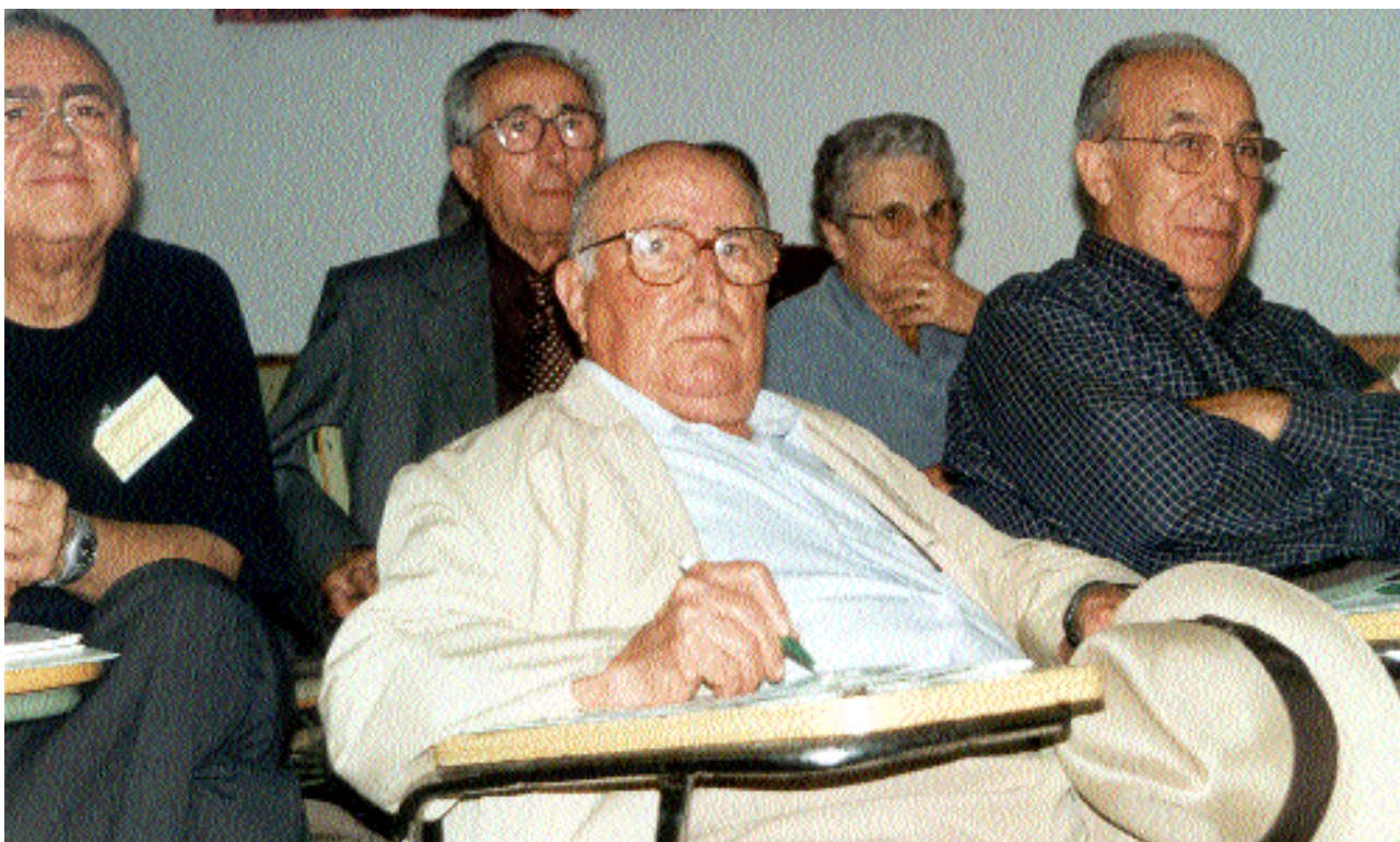
Ex combatientes del Maquis participaron en las II Jornadas de Santa Cruz de Moya