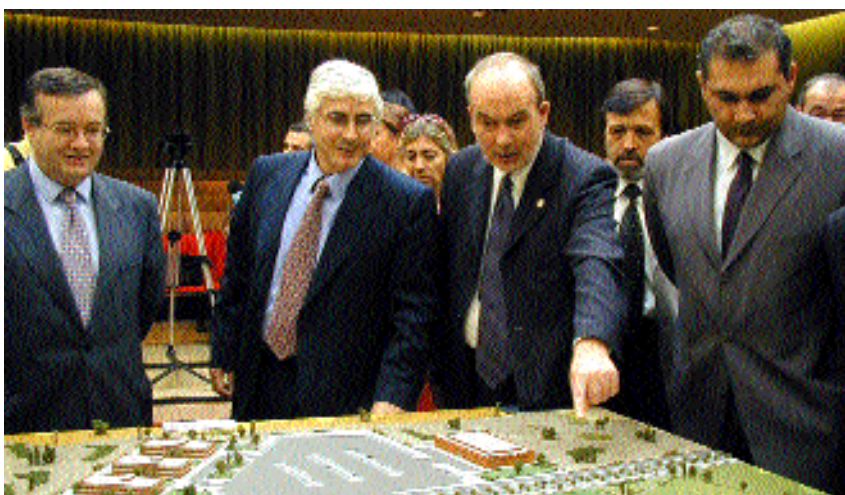
El alcalde de Albacete muestra al vicepresidente de la Junta la ubicación del Parque

Junta, Universidad, y Diputación y Ayuntamiento de Albacete colaboran en la creación de un complejo dedicado a la Investigación y el Desarrollo de carácter pionero en España