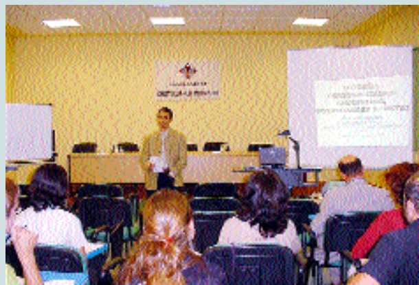
Un momento del curso celebrado en Talavera de la Reina