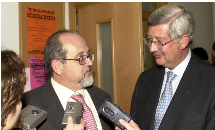
Los rectores de las universidades Complutense y de Castilla-La Mancha

Realizada en colaboración con la Universidad Complutense, se imparte en los cuatro campus y en Talavera de la Reina a través de videoconferencia múltiple