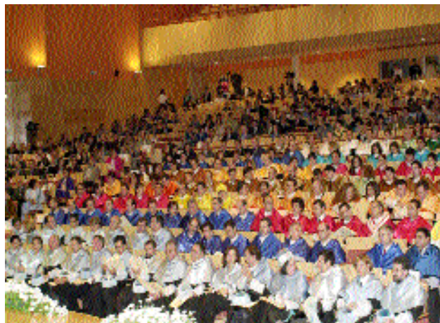
En la ceremonia fueron investidos los nuevos doctores y catedráticos