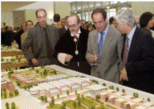
El nuevo Paraninfo acogió la exposición de maquetas de la UCLM

La ceremonia de inauguración del curso académico se celebró en el Paraninfo de la nueva Facultad de Derecho y Ciencias Sociales