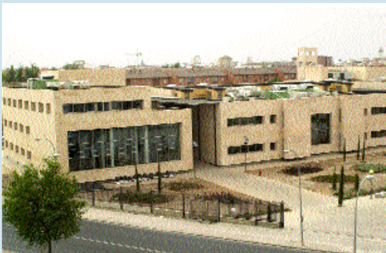
La nueva Facultad de Derecho y Ciencias Sociales se inaugur3 el 26 de septiembre

Tal y como se establece en el ceremonial, el rector hizo entrega al doctorando del Birrete, el Libro de la Sabidur3a, el Antiguo Anillo, y los Guantes Blancos, los s3mbolos que le distinguen como un miembro sobre-