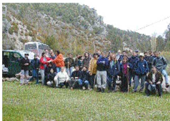
El senderismo combina deporte y naturaleza

El Servicio de Deporte de la Universidad inició el programa de actividades de carácter recreativo del presente curso con una marcha de senderismo por la Sierra de Bascuñana, al Este de Cuenca. Un total de 31 personas, entre profesores, personal de administración y servicios y alumnos de la UCLM, secundaron la iniciativa, recorriendo 17 kiló-