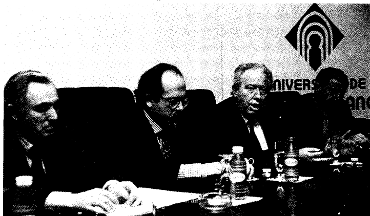
El acto de presentación se celebró en la Facultad de Químicas

Unión Fenosa ha convocado en la Universidad de Castilla-La Mancha el III Premio de Investigación, dotado con dos millones y medio de pesetas, con el fin de potenciar e incentivar las actuaciones de investigación y desarrollo en el campo de la energía, preferentemente de la energía eléctrica.