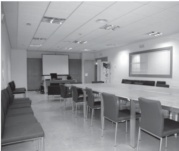
La sala principal de la Casa del Estudiante en el Campus de Ciudad Real