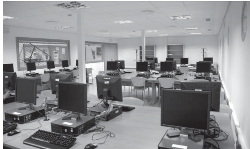
Imagen del aula de informática donada por Caja Rural