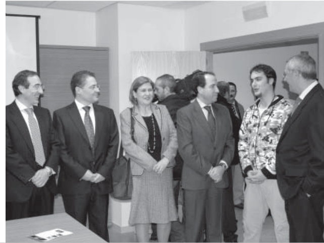
Varios jóvenes en la Casa del Estudiante. A la derecha, el rector, los vicerrectores de Campus y de Estudiantes, el delegado de Alumnos, el director general de Caja Rural y el presidente de la CEOE