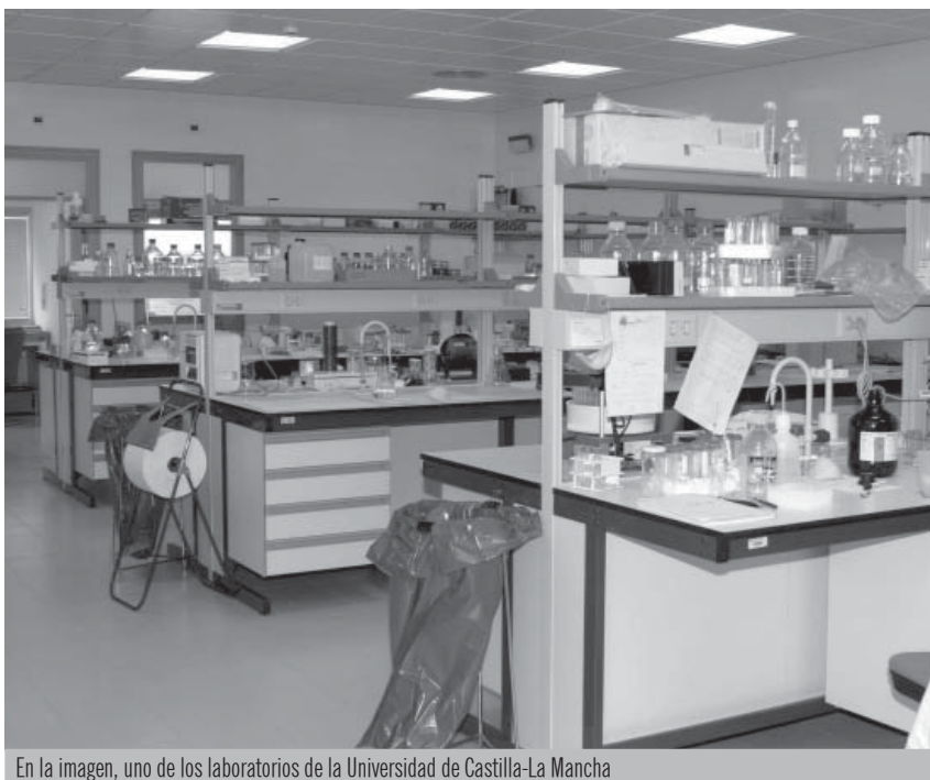
En la imagen, uno de los laboratorios de la Universidad de Castilla-La Mancha

En el cuadro que acompaña a estas líneas, se observan el detalle de la financiación en investigación.