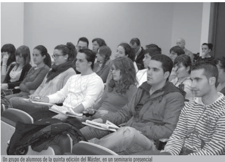
Un grupo de alumnos de la quinta edición del Máster, en un seminario presencial