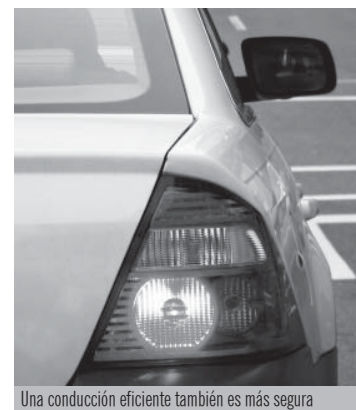
Una conducción eficiente también es más segura

De carácter gratuito y convalidable por un crédito, el curso tiene una duración de cinco horas que pueden impartirse en horario de mañana (09.00 a 14.00 horas) o de tarde (16.00 a 21.00 horas). Cada grupo está formado por una veintena de alumnos que reciben formación teórica y práctica en el uso racional de la energía. De esta manera, los par-