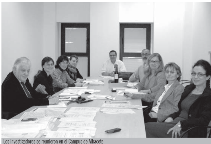
Los investigadores se reunieron en el Campus de Albacete

En un proyecto UCLM-Universidad Montesquieu-Bordeaux IV