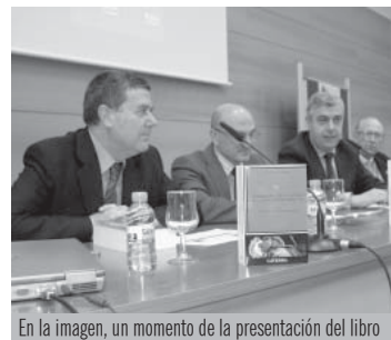
En la imagen, un momento de la presentación del libro