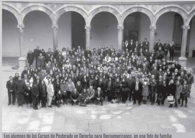
Los alumnos de los Cursos de Postgrado en Derecho para Iberoamericanos, en una foto de familia