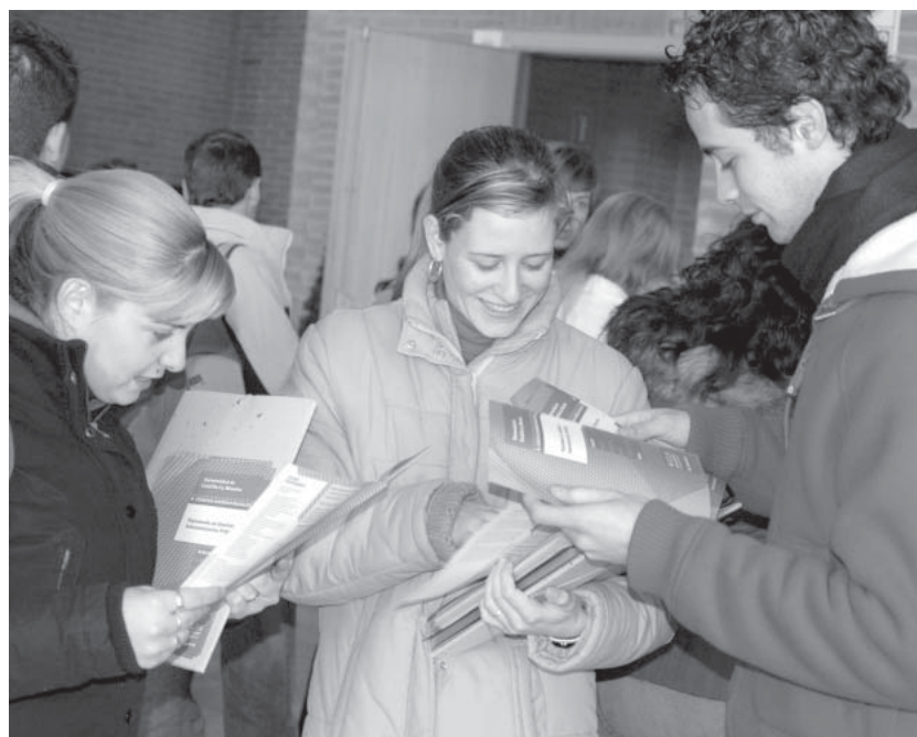
El Estatuto regula la representación estudiantil dentro de las universidades, entre otras cuestiones