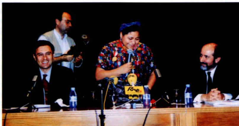
La Premio Nobel de la Paz en un momento de su intervención

"Nuestro único propósito es conseguir políticas sensibles a la sociedad y a los problemas mundiales"