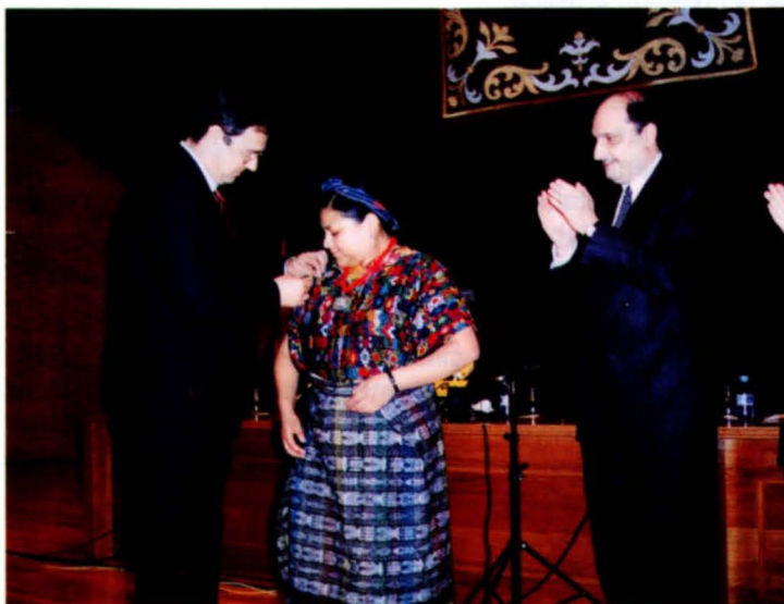
La Premio Nobel de la Paz fue homenajeada por la UCLM que le impuso la Medalla de Oro

Rigoberta Menchú, Premio Nobel de la Paz en 1992, recibió la medalla de oro de la Universidad de Castilla-La Mancha como homenaje a su lucha en defensa de las minorías indígenas del mundo.