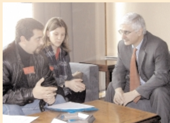
El vicepresidente de la Junta recibió a los alumnos en Toledo

Este último, se confesó “agradecido y honrado por el gesto que han tenido los estudiantes”, al tiempo que aplaudió la implantación del itinerario de Turismo en la UCLM. ○