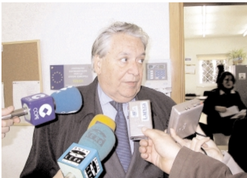
El presidente de la Audiencia Nacional, Clemente Auger, atiende a los medios

Además, el redactor debe tener una equilibrada escala de valores para priorizar la prevalencia de derechos fundamentales frente al ejercicio de su profesión. En caso contrario, pueden desencadenarse consecuencias irreparables. Así sucedió con la publicación de un reportaje en la revista “Interviú” sobre dos personas que presuntamente actuaban como confidentes de los Cuerpos y Fuerzas de Seguridad del Estado, informando sobre los movimientos de activistas de la banda terrorista ETA.