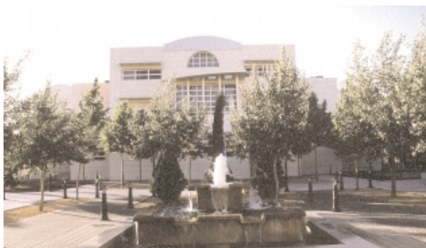
La Facultad de Ciencias Químicas será la sede de la Jornada sobre calidad y seguridad

La Facultad de Ciencias Químicas celebró una Jornada sobre el marco legal de la calidad y seguridad en la Unión Europea con el objetivo de dar a conocer las normativas que rigen actualmente en este ámbito.