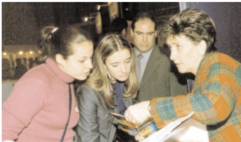
La vicerrectora de Alumnos informa a dos estudiantes sobre la oferta de la UCLM

El público se mostró especialmente interesado por la información referente a las infraestructuras de la UCLM, sobre todo en materia tecnológica, y en la oferta académica de esta Universidad. Los jóvenes valoraron también iniciativas como el de las tutorías personalizadas, que consideraron de gran utilidad a la hora de acceder a la enseñanza superior; y quisieron conocer los detalles de titulaciones con buenas perspectivas de inserción laboral, como las ingenierías de Caminos, Canales y Puertos e Informática, la técnica de Telecomunicaciones, o las licenciaturas en Medicina, Químicas, Ciencias de la Actividad Física y el Deporte, o Medio Ambiente.