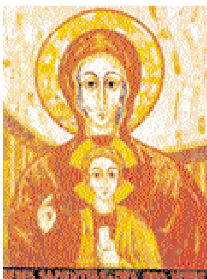
En la imagen, el icono Sedes Sapientiae

La imagen desfiló por diferentes centros del campus albaceteño, entre estos, la residencia universitaria Benjamín Palencia, el Centro Jurídico