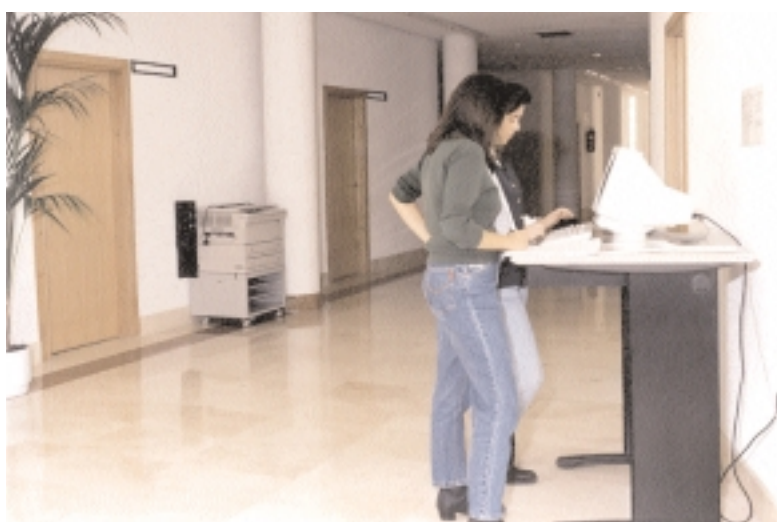
Dos alumnas consultan las revistas digitales de la Biblioteca Virtual

El servicio incorporará de forma inmediata los contenidos de 2.500 títulos electrónicos