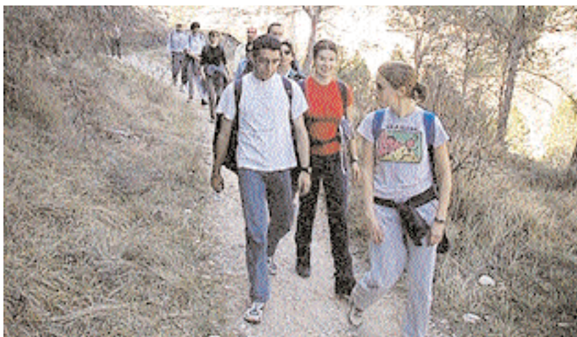
El estudio se realizará sobre la población estudiantil regional de entre 13 y 16 años