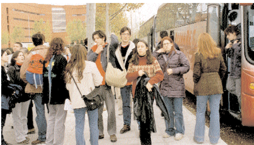
La Universidad fletará autobuses para trasladar a los alumnos a los diferentes campus

Infraestructuras modernas, patrimonio histórico-monumental, profesores con una excelente formación, continua actividad investigadora, y todos los recursos de las nuevas tecnologías, constituyen algunos de los valores añadidos de la Universidad regional que los castellano-manchegos podrán comprobar sobre el terreno.