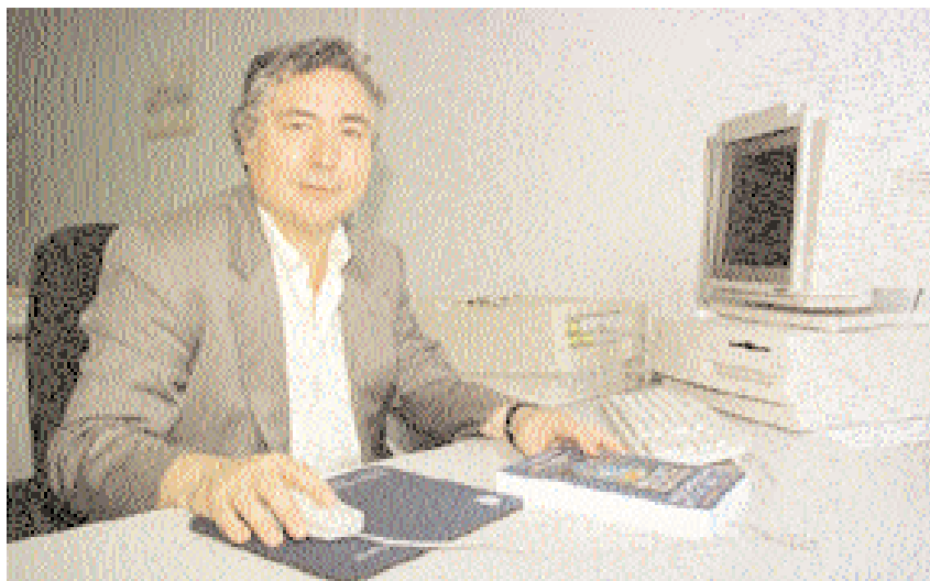
El profesor Manuel Castells, experto internacional en la sociedad de la información

Él mismo ha sugerido una clasificación de sus piezas teatrales: “teatro de farsa y calamidad”, que incluye obras como El rayo colgado , Tórtolas, crepúsculo... y telón o Funeral y pasacalle ; y “teatro furioso”, en el que encuadra títulos como Pelo de tormenta , Es bueno no tener cabeza y La carroza de plomo candente . En 1991 se publicó su Teatro Completo . Pertenece a la Real Academia desde 1986. ○