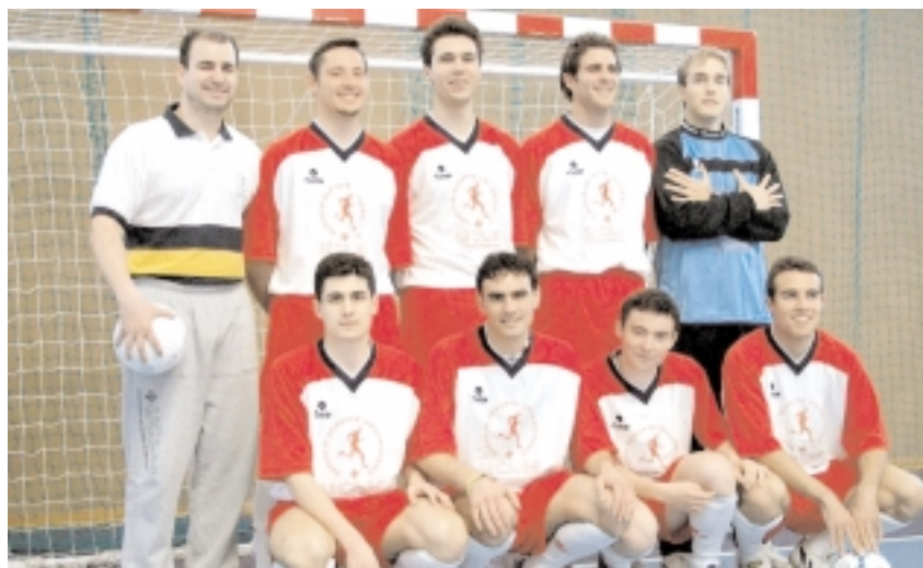
En la imagen, la competitiva selección de fútbol sala de la Universidad regional

Los deportistas de la Universidad de Castilla-La Mancha culminan una brillante temporada en fútbol sala, kárate, judo, balonmano y orientación