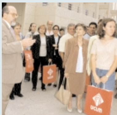
Imagen de la primera visita de los padres de alumnos al campus de Ciudad Real

Este ambicioso programa de puertas abiertas comprende varias líneas de actuación. En primer lugar, los alumnos de cada una de las provincias podrán visitar su campus de referencia geográfica. Como ejemplo, aproximadamente 1.800 estudiantes preuniversitarios de la provincia de Ciudad Real visitan este campus los días 26 y 27 de marzo.