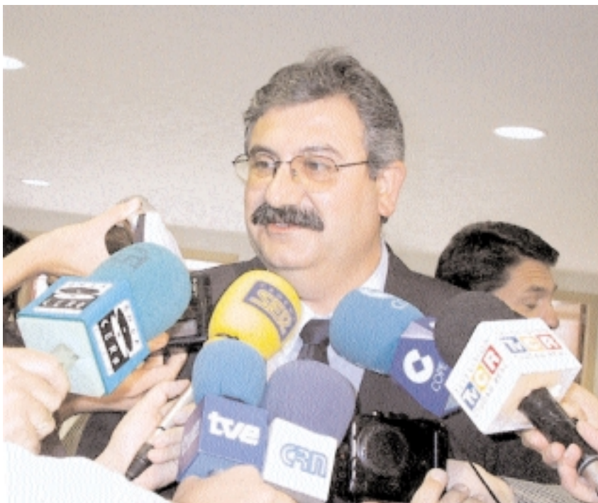
El consejero de Educación atiende a los medios de comunicación

La modificación de los Reales Decretos de Enseñanzas Mínimas no responde a la necesidad de mejora de las Humanidades ni al dictamen de la Comisión que se creó en el Parlamento. Muy al contrario, contiene elementos de retroceso como la reducción drástica del horario de materias fundamentalmente humanísticas. Desde el Gobierno de Castilla-La Mancha vamos