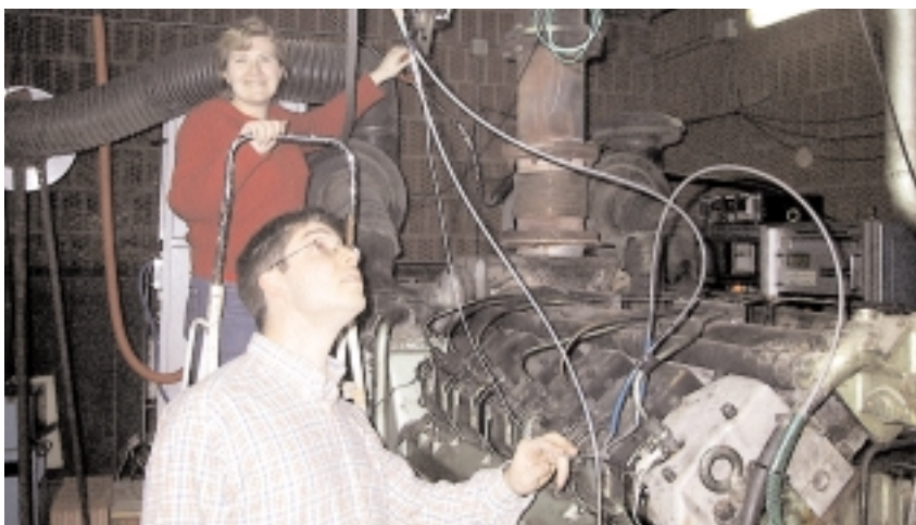
Los ingenieros industriales tienen una alta tasa de incorporación laboral a corto plazo