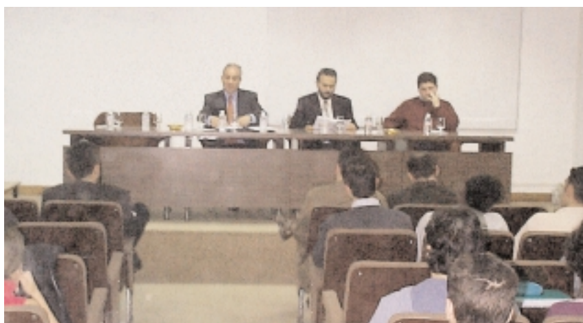
En la imagen, un momento de la jornada celebrada en la Politécnica de Almadén