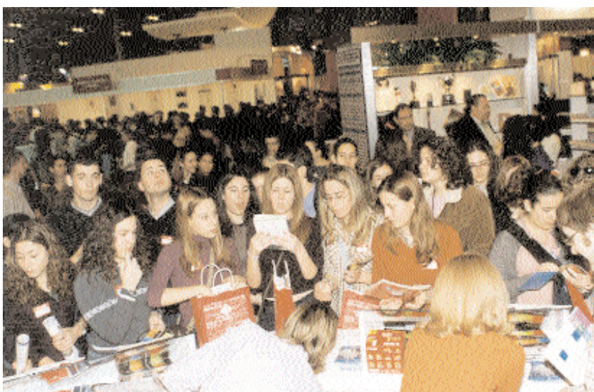
Numerosos estudiantes visitaron el stand de la UCLM en Aula 2001

La Universidad de Castilla-La Mancha presentó su oferta académica en el Salón del Estudiante con una imagen vanguardista, apoyada en las nuevas tecnologías de la información y la comunicación. De hecho, la UCLM fue la única universidad pública que trasladó “virtualmente” a los visitantes de Aula hasta sus centros mediante el sistema de videoconfe-