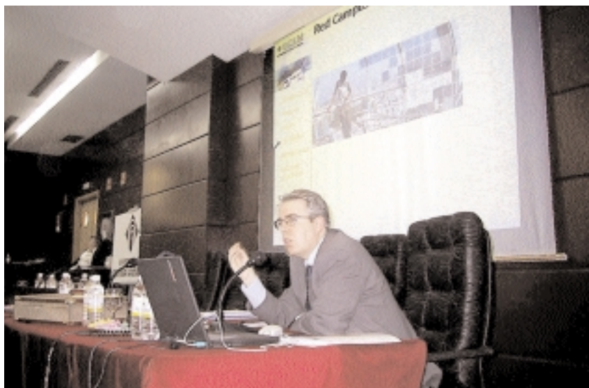
El gerente del Área de Informática y Comunicaciones expuso el Plan al Claustro

Uno de los subprogramas más complejos dentro del Plan de Nuevas Tecnologías era el de la renovación de los equipos informáticos del Personal Docente e Investigador (PDI). En estos escasos doce meses, han estrenado un equipo de última generación nada menos que 1.311 profesores. Se da la circunstancia, además, de que este equipamiento está garantizado por tres años -por lo que el coste de man-