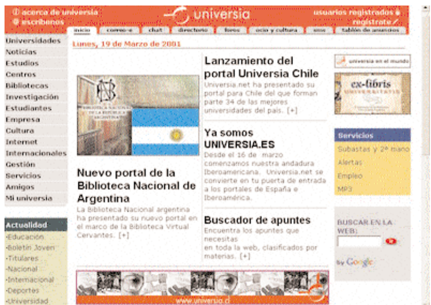
Página principal del portal www.universia.net