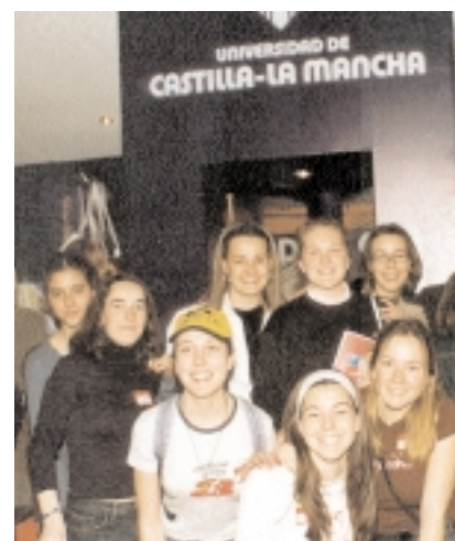
Arriba, la Infanta Elena y la ministra de Educación, junto al stand de la UCLM. Diversos momentos de Aula, y -a la izquierda- el director general de Política Educativa, junto a la Vicerrectora de Alumnos