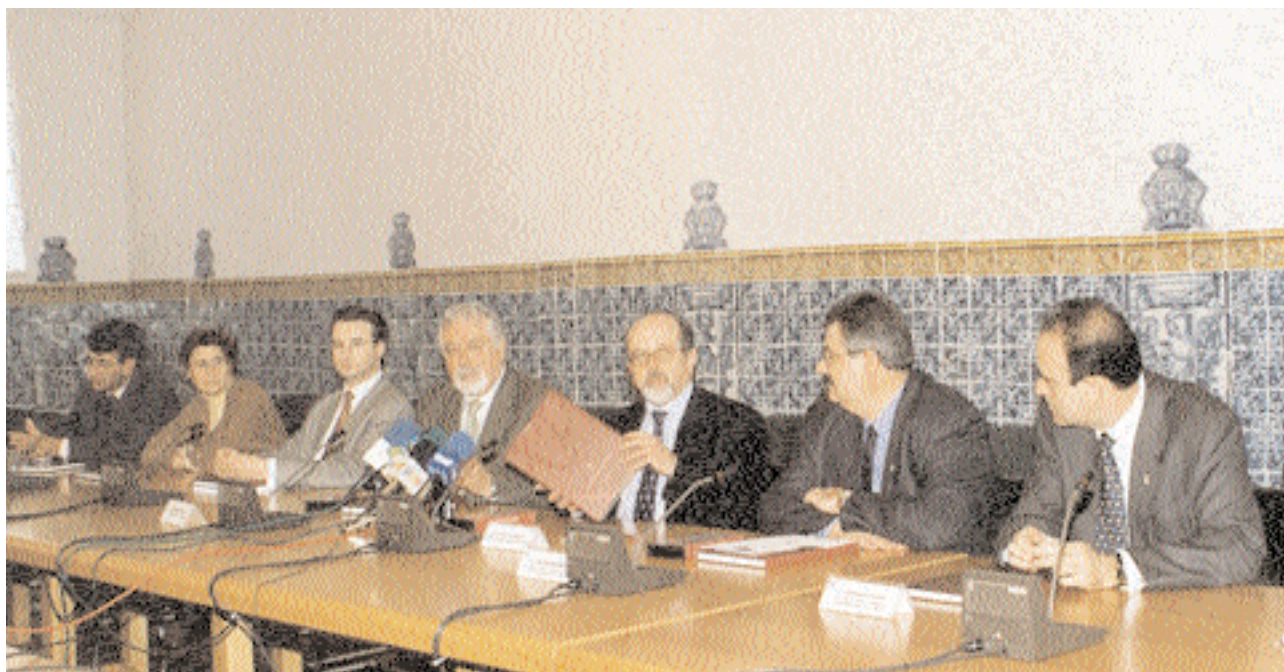
A la presentación del libro, el cdrom y el vídeo de los 15 asistieron, entre otros, el rector, el consejero de Educación, el presidente de las Cortes regionales y el director general de Universidades, Ignacio Gavira