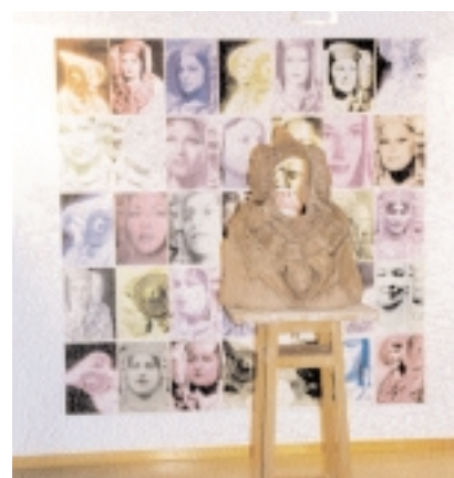
Imagen de Situaciones 2000

Concebido como un espacio de encuentro, reflexión y debate de la creación contemporánea, Situaciones es un festival multidisciplinar compuesto por exposiciones colectivas y proyec-