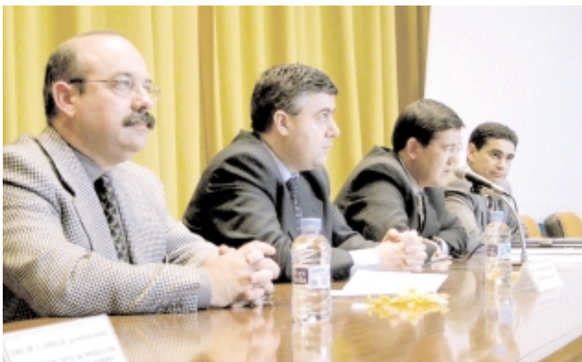
El curso de Agricultura Ecológica se inauguró el pasado 20 de marzo

Aunque el porcentaje de productos “ecológicos” que llega al mercado es aún muy reducido, el profesor De Las Heras prevé un crecimiento del mis-