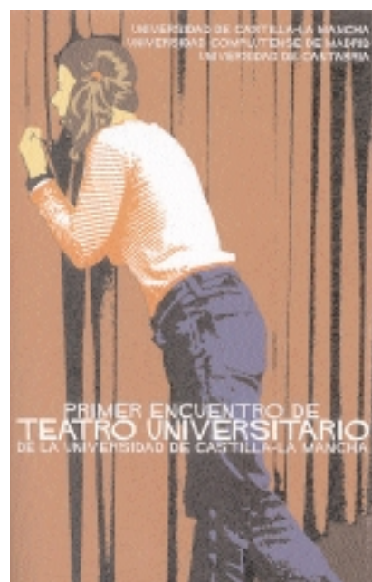
Cartel anunciador del Encuentro

Los participantes de la Universidad Complutense de Madrid, el grupo Tercer Grado, escenificó la divertida obra Dios (una comedia) del excéntrico realizador y escritor Woody Allen. Por último, La Machina dedicó un intenso homenaje al poeta José Hierro con su obra Palabra de Hierro . ○