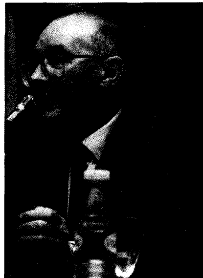
El ex-embajador de Alemania en España