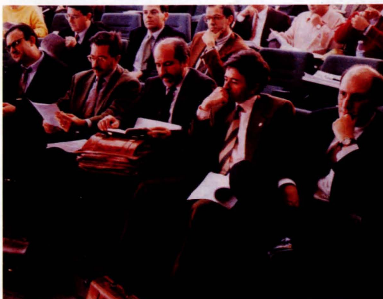
Un momento de la reunión mantenida por los miembros de la Junta de Gobierno de la Universidad

La Junta de Gobierno de la UCLM, con motivo del recurso presentado por el Patronato Universitario de Toledo, ante la desestimación por parte de la misma de crear un Centro Universitario en Talavera, se reunió el pasado día 13 para analizar de nuevo esta cuestión. La conclusión fue que, debido a la entrada en vigor de una nueva ley que otorga competencias en materia universitaria a la Junta de Comunidades será ésta quien determine la implantación de estudios superiores adscritos en la ciudad de la cerámica.