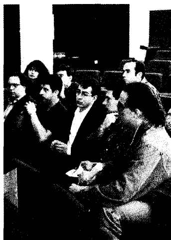
Algunos representantes de los estudiantes en la Junta de Gobierno