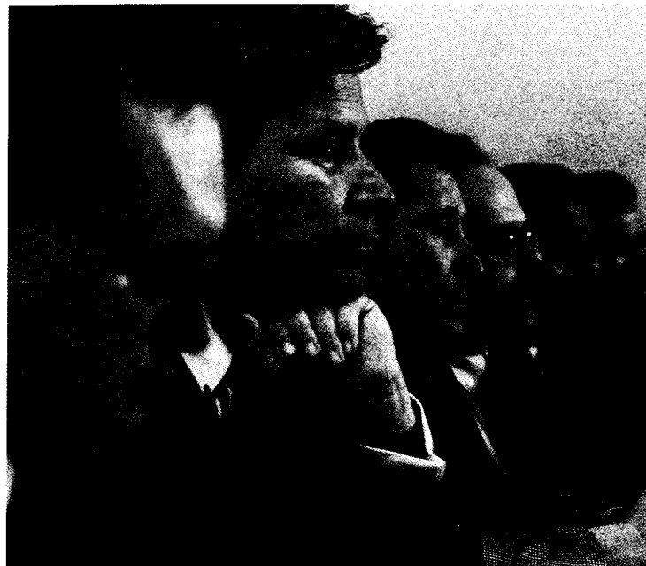
El director general de Política Alimentaria, acompañado del Rector y otras autoridades durante el acto inaugural

Durante su intervención, Miguel Angel Díaz-Yubero mostró la preocupación existente en el Ministerio en relación a la nueva Organización Común del Mercado del Vino, expli-