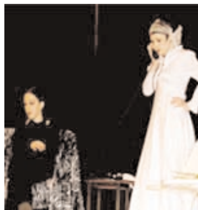
En la imagen, una de las representaciones