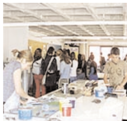
Las imágenes recogen distintos momentos de las visitas de los alumnos y profesores preuniversitarios a los campus de la Universidad de Castilla-La Mancha