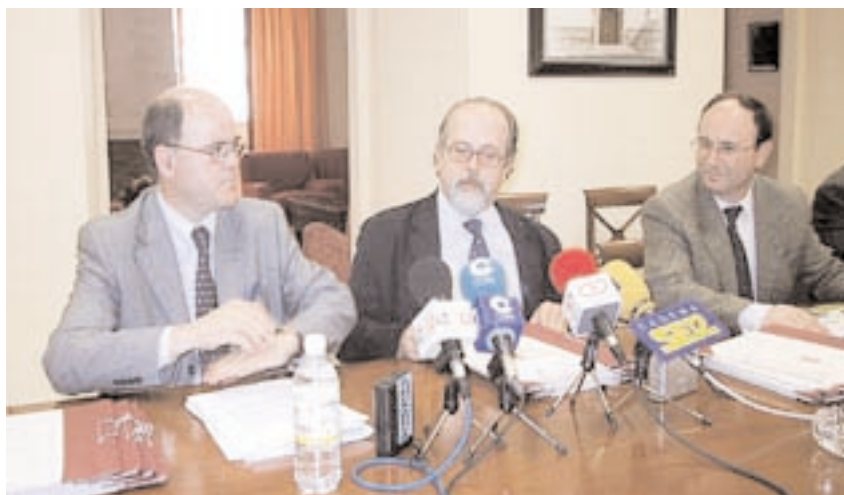
El consejero de Agricultura y Medio Ambiente y el rector, después de firmar el convenio

El acuerdo, que se realizará a través del CREA, persigue el establecimiento de una red de muestreo de aguas subterráneas y superficiales, el seguimiento de los parámetros físicos, químicos y biológicos que determinan el buen estado de los recursos hídricos, o la interpretación de los resultados obtenidos de este análisis bajo un punto de vista biológico, hidrogeológico y agronómico, que se plasmarán en informes anuales. Además, se pretende la creación de una base de datos permanente sobre el estado físico, químico y biológico de las aguas de Castilla-La Mancha. ○