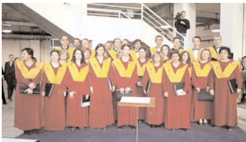
La Coral Universitaria de Ciudad Real realiza una importante labor de difusión cultural

Como producción propia: las doce ediciones del Concierto de Navidad, tres del Concierto de Semana Santa, ofreciéndose en varias localidades de la Región, el I Encuentro de Corales Universitarias en Ciudad Real y la edición de un álbum CD.