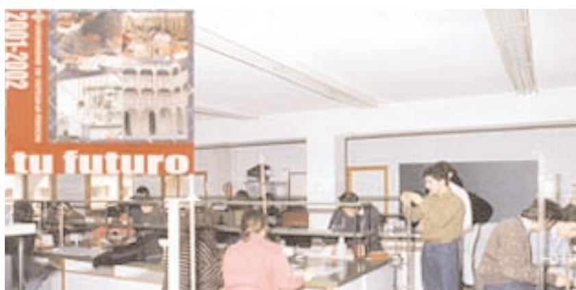
El CD-Rom ofrece información sobre titulaciones, laboratorios, servicios, etcétera

El nuevo CD-Rom es interactivo, y el usuario puede elegir el itinerario de sus consultas, “navegando” hasta los capítulos que considere más interesantes: las características de las seten-