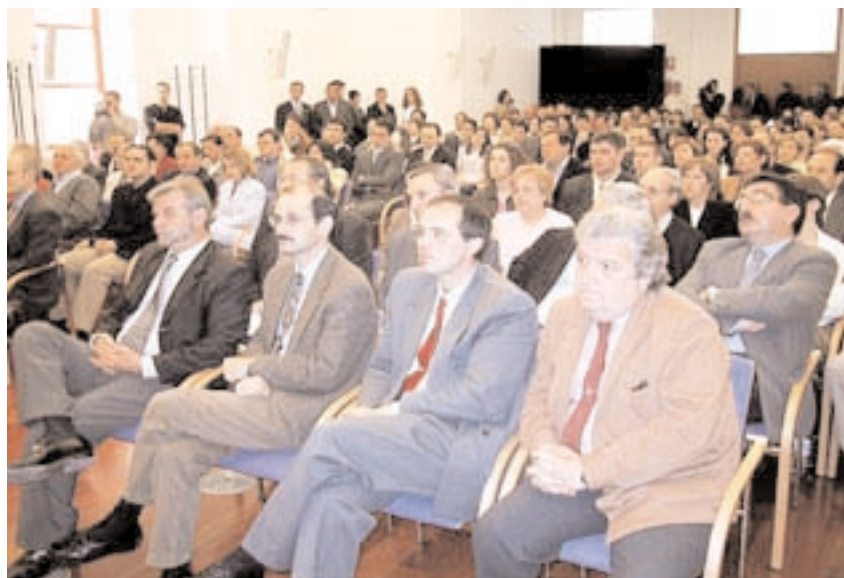
El público, en su mayoría profesores y padres de alumnos, abarrotó el Paraninfo

El rector efectuó estas manifestaciones durante la entrega de los premios a los mejores expedientes académicos del curso 2000-2001, un acto de reconocimiento de la propia UCLM y de la entidad financiera Caja Castilla-La Mancha a los estudiantes que obtuvieron las mejores calificaciones en su respectiva titulación o en el proyecto fin de carrera.