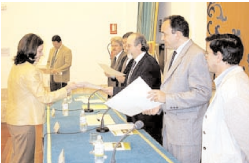
Una de las alumnas del curso de Especialista en Desarrollo Rural recibe su diploma

La Universidad y los Centros de Desarrollo Rural de Castilla-La Mancha han especializado a una veintena de profesionales en la gestión de los fondos comunitarios destinados a la modernización de los pueblos