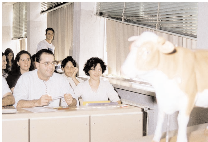
Un grupo de alumnos, en una clase en la ETSIA

Precisamente éste es uno de los objetivos del Plan de Mejora de la Calidad que estamos desarrollando. Nuestras primeras referencias son de un nivel de inserción laboral bastante elevado, siendo las empresas de servicios y del sector agroalimentario las