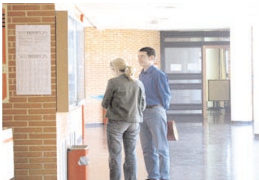
Dos alumnos leen el tablón de anuncios en la Escuela Técnica Superior de Agrónomos

“La incorporación de patrimonio agrario enriquece las actividades docente e investigadora”