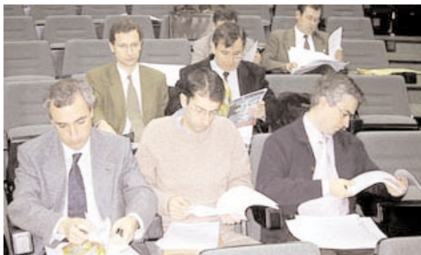
En la imagen, varios profesores durante la última Junta de Gobierno

De esta forma, se convocará a distrito único el 20% de las plazas correspondientes al área biosanitaria, es decir, Medicina, Enfermería y Fisioterapia. Este es el porcentaje mínimo que contempla la Ley para el primer año de vigencia del Distrito Único, que deberá ampliarse progresivamente hasta llegar al 100% en el curso 2003-2004.