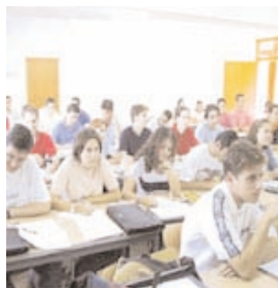
Se anuncian cambios en la Universidad