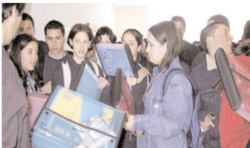
Los alumnos recibieron abundante material informativo sobre la Universidad

las aulas de informática, de libre uso para los matriculados en la UCLM. Los jóvenes se mostraron especialmente interesados por este último servicio, pues consideran que la Universidad debe poner a disposición de sus