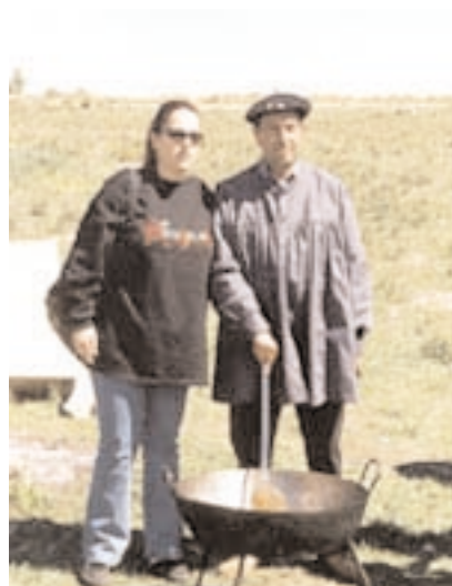
Una alumna posa con uno de los miembros de Quijote 2000

En este especial entorno, los universitarios disfrutaron de una comida tradicional manchega elaborada por la