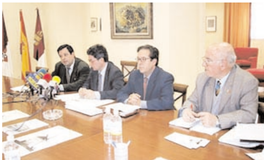
El Congreso se presentó en el Rectorado de la Universidad