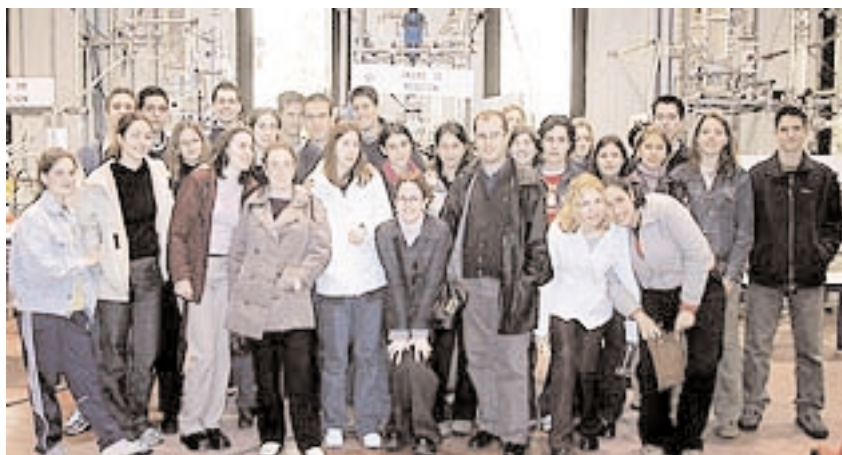
El “Suplemento al diploma” facilitará la inserción laboral en los países de la UE

Este suplemento acompañaría al título original, explicándolo de una forma más exhaustiva, y ayudando a interpretar el contenido de ese título original. El no-reconocimiento y la infravaloración de titulaciones constituyen un problema general, dado que éstas por sí solas no ofrecen información suficiente. Además, este docu-