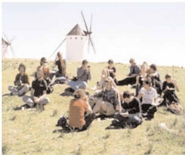
Los alumnos descansan en el cerro de La Paz de Criptana

Entre las visitas obligadas, la Casa-Museo del Quijote, el convento de las Trinitarias Recoletas (siglo XVII) o la Iglesia de San Antonio Abad (del siglo XV). ○