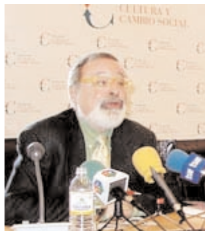
Fernando Savater, en Toledo

“La principal producción de la democracia deben ser los ciudadanos”, señaló, si bien recordó que no se puede adquirir esta condición sin haber sido educado para ello. Por esta razón, defendió la educación como un herramienta fundamental para la consolidación democrática. Fernando Savater realizó estas declaraciones en el