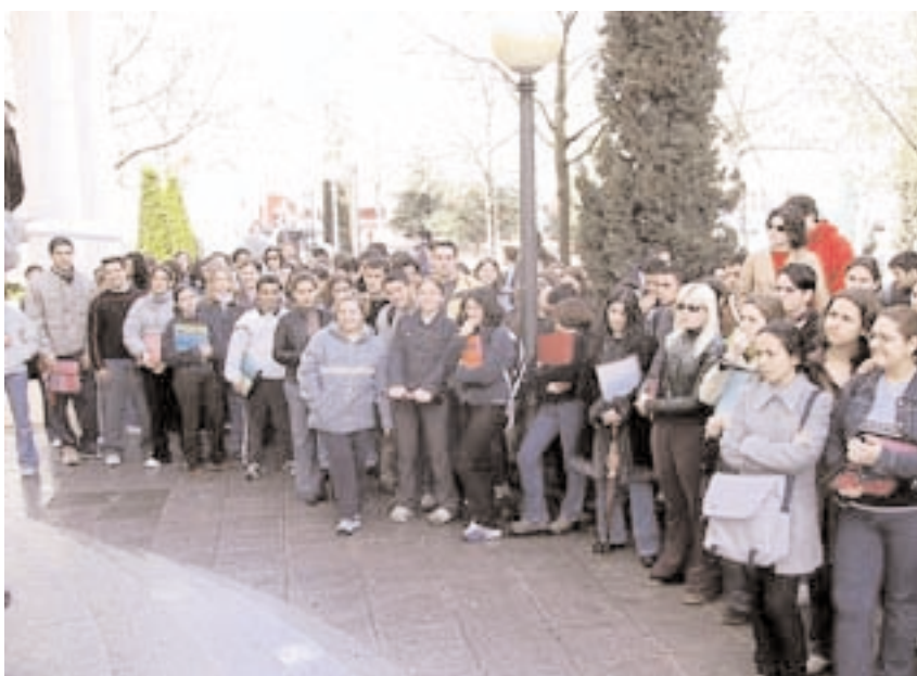
Varios centenares de alumnos, en una de las visitas programadas por la UCLM

Miles de estudiantes y numerosos profesores de Secundaria y Bachillerato conocieron la oferta académica de la Universidad de Castilla-La Mancha en sus diferentes campus y comprobaron el alto nivel de servicios de una institución en permanente crecimiento