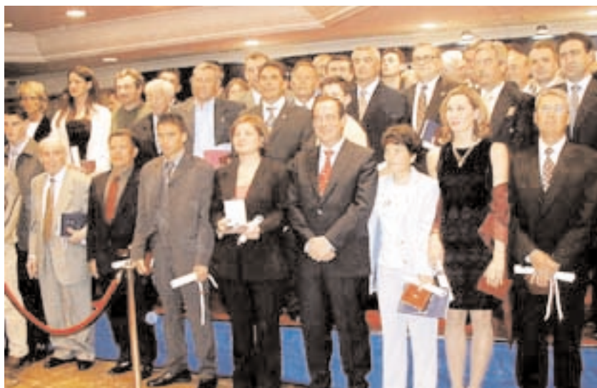
Los premiados posan con el presidente del Gobierno regional

Durante la ceremonia, celebrada en Toledo el pasado 30 de marzo, se re-