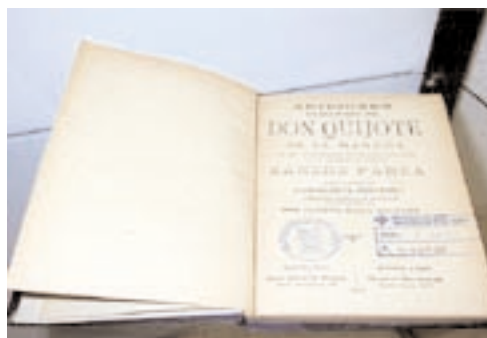
Dos de los ejemplares que pueden contemplarse en la exposición