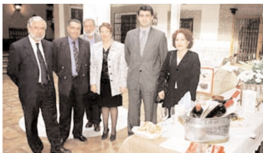
El director general de Turismo -a la izquierda-, en la clausura de las Jornadas

Según los datos de la Dirección General de Turismo, el pasado año 2000 visitaron la región 1.890.000 perso-