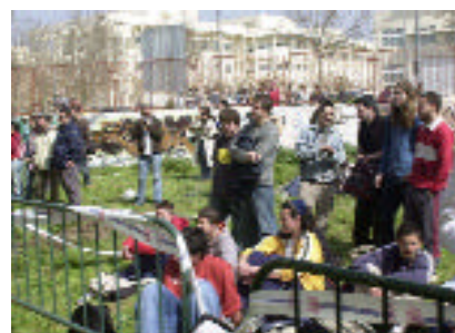
Diferentes secuencias de la exhibición de graffiti realizada en el Instituto de Enseñanza Secundaria Juan de Ávila