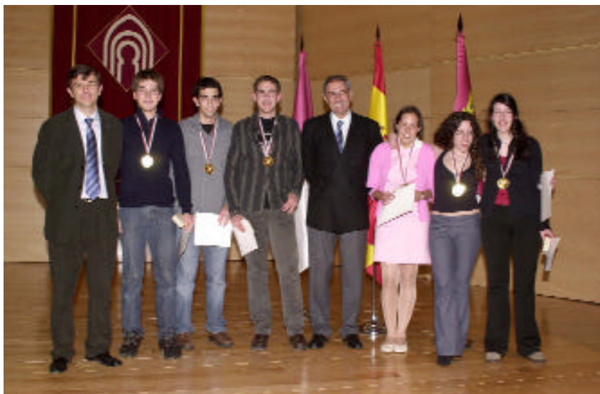
El rector de la UCLM posa con los alumnos que obtuvieron medallas de oro