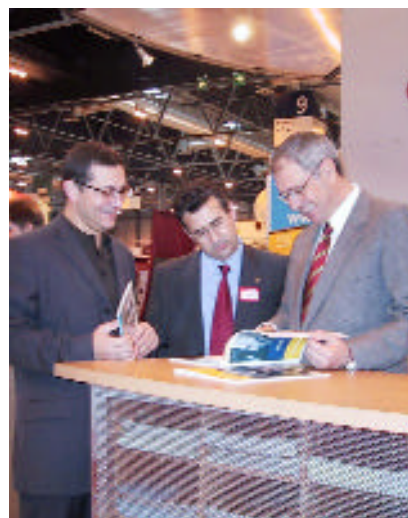
El rector y los vicerrectores de Relaciones Internacionales y de Profesorado, en Aula

El grueso de asistentes a Aula lo constituyen estudiantes de Secundaria que necesitan disponer de una información clara a la hora de decidir sobre su futuro universitario. También acuden alumnos universitarios que con-