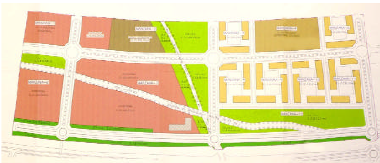
Plano del sector denominado A-UNIV de expansión de Ciudad Real, que incluye la parcela cedida a la Universidad regional