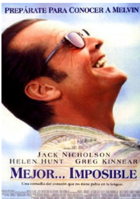
"Mejor imposible", uno de los filmes del ciclo

Para Luis Landero, quien también ha sido profesor en diferentes niveles educativos, parte del problema se encuentra en la paulatina desaparición de la literatura de la enseñanza. ○