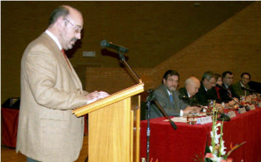
El director de Agrónomos se dirige al auditorio en la celebración del aniversario