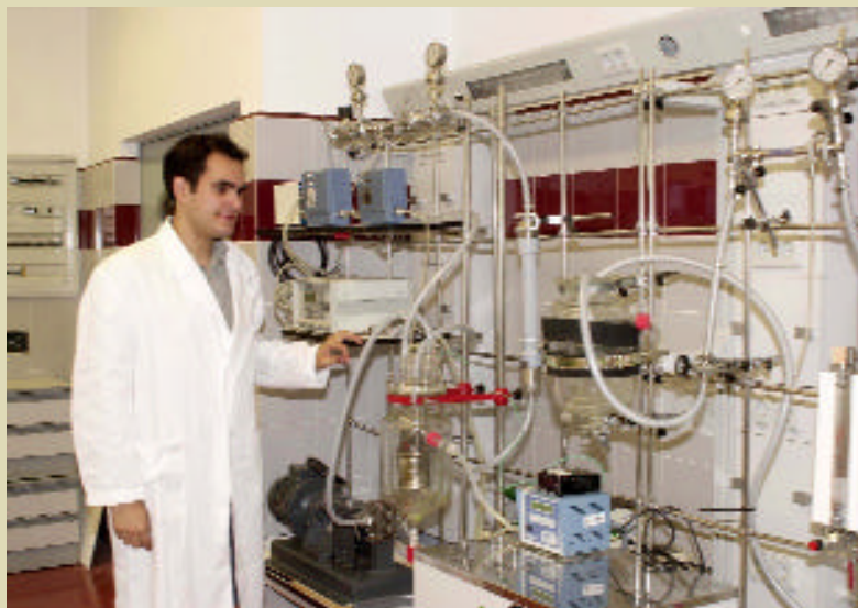
El Máster se celebra en la Facultad de Químicas