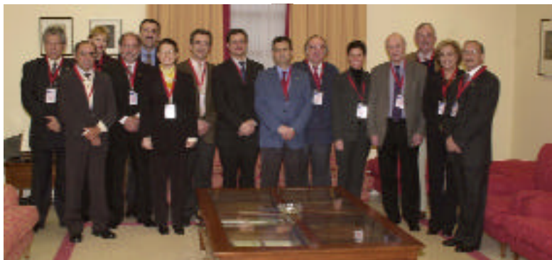
Los representantes de la Red Alfa, reunidos en Ciudad Real

Representantes de estas instituciones se han reunido en la UCLM en lo que constituye el segundo encuentro de la red PEVRELAU (el primero se celebró en Brasil el pasado año), con la intención de seguir avanzando en sus objetivos fundamentales: recopilar los métodos existentes para evaluar el rendimiento del personal de las universidades y estudiar su aplicabilidad, analizar las características del personal universitario (docente, investigador y administrativo) para dilucidar qué métodos de evaluación del rendimiento pueden adaptarse a sus plantillas, recopilar las experiencias realizadas en las universidades participantes en la red, y proponer uno o varios modelos de evaluación del rendimiento. ○