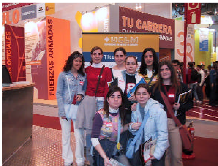
Un grupo de alumnas de bachillerato posa junto al stand de la UCLM en Aula

El Salón del Estudiante está organizado por IFEMA, con el patrocinio del Ministerio de Educación, Cultura y Deporte, fruto del convenio que anualmente firman ambas instituciones. ○