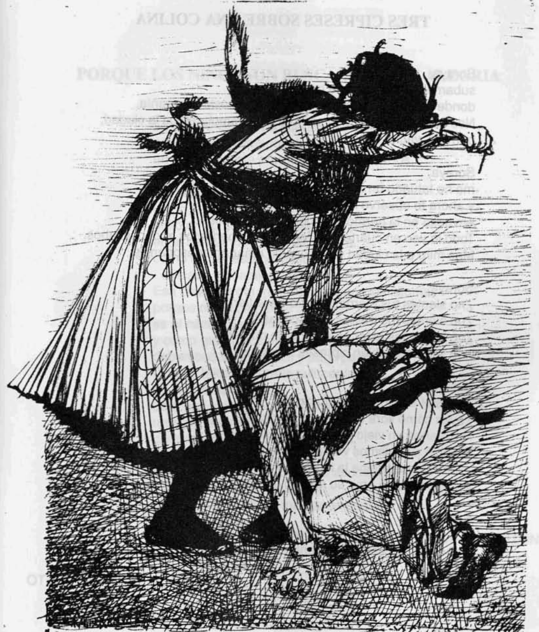
"La Escalona" de F. García Parón. Madrid 1971