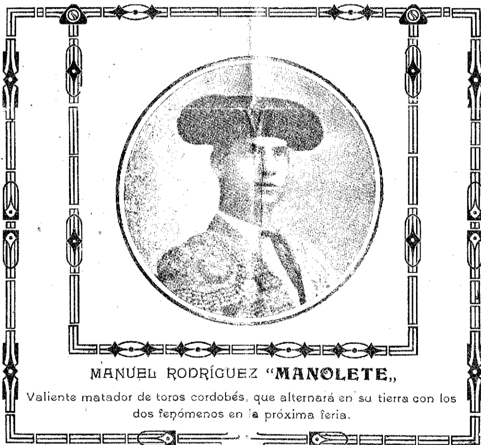
MANUEL RODRÍGUEZ "MANOLETE,"

Valiente matador de toros cordobés, que alternará en su tierra con los dos fenómenos en la próxima feria.