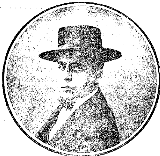
FRANCISCO POSADA Este simpático matador que es uno de los primeros en el arte y que lo conocemos, alternará el día 25 del corriente en la plaza de Almagro con Gaona y Ballesteros.

Posada lancea con lucimiento, oyendo una ovación.