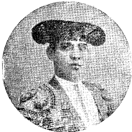
RODOLFO GAONA Valiente matador de toros que figura en primera fila y que matará en Almagro cuatro ejemplares el día 24 y 25 del corriente.

Gaona encuentra al toro quedado; faena de muleta movida, abusando del