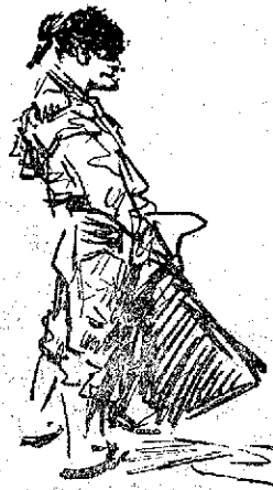
R. B. 1914

De los piqueiros... un monumental puyazo del mexicano Conejo chico , y basta.—SOLFA.