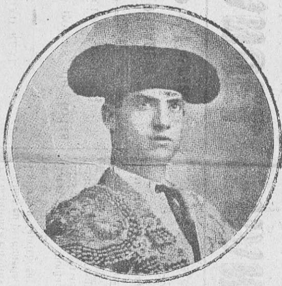
Manuel Rodríguez (Manolete)