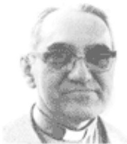
Monsenor Romero —