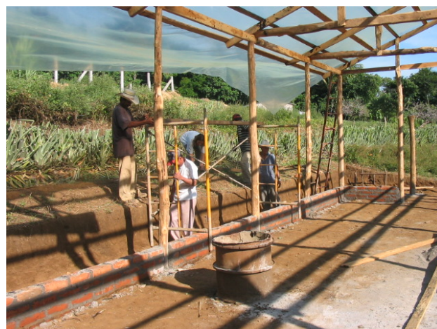
Construcción de invernadero en en "El Cerrito"

bellos y zonas en las que uno no aprecia que pudiera estar en un país como El Salvador. Claro está que no son más que burbujas y pequeños paraísos que permiten soñar con un país diferente y con una realidad lejana a la actual, pero para llegar a ese "status" hace falta mucho trabajo y muchas más ganas aún de querer conseguir un cambio.