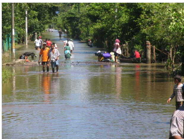
Puerto Parada, un ejemplo de los efectos s del Stan.

El Salvador, país chiquito, su superficie es equivalente a la de Ciudad Real mas una quinta parte de Albacete y su población aproximadamente es 12,5 veces la de Ciudad Real, por lo que nos damos cuenta que, ante todo, no es un país despoblado. Sus problemas sociales, políticos, medioambientales y económicos están patentes en casi la totalidad del país. Su historia es dura, llena del terror de la guerra y marcada por el hierro de las políticas autoritarias, pero no por ello el/la salvadoreñ@ es una persona arisca y poco próxima al extraño que llega a su casa. En El Salvador existe una tendencia natural a tratar a cualquiera como si fuera un amigo, la acogida siempre es amable, cordial, fraterna y desinteresada, las personas que aquí viven son de las más lindas que hemos podido encontrar hasta ahora.