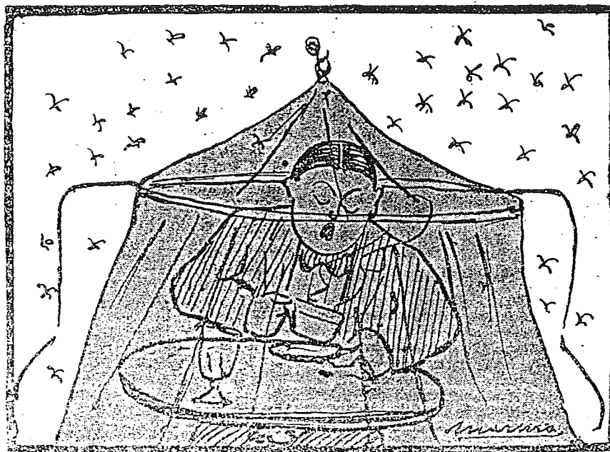
Aparato protector para tomar café en el Casino de Ciudad Real. — No se vende casa de Mur.

Rogamos se nos atienda, porque estamos dispuestos á insistir en este particular cuanto sea necesario y á hacer llegar nuestras quejas á más altos Tribunales si este nos desoyese.