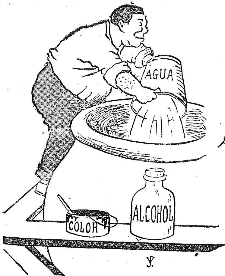
Un buen cosechero exportador de vinos.