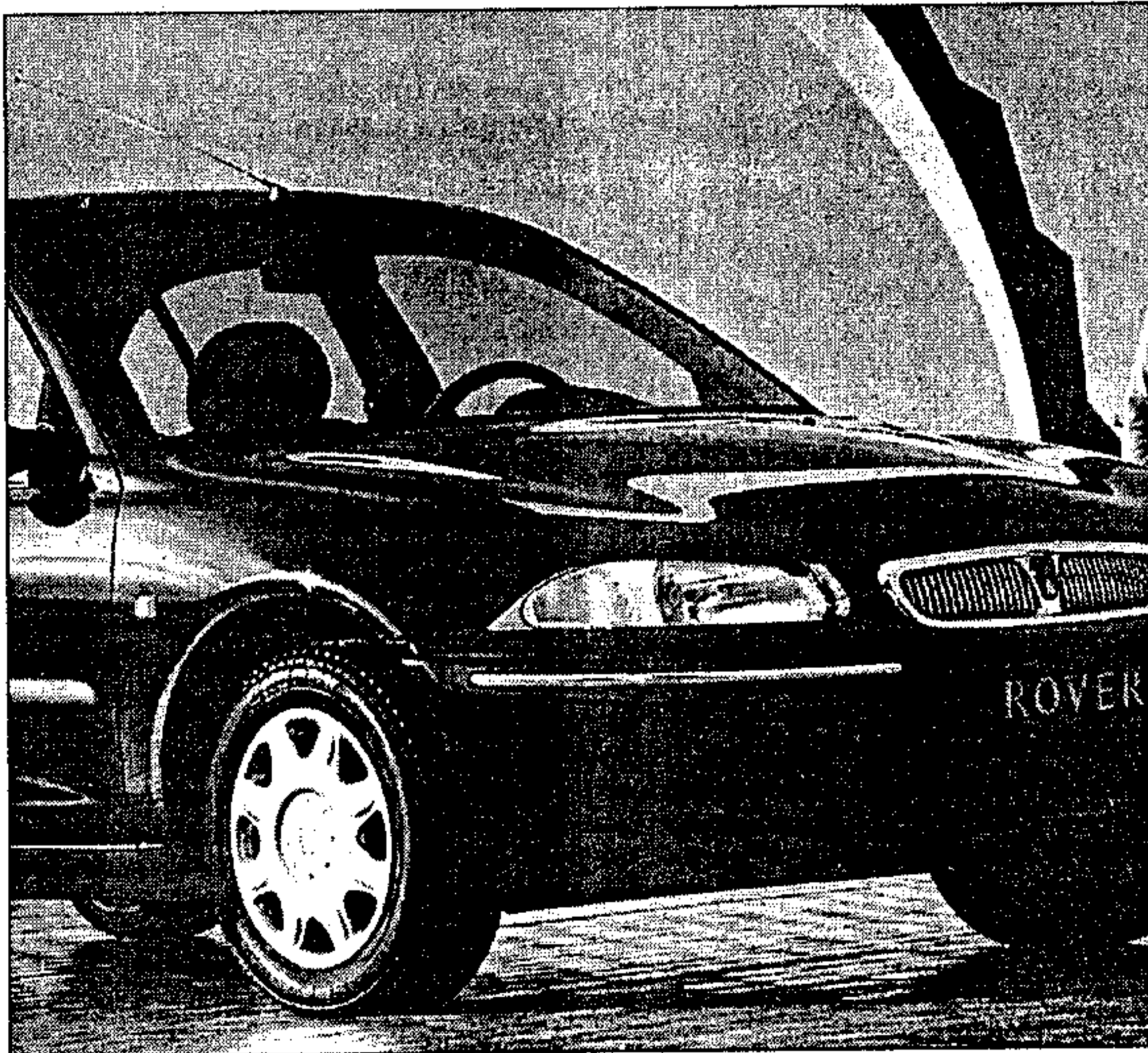
En mayo se lanzará al mercado el nuevo Rover Serie 200

E L nombre Rover ha estado siempre asociado con ciertos valores. Estos vehículos son conocidos por su carácter «inglés» y su estilo exclusivo con su parrilla cromada y toques de madera y cuero. Ahora ha llegado al mercado un nuevo Rover en el que se mezcla la evolución con la revolución, la tradición con el progreso. Es el nuevo Rover de la Serie 200, un coche que ha sorprendido por su aspecto joven y dinámico.