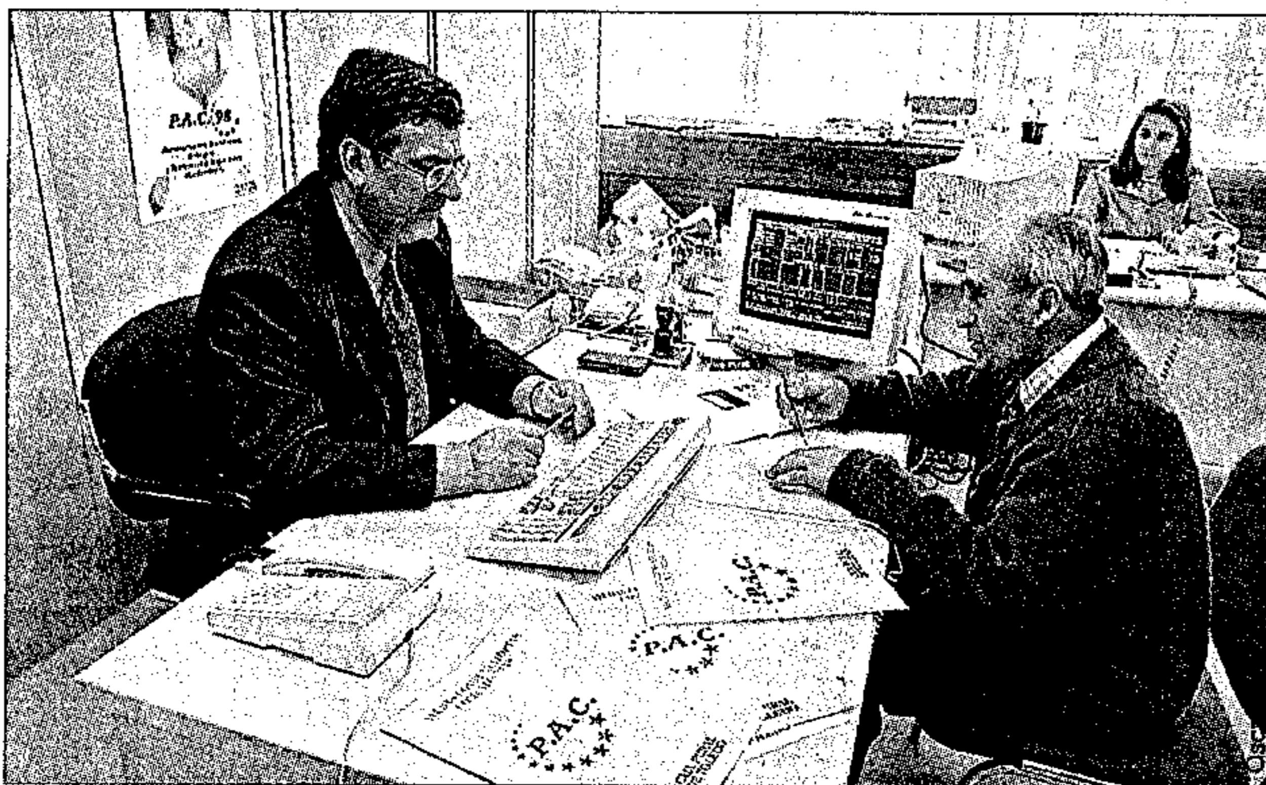
Los agricultores deberán afrontar en el año 2000 nuevos cambios en las ayudas de la PAC

al cumplimiento de determinadas normas medioambientales en la medida que puede suponer una competencia desleal dependiendo del punto en que se parta. Esto preocupa más si se piensa que en una región como Castilla-La Mancha, para alcanzar más competitividad se debe aumentar la productividad marginal en casi todas las producciones, y esto se consigue utilizando más inputs.