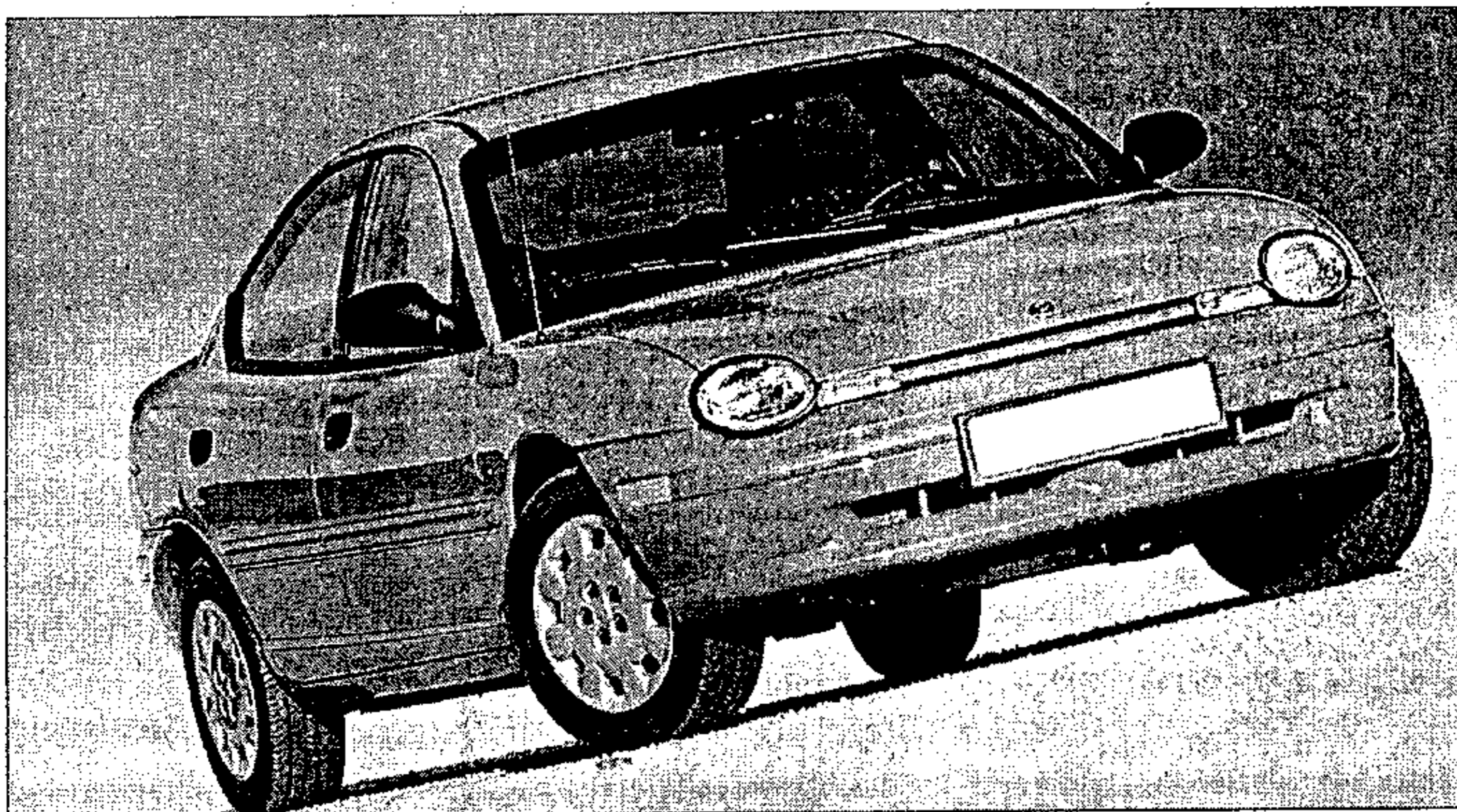
El Chrysler Neon dispone airbag para conductor y acompañante, dirección asistida y aire acondicionado

E L nuevo Chrysler Neón 1.8I, de inmediata comercialización en España, llega al mercado tras una profunda revisión del vehículo, en el que se han incorporado en torno a un 30 por ciento de componentes nuevos. Todo ello con el fin de adaptarse plenamente al gusto de los automovilistas europeos. La primera novedad en este Neon es la incorporación del motor 1.8I, derivado directamente del 2.0I.