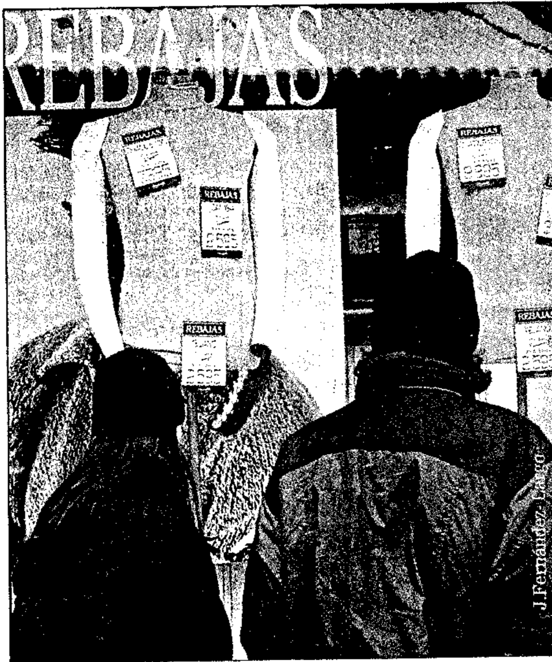
Los comerciantes de Guadalajara consideran que es necesario estar unidos para conseguir afrontar las dificultades con las que cuentan

dera que «los comerciantes debemos estar unidos para conseguir afrontar las dificultades con las que cuenta el sector, porque muchas veces los mayores enemigos que tenemos somos nosotros mismos».