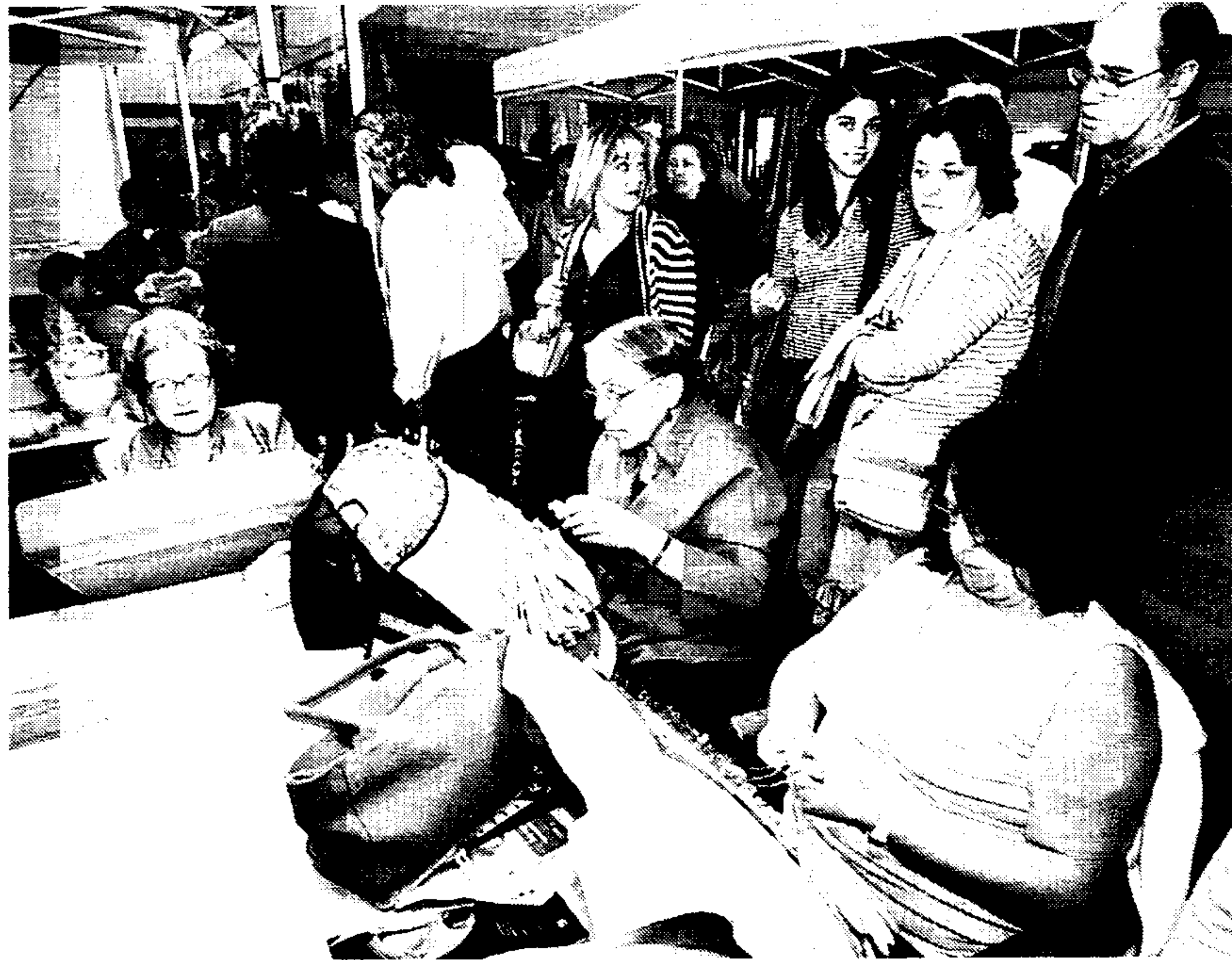
Farcama se ha convertido en un referente nacional de la Artesanía

En la provincia de Guadalajara las ferias previstas son: XXVI Feria Apíco-