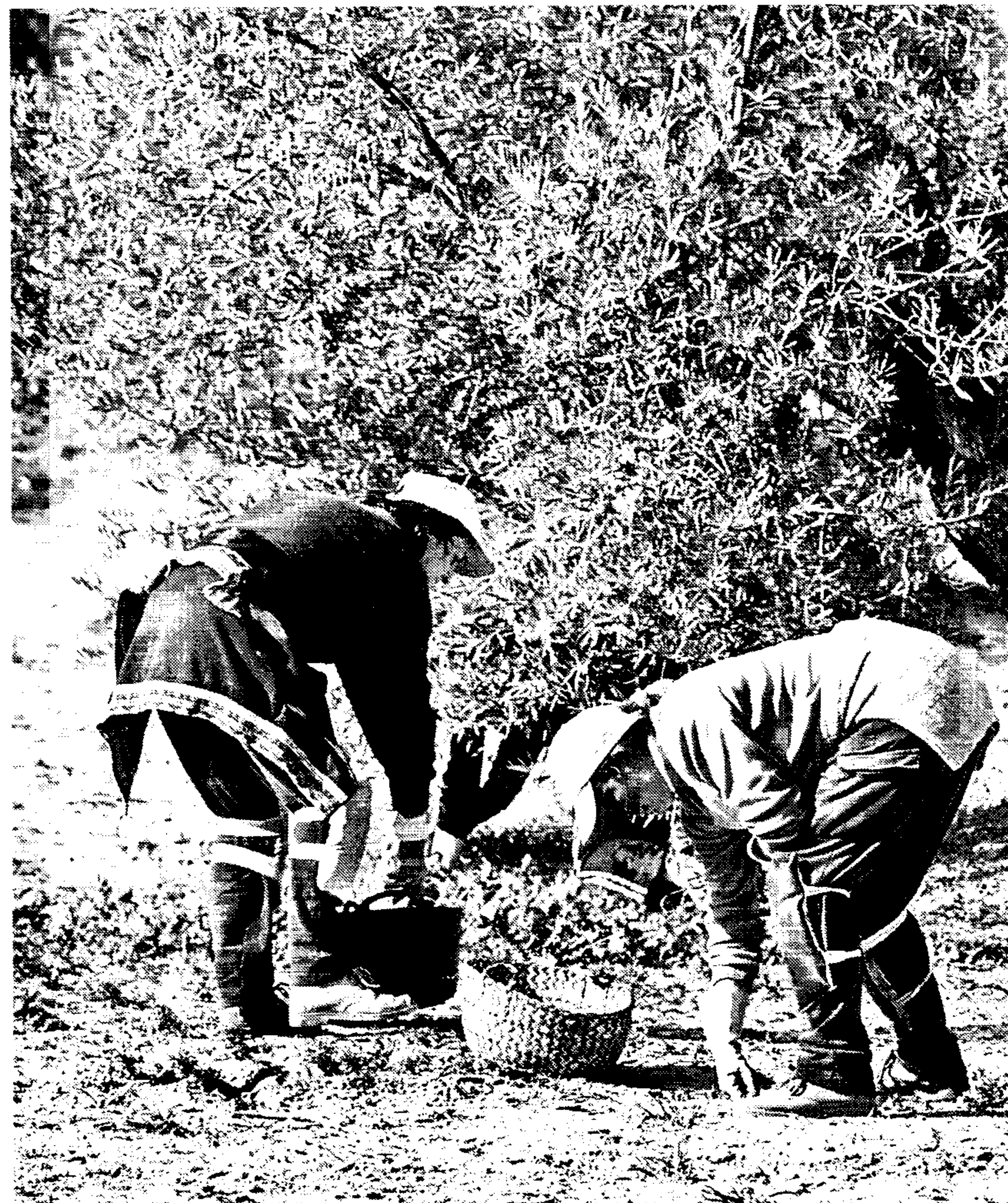
En todas las comarcas, la producción será inferior a la de la pasada campaña

En Guadalajara se espera una ligera subida de cosecha respecto a la cam-