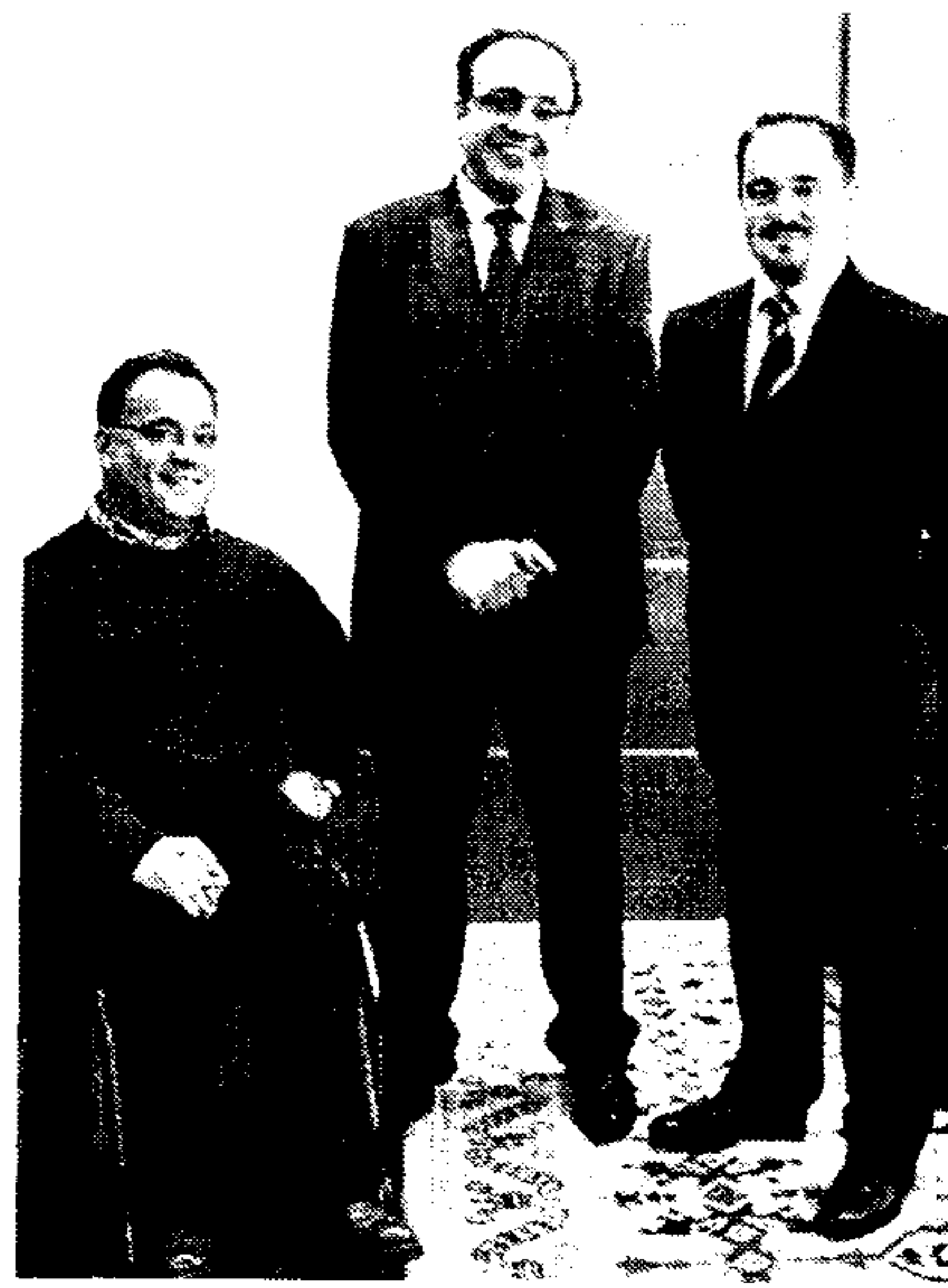
El consejero de Industria y los responsables de Cocemfe

En este encuentro, el responsable de la Consejería de Industria y Tecnología mostró su disponibilidad para estrechar la cooperación de forma que la oferta turística de Castilla-La Man-