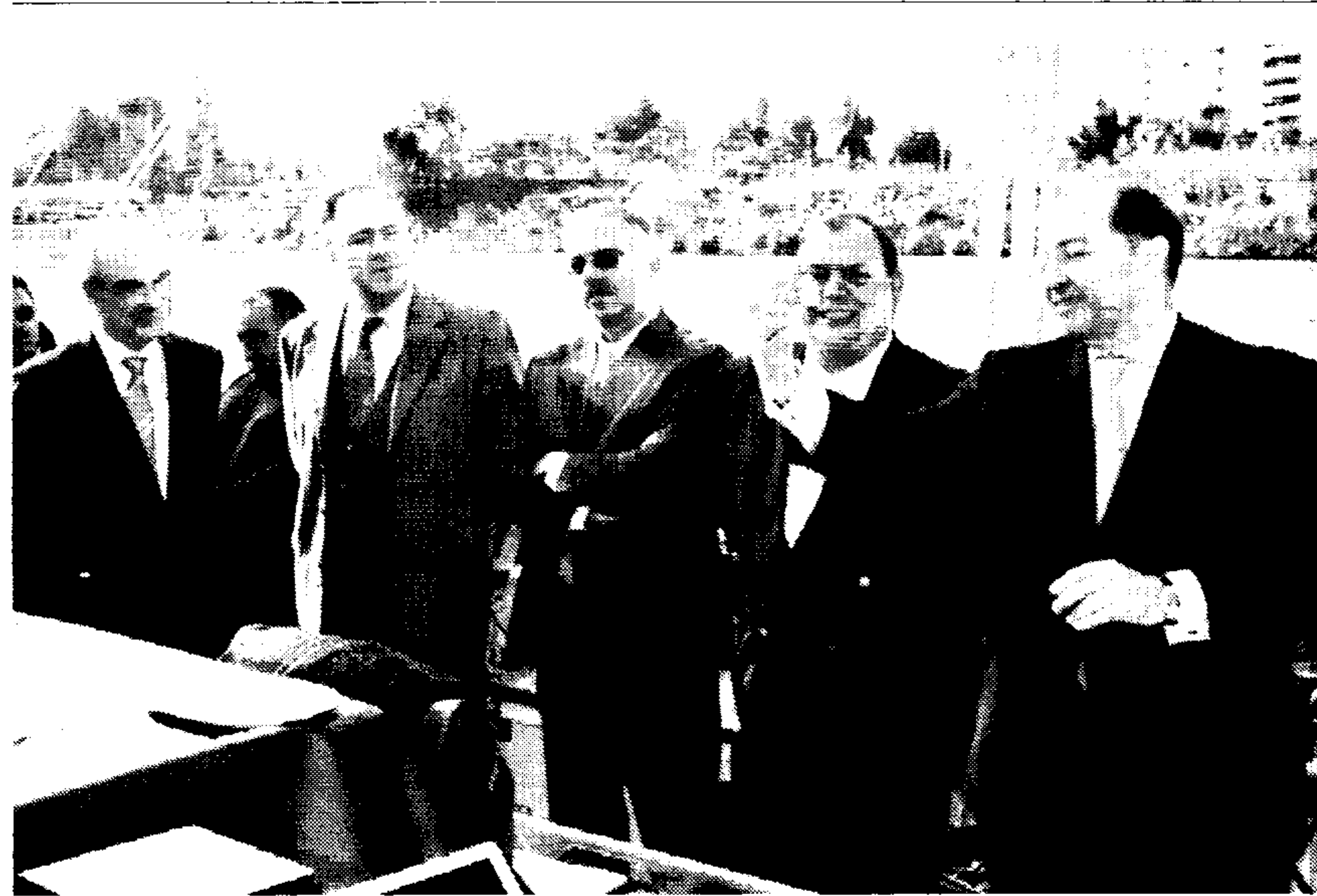
La firma del acuerdo tuvo lugar en la ciudad de Sevilla

Sotos destacó que para este año se iniciarán los acuerdos y convenios con el nuevo Polígono Logístico y Aeronáutico en el que se instalará la empresa Eurocopter.