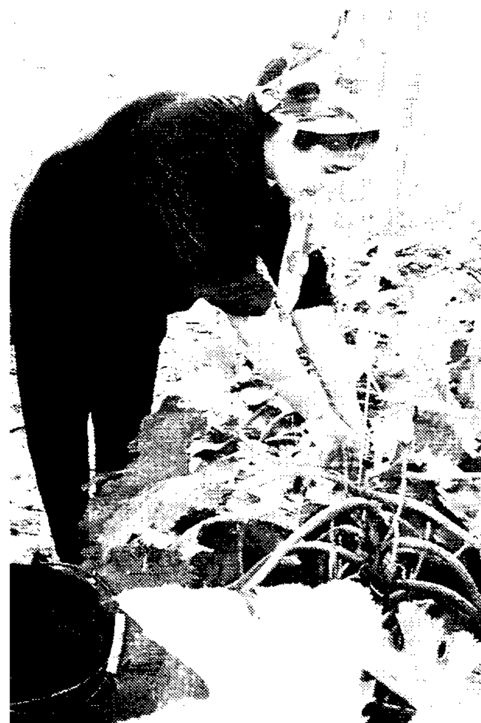
El pasado año se incorporaron a la actividad agraria un centenar de mujeres

La línea de ayudas para la primera instalación de jóvenes a la agricultura