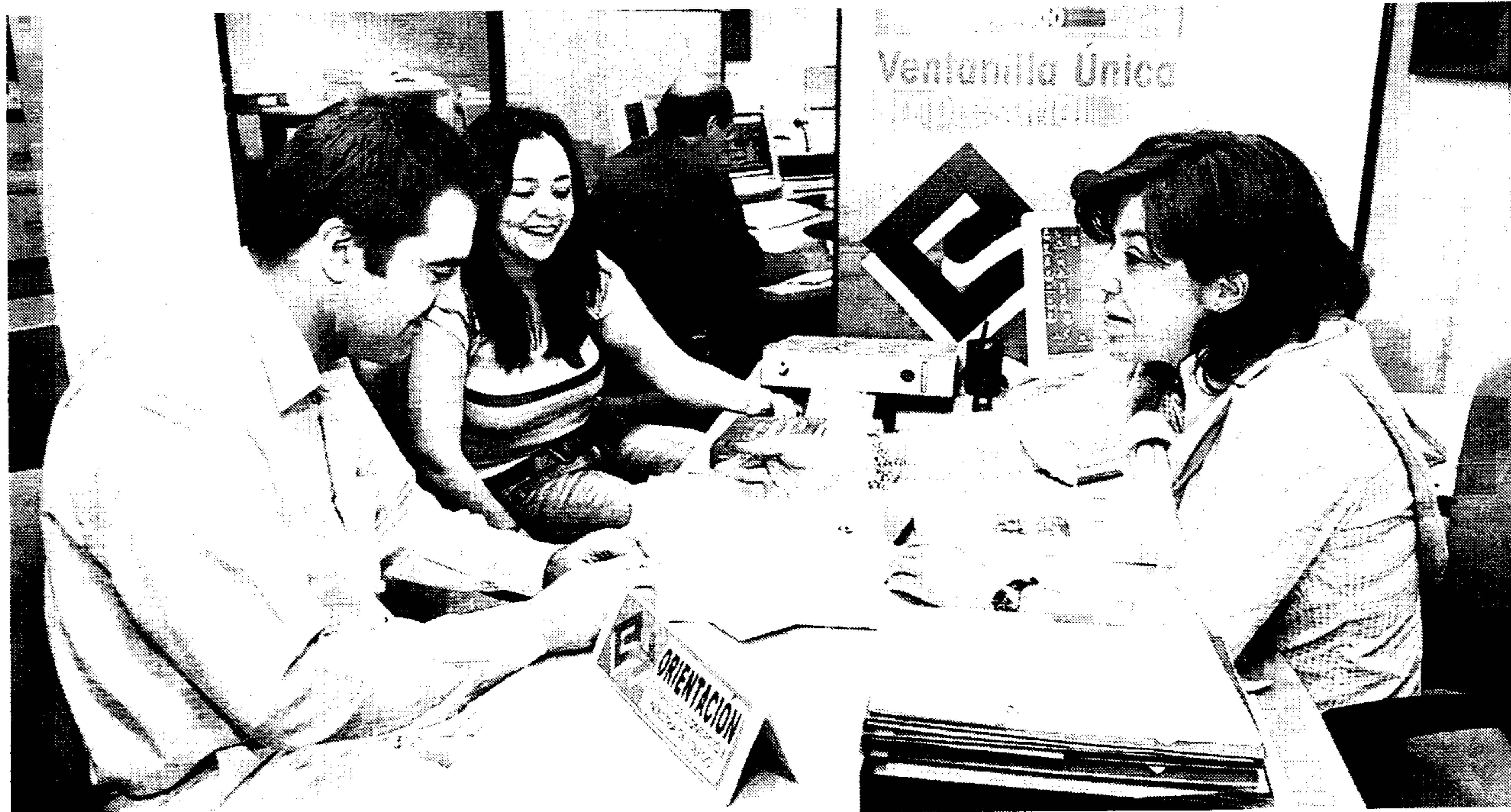
La Ventanilla Única Empresarial ofrece asesoramiento empresarial gratuito y personalizado

Una iniciativa novedosa este año ha sido la puesta en marcha del Programa Español como Recurso Económico gracias al cual se han realizado acciones en India y Estados Unidos que posteriormente han tenido su correspondiente misión inversa en Castilla-La Mancha. También destacan las acciones para la captación de inversiones realizadas con Francia, Estados Unidos, Japón, Gran Bretaña, Dinamarca, Italia y China.