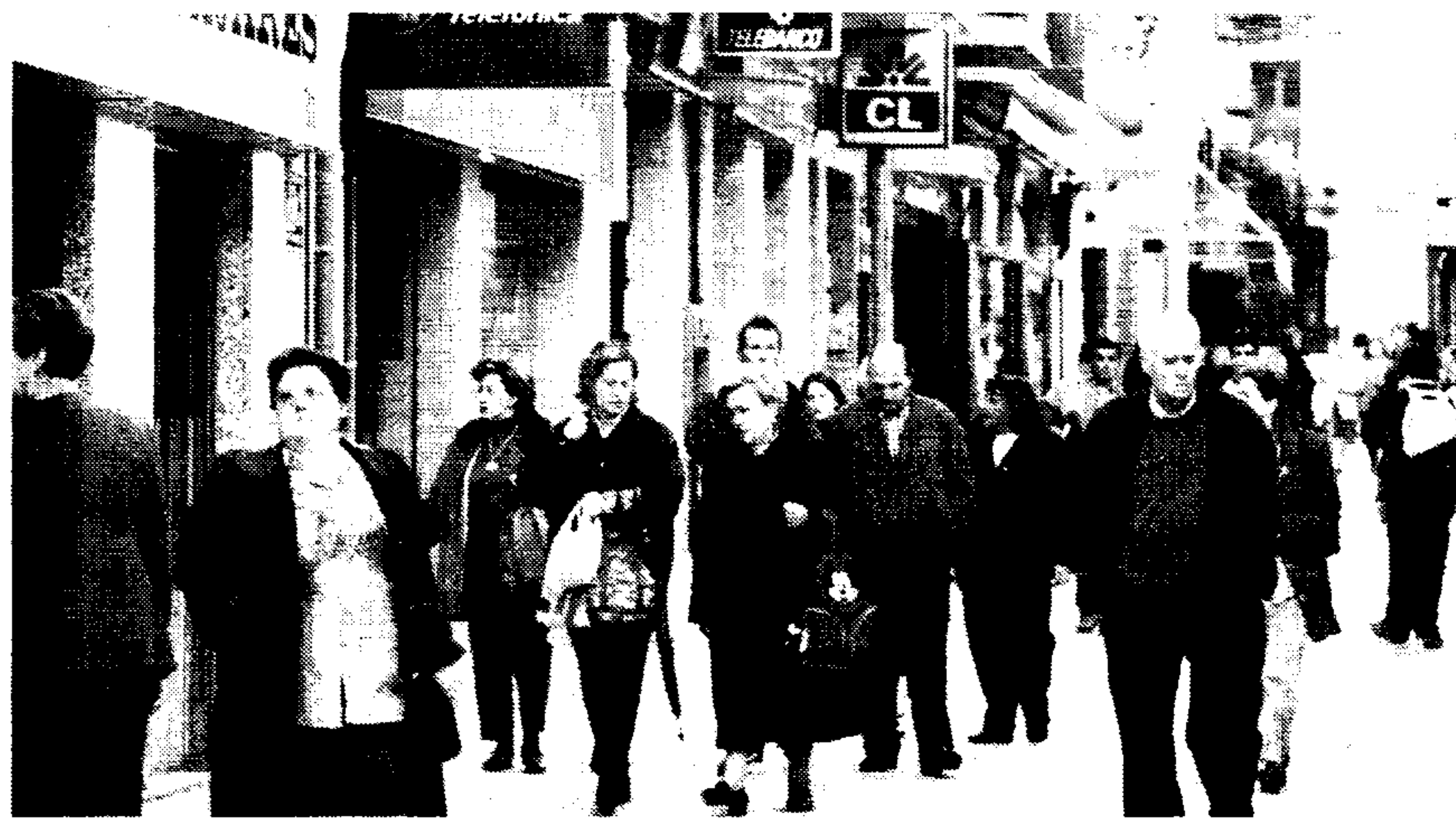
Guadalajara cuenta con un total de 213.505 habitantes

bitantes), Iniestola (15 habitantes) y Castilnuevo, que incrementa su padrón en cinco habitantes y pasa de nueve a catorce.