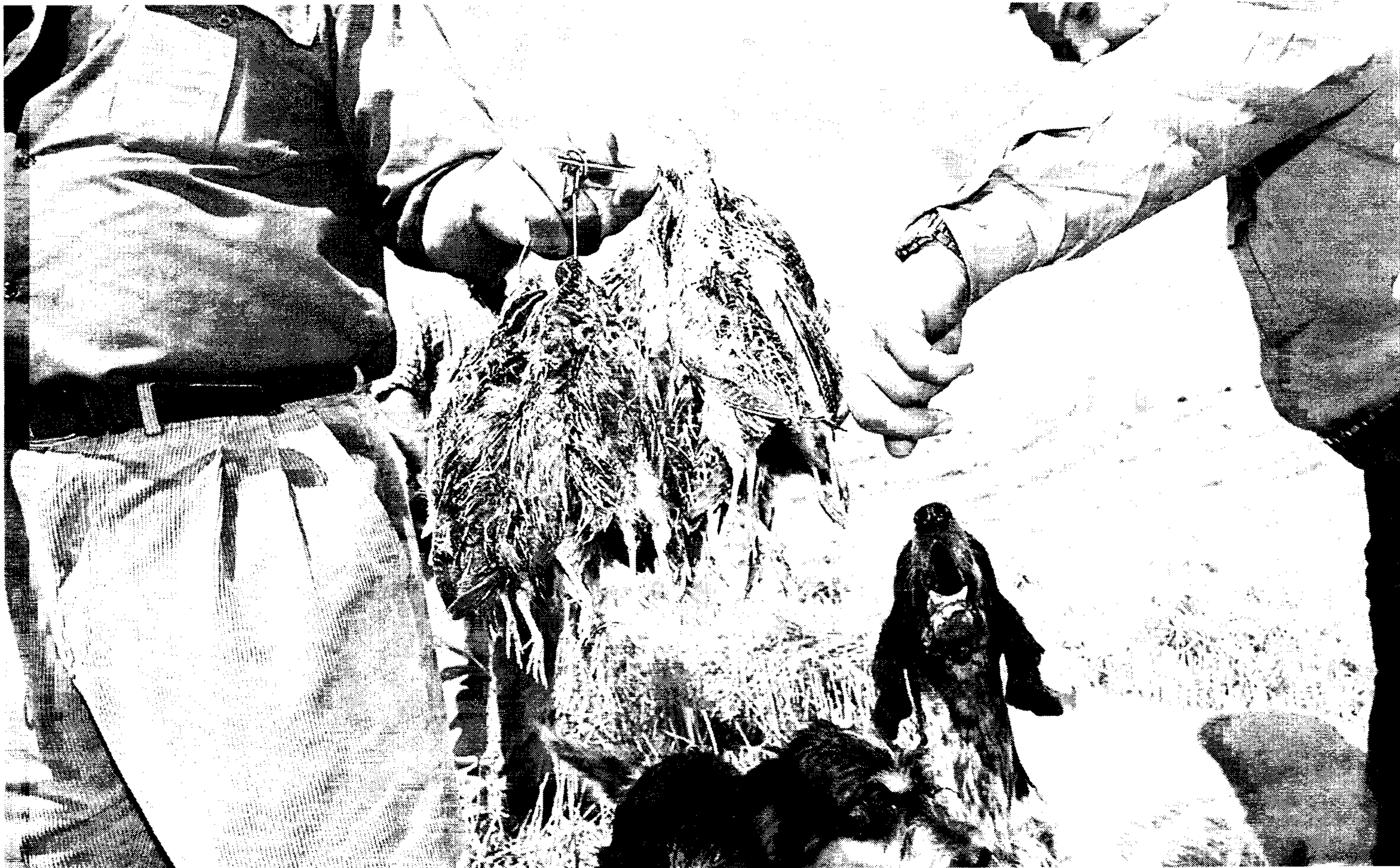
Tanto la caza mayor como la menor atrae a Castilla-La Mancha a miles de aficionados a la actividad cinegética