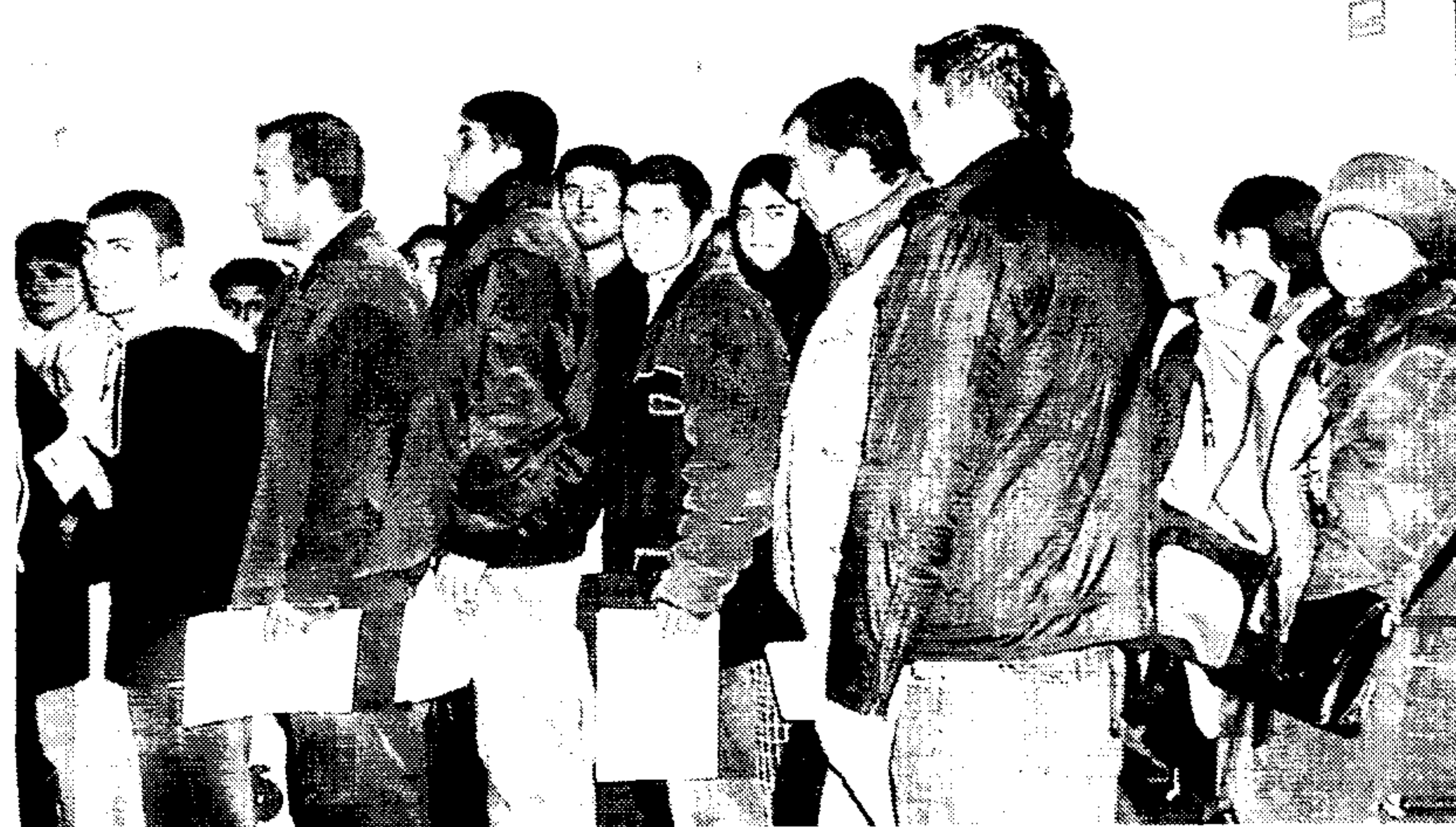
La imagen fue tomada en Bucarest durante el proceso de selección

Ésta es la cuarta campaña de aceituna que Asaja de Toledo recurre —dadas las dificultades que tienen los olivareros para encontrar trabajadores agrícolas que reúnan los requisitos legales para ser contratados— a los contingentes de extranjeros del Ministerio de Trabajo y Asuntos Sociales para traer trabajadores de temporada. En esta ocasión, los empresarios agrícolas que han contratado a jornaleros extranjeros proceden de las localidades de Mora, Los Nava-