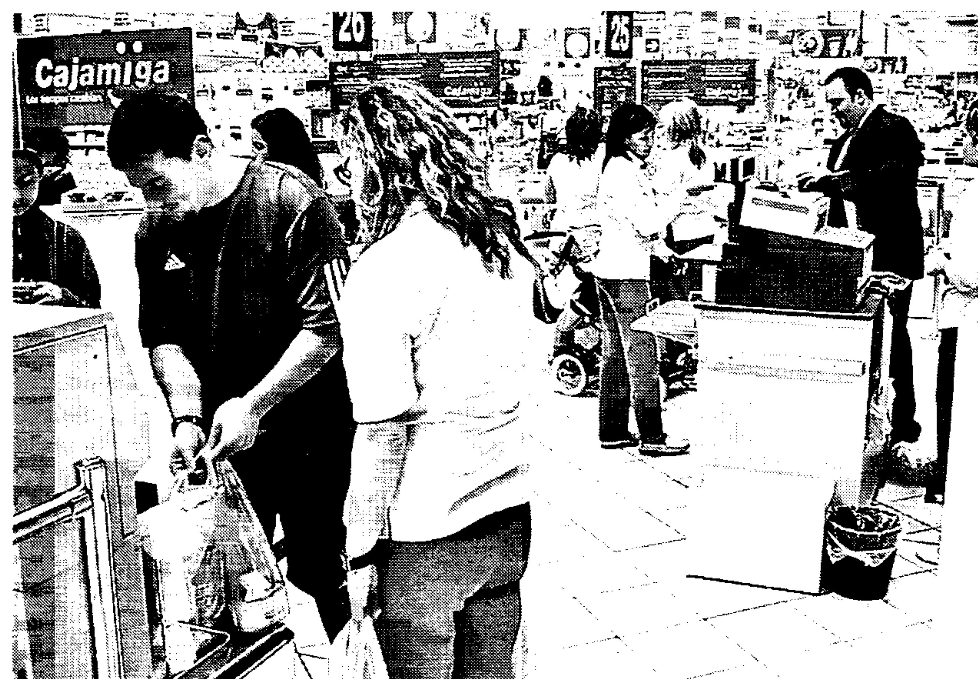
Las nuevas cajas ofrecen numerosas ventajas a los usuarios

12 Un total de 24 establecimientos turísticos de Castilla-La Mancha obtuvieron la «Q» de calidad durante la celebración del último comité del Instituto para la Calidad Turística de España (ICTE), celebrado en noviembre. Esta región se convierte así en una de las que ha logrado más certificaciones en este comité.