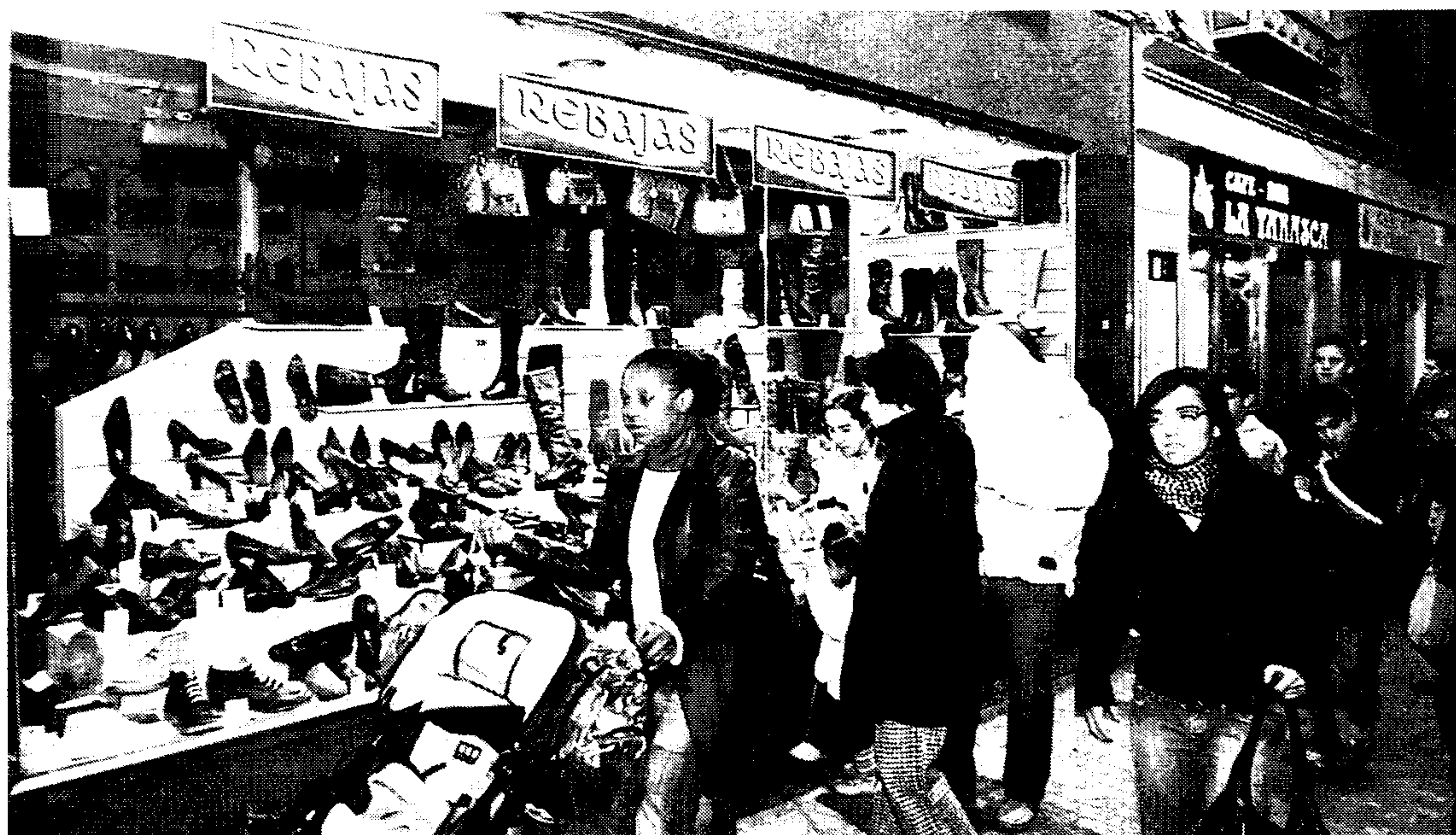
Los comercios de la provincia de Toledo verán reducidas las tasas de descuento un 10%

9 Como consecuencia de las nuevas Tasas de Intercambio que han entrado en vigor en enero de este año, tras el acuerdo alcanzado por la Federación de Comercio y los distintos sistemas de pago con tarjeta, la Federación Empresarial Toledana estima que los comerciantes de la provincia de Toledo se ahorrarán un millón de euros, de los mil millones de euros aproximadamente que el comercio nacional paga en concepto de comisiones a las entidades financieras por las compras que hacen los consumidores con tarjetas de crédito y débito.