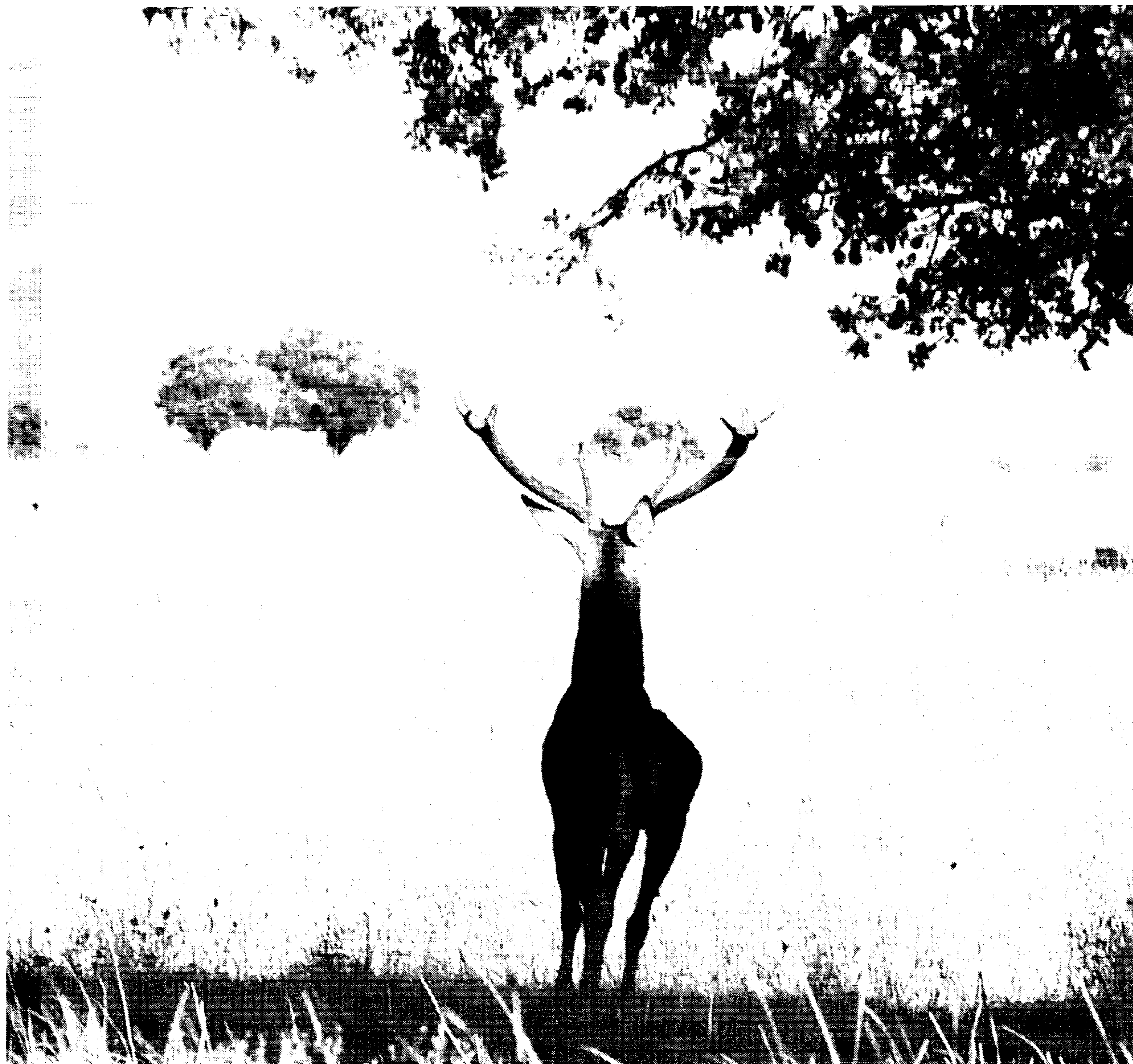
El venado , uno de los protagonistas de la temporada de caza. Se abaten cada temporada una media de 20.000