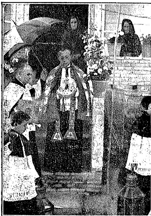
.....hubo que defenderle con un rústico quitasol....

Fracasaban sus planes, su labor toda, que quedaba anulada. Con él desaparecía todo su yo, glorioso y noble, porque fué el de un luchador honrado.