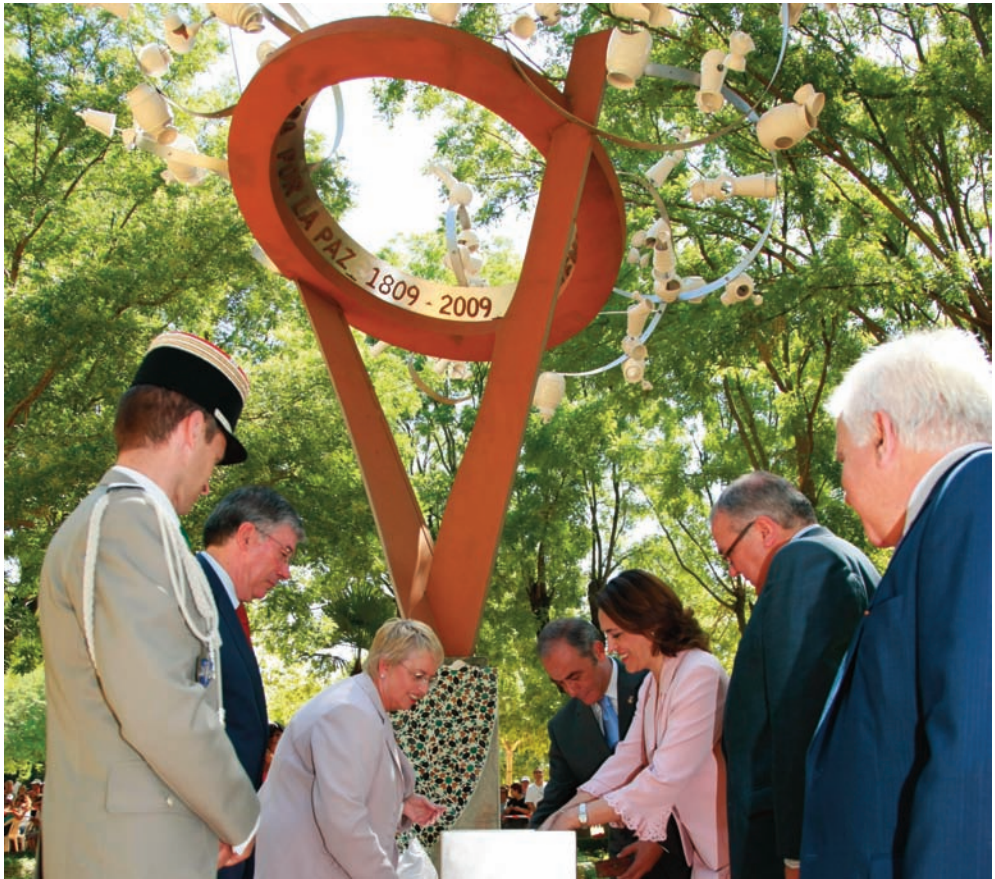
Actos el día 28 de julio con la celebración de un solemne acto institucional en el cual se descubrió el monumento conmemorativo del bicentenario de la Batalla de Talavera.

Todo ello ha dado lugar a un calendario de actos y de iniciativas de diferente contenido que se celebraron a lo largo del año 2009, cuyo objetivo fue el de difundir en la sociedad, el papel desempeñado por Talavera en los acontecimientos objeto de la conmemoración, como lo es el hecho de