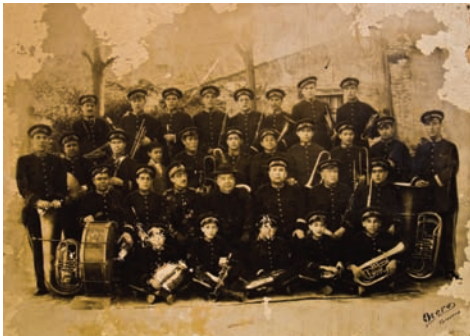
En 1909 arranca la historia de la Banda

Nuestra historia comenzó allá por el 1909 cuando debido a la presión popular y la indignación provocada en la ciudad porque tuvieran que venir músicos de fuera de la localidad a la inauguración del Puente de Hierro hicieron plantearse al Ayuntamiento la creación de una Banda Municipal. Este trinomio de los talaveranos, músicos y Ayuntamiento tendrá mucho que ver, como ya veremos, en toda la historia de nuestra Banda.