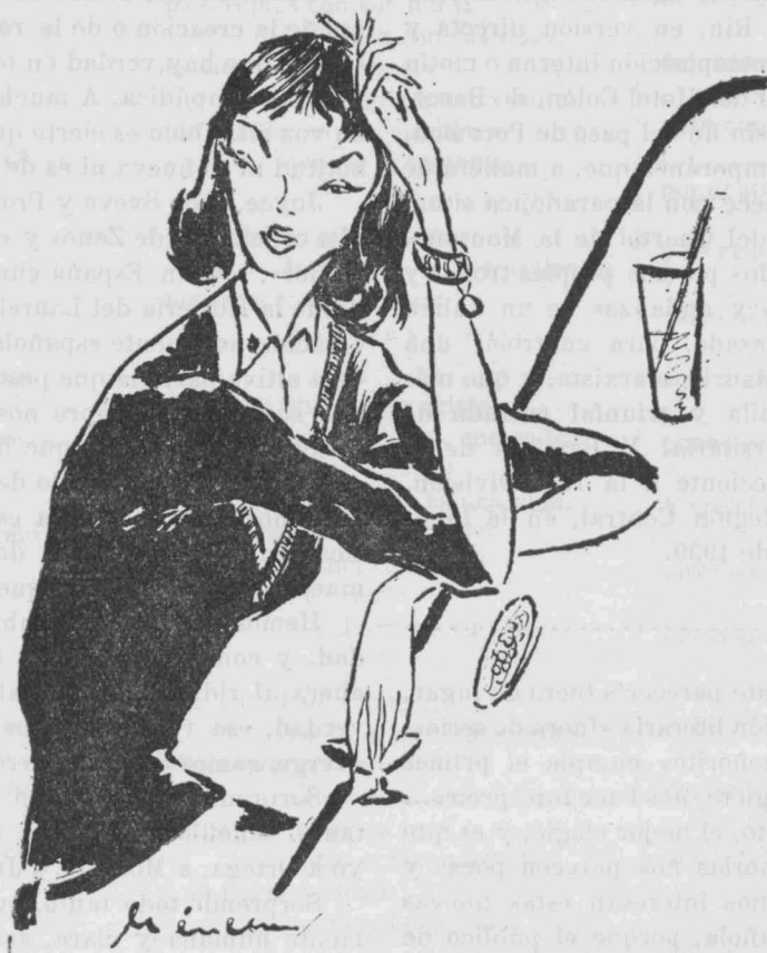
Un bar que frecuentamos con una chica, nos hace intérpretes...

Tenemos fe y esperanza en ver un día, antes que otros «fuera de juego» (en el más amplio sentido de la expresión) se nos adelanten y nos hagan «su versión» (que sin ser equivocada o falsa puede ser eso precisamente, «su